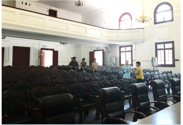
梧州中山紀念堂內大會堂一景

紀念堂內有一大會堂，能容納1000多人，大會堂前端為主席臺，主席臺上方塑有古銅色孫中山像，並書寫有國父遺囑。左右兩側有孫中山的兩句訓示：「革命尚未成功、同志仍須努力」。會堂內除座椅在西元2011年重新更換過外，主席臺上方之孫中山塑像等都是當時建成時已經完成的，在文化大革命期間，幸經當時梧州人民用黃泥和稻草覆蓋，