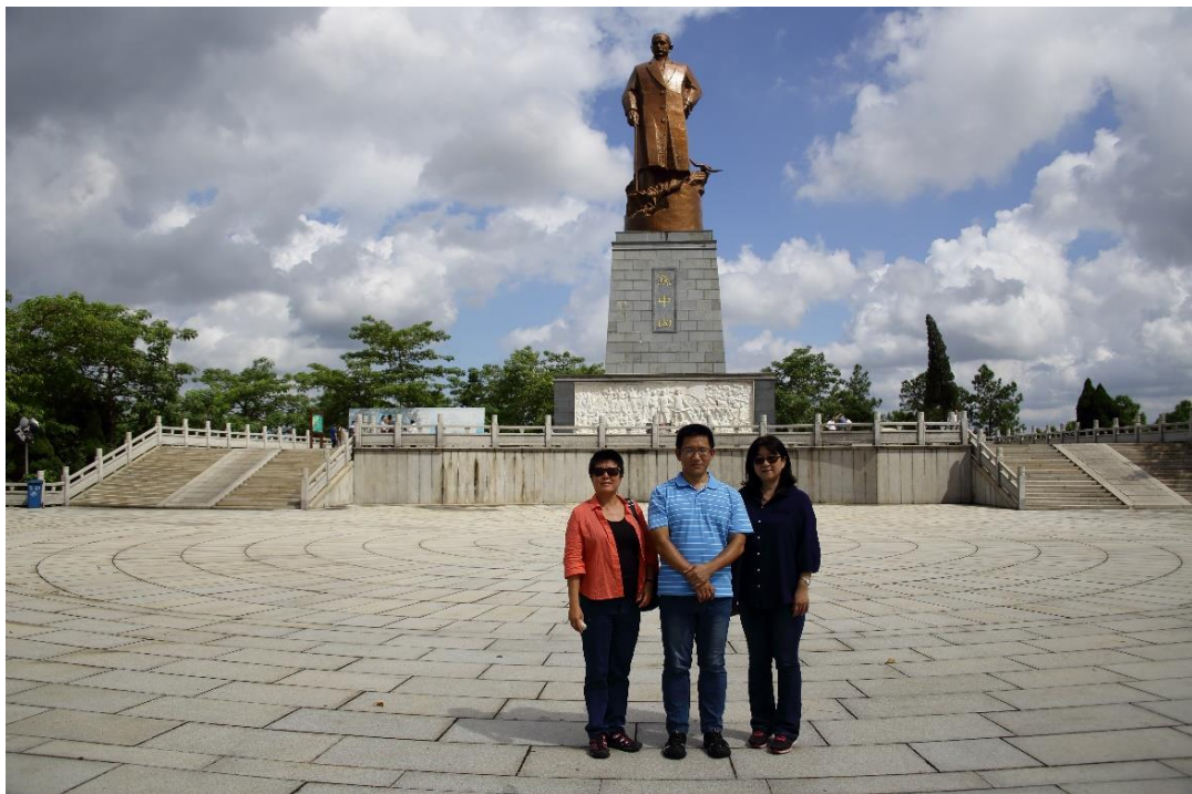
本館楊副館長與同仁於欽州孫中山銅像前合影

孫中山先生銅像屹立在公園的最高處，銅像高13.88公尺，基座為15.8公尺高，總重達30餘噸，是世界最高的孫中山先生銅像。銅像由中國著名雕塑家潘鶴教授創作設計，銅像基座由花崗岩構成，四周有各有一幅長11.36公尺、高3.6公尺的漢白玉浮雕構