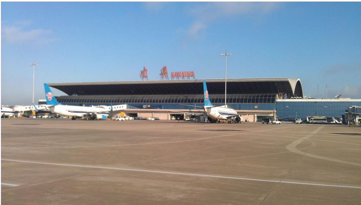
廣西南寧機場

當天搭乘中國南方航空班機（CZ 3046），到廣西南寧吳圩國際機場，由於班機起飛延遲，直到晚上11點多才入住飯店。