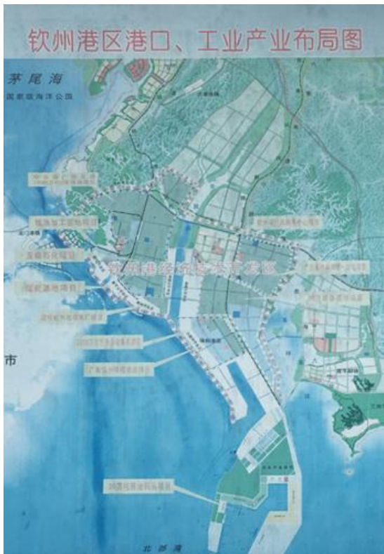
欽州港區港口、工業產業佈局圖

目前欽州港發展迅速，已成為中國第六個沿海保稅港區—欽州保稅港區。由於欽州港成為中國大陸國家經濟發展區，當地政府為感念孫中山，於西元1966年在欽州港仙島公園山頂上建立一座世界上最高最大的孫中山銅像。