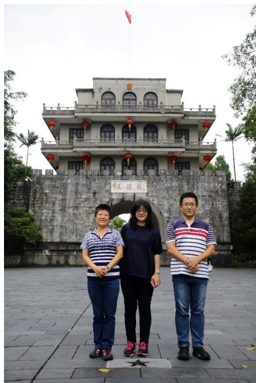
本館人員於友誼關前合影