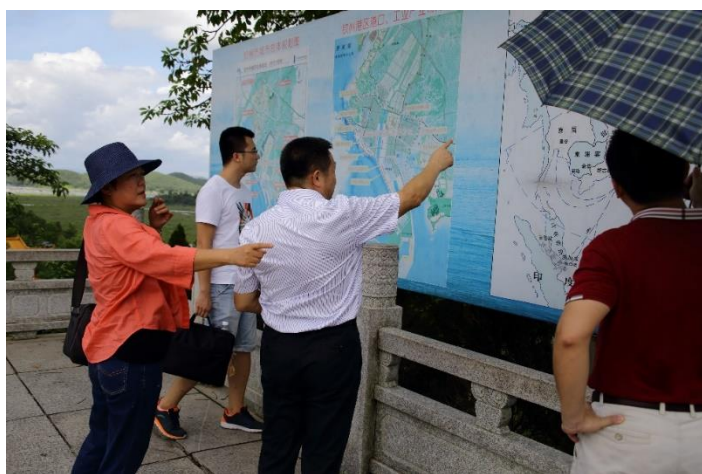
欽州港仙島公園內展示牆上介紹廣西北部灣的經濟發展圖

孫中山在《實業計畫》中規劃的港口、交通建設，中國大陸正依照孫中山當年的計畫，逐建規劃建造完成。我們在此次的參訪行程中都感受到交通的便利，從南寧到