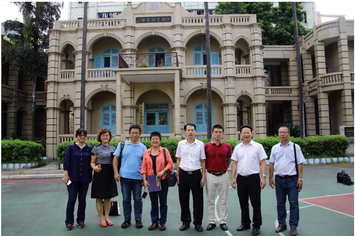
本館一行人與民革廣西區委會等人於防城中學謙受圖書館前合影

接著我們前往附近的防城中學，中學本身與民國革命並無關聯，不過其創辦者故中華民國陸軍上將陳濟棠先生則是開國元老，他於清末就讀軍校時期即加入同盟會，投身革命，民國建立後，陳濟棠即追隨孫中山先生，曾參加孫中山先生所領導的護國戰爭、護法戰爭和討伐陳炯明戰爭。防城中學的前身為三都書院，民國10年由陳濟棠出資改建為國立防城中學，是防城港市歷史最悠久的學校。校內有座建築風格獨特，中西合璧的法式古典建築，名為「謙受圖書館」，是陳濟棠在創辦防城中學後，為改善防城中學的辦學條件而於民國18年出資興建。圖書館名為「謙受」，是因為陳濟棠為紀念其父生前提出的「敬教勤學」、「興起鄉邕文化」的遺教，故以其父之名命名。20世紀30年代末，圖書館藏書量曾達10萬餘冊，其中有《萬有文庫》、《四庫全書》等珍貴典籍，是當時兩廣屈指可數的圖書館。