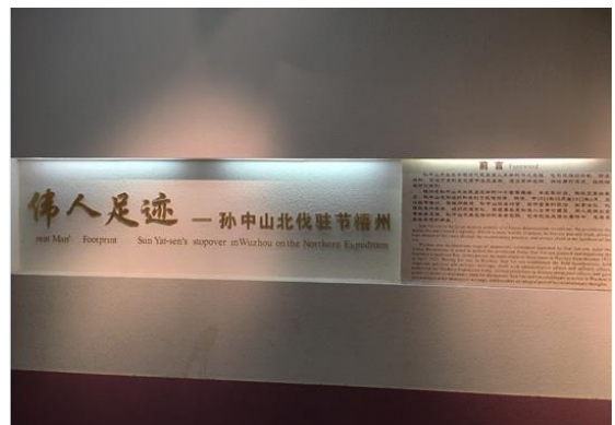
梧州中山紀念堂內展覽