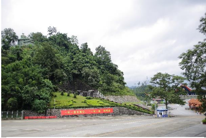
友誼關位於中越邊境

友誼關距離南寧約有170多公里路程，走高速公路需2個多小時，它位於廣西憑祥的中越邊境，目前有湘桂鐵路和國道322線與越南的鐵路公路相銜接，是中國通往越南及東南亞國家最大最便捷的陸路大道。