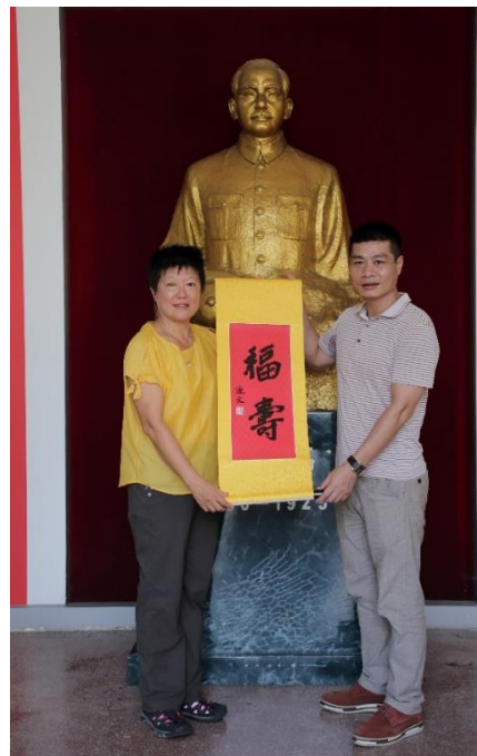
民革廣西區委會致贈本館廣西壯族藍染工藝品 本館致贈民革廣西區委會國父墨寶複製件