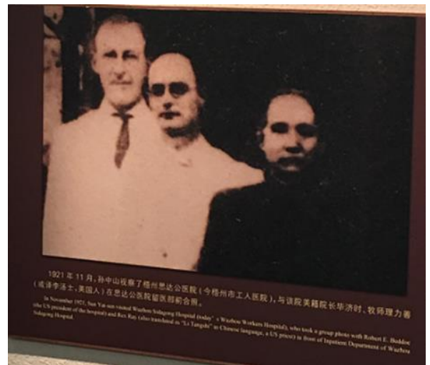
孫中山在民國10年視察梧州思公達醫院，與當時的美籍院長畢濟時的合照

展廳內陳列有《偉人足跡－孫中山北伐駐節梧州》、《水都風雲－辛亥革命與梧州歷史陳列》以及《國之瑰寶－宋慶齡》展覽，其中有一張歷史照片別具意義，該張照片為孫中山在民國10年視察梧州思公達醫院（今梧州市工人醫院），與當時的美籍院長畢濟時的合照。這張照片原收藏在院長家，後畢濟時的女兒回梧州尋根時，送複製品給紀念堂展示。