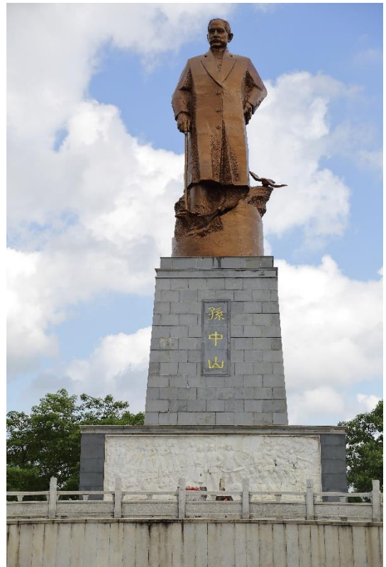
位於欽州的孫中山銅像是世界上最高的銅像