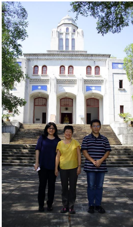
本館一行人於梧州中山紀念堂前合影

梧州中山紀念堂是中國最早建成的中山紀念堂，坐落於梧州市中山公園內。孫中山為籌備北伐，曾於民國10年至11年，先後3次駐節梧州。民國14年3月12日，孫中山在北京逝世後，梧州善後處處長李濟深倡議集資在北海公園內籌建中山紀念堂，於民國15年1月奠基，民國17年7月破土動工。不久粵桂戰事爆發，工程被迫停止，民國19年春才得以續建，後於民國19年10月建成。