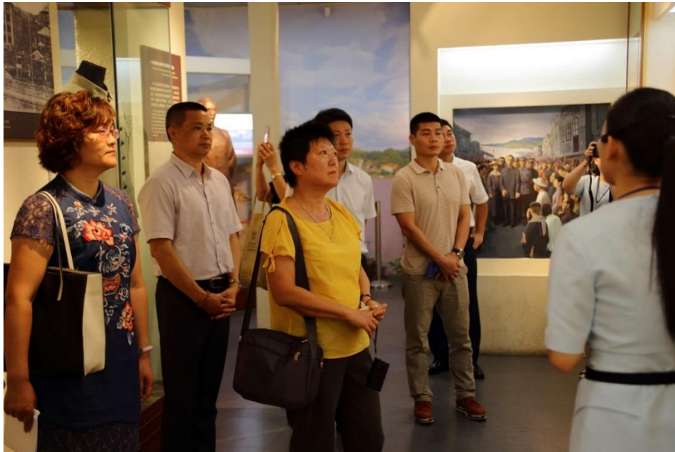
座談會一行人聆聽梧州中山紀念堂導覽人員講解

座談會議開始前，全體與會人員在該館的導覽員引導下，參觀了紀念堂的園區景觀及內部設施與展覽，並互贈紀念品。