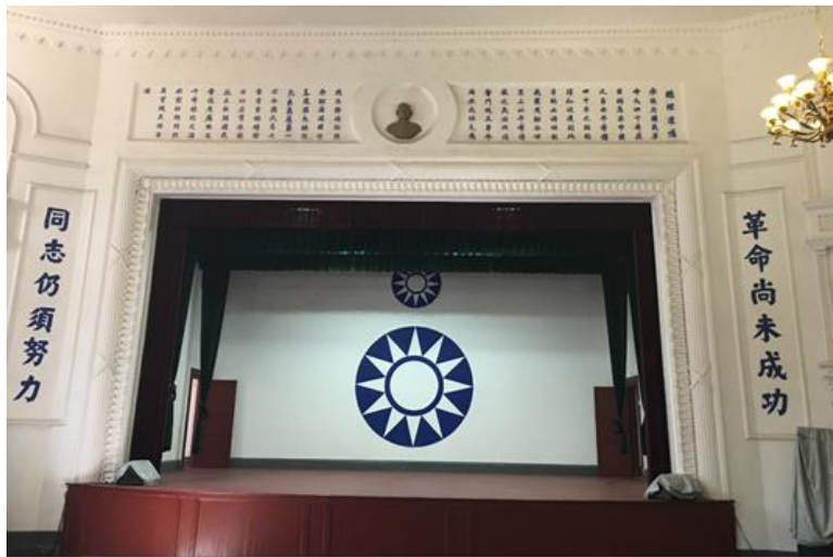
梧州中山紀念堂內大會堂主席台上方有孫中山塑像

躲過文化大革命的浩劫，直到改革開放後，再將黃泥、稻草去除，才得以保存原貌。今天我們能在這裡看到80多年前完成的孫中山塑像是非常珍貴的。