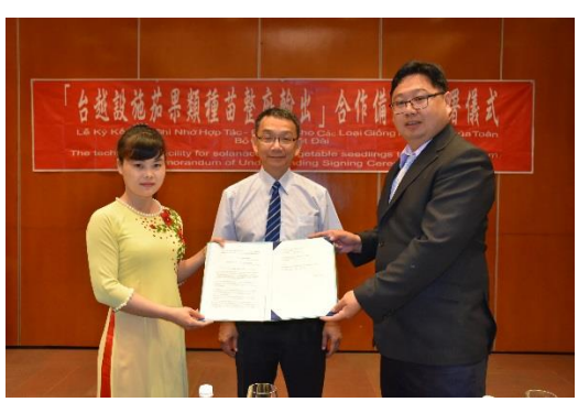
花蓮場媒合及見證台越合作備忘錄的簽署