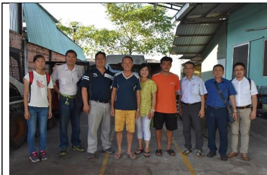
與草菇農場主人合照