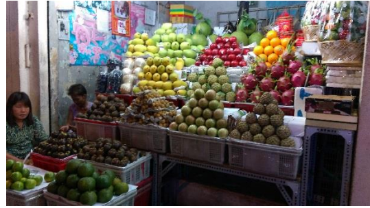
傳統市場販售水果的攤販，多為台灣常見的熱帶水果