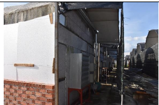
利用保麗龍及不織布來保持菇房的溫度以隔絕外界的高溫