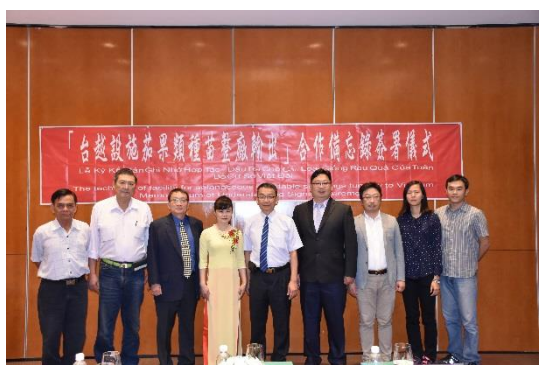
台越設施茄果類種苗整廠輸出合作備忘錄參與人員合照