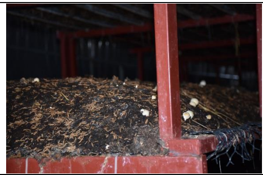
草菇在菇房出菇的情形