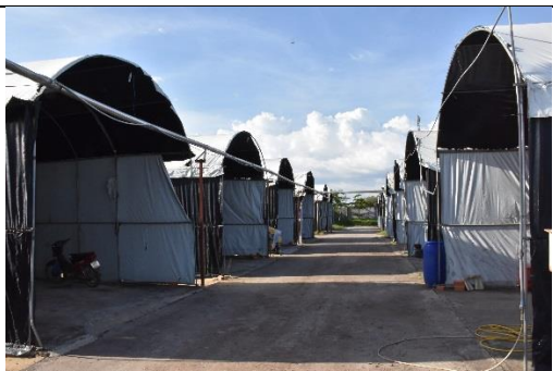
農場的菇房利用鋁管作為主結構而外批覆塑膠布