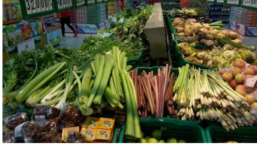
超級市場販售多種野菜，如芋梗