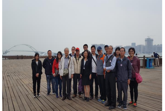
抵達廈門五通碼頭