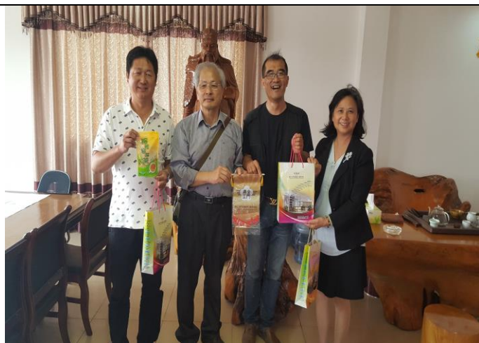
致贈台商企業本校特產