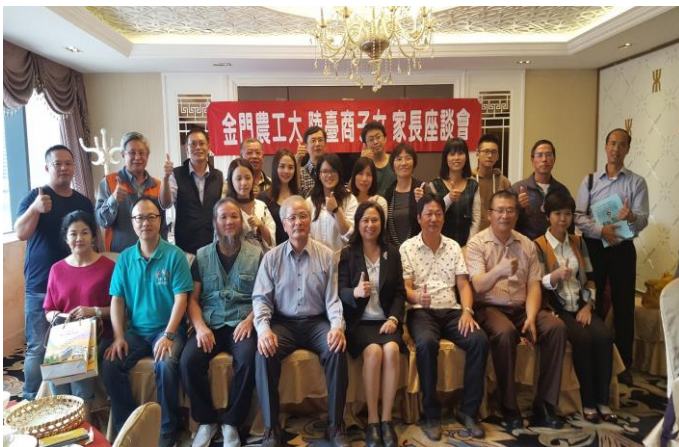
榮譽飯店家長座談