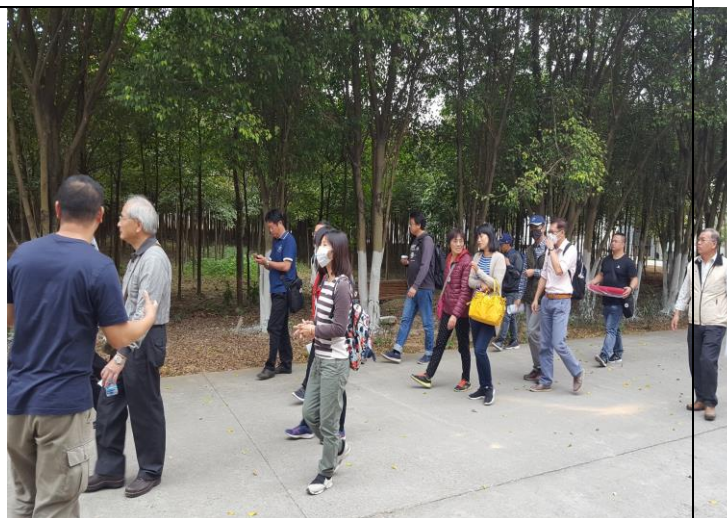
台商企業種植林木