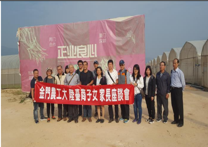
參訪台商企業正心精緻農業有限公司