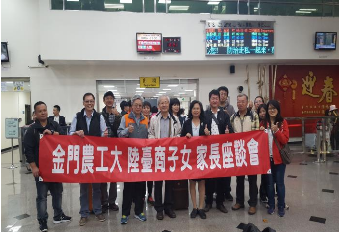
金門水頭碼頭出發