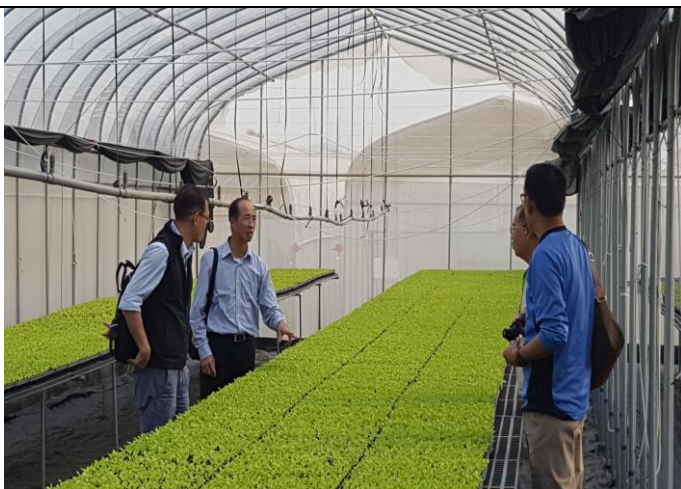
參觀農場作業程序