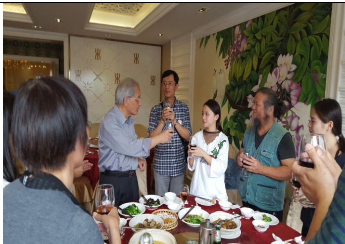
姚督學勉勵家長及學生