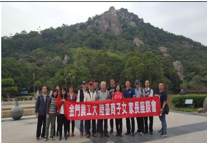
參觀「閩南第一洞天」漳州-雲岩洞