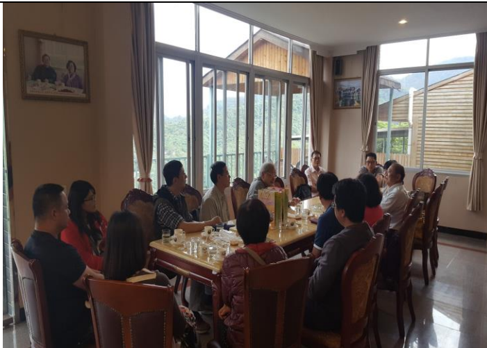
南坑咖啡創辦人分享創業經歷