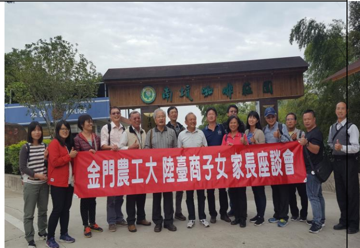
參訪台商企業南坑咖啡園