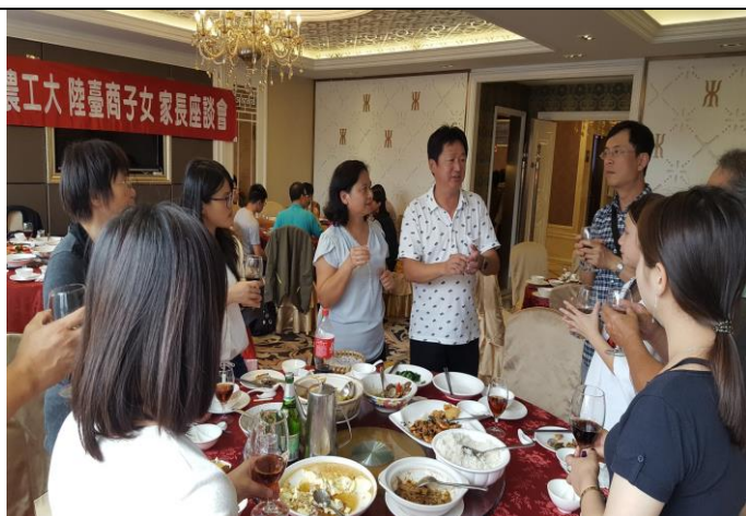
家長會長勉勵導師及家長