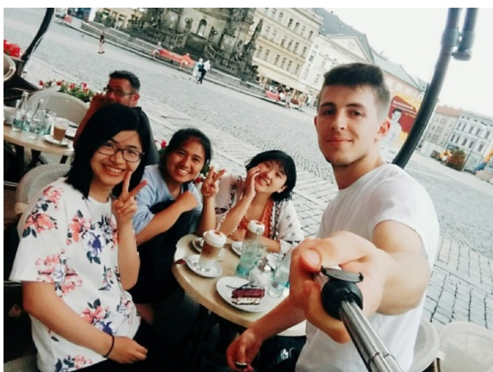
(照片說明：和夏日學校同學共進午餐)