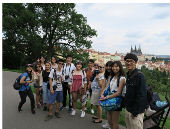
(照片說明：在布拉格高保區合影)