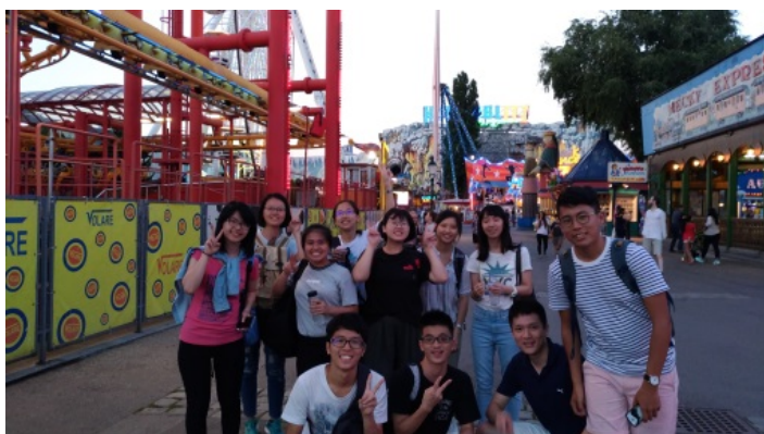
(照片說明：普拉特遊樂園前合照)