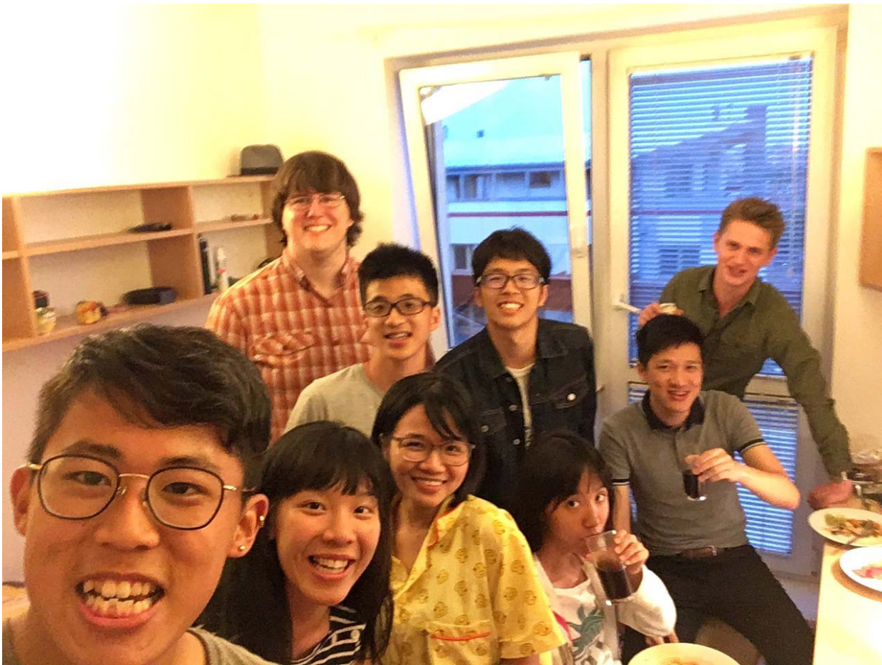
(照片說明：在宿舍和其他外籍生用晚餐[中下黃衣])

初抵維也納，立即感受到唯美的建築物，為這趟旅程開啟美好的一天，參觀著名的美泉宮，體驗哈布斯堡王朝貴族豪華的住所，經過歷史悠久的國家音樂廳、聖史蒂芬主教大教堂，哥德式教堂雖然在整修，仍不減遊客的朝聖，倉促地留下合影，最特別地是維也納街道的建築物每個都獨樹一格，裝飾著不同的雕像或雕刻，和台灣的建築物迥然有別，接著來到捷克 Brno 這座城市，一開始路人總是看向我們，可能比較少華人觀光客，第一次在國外吃火雞，搭配捷克版平價可樂 Kofola，趣味的閒話家常時光，匆匆地來到學校報到，開幕式的自助餐嚐試捷克傳統佳餚與各式甜點，開啟和外國學生聊天的氛圍，認識一位可愛的奧地利女孩，笑聲很嘹亮具有感染力，而且居然知道台灣和中國間微妙的關係，兩周細心地教導捷克語課程的美女老師，總是體貼地設計許多捷克遊戲，讓我們更能活用捷克語於日常中，例如基本的自我介紹、菜單，課程之餘，學校也安排參觀啤酒廠的活動，第一次進入啤酒廠，啤酒儲藏在冷氣房中，依釀造天數各有不同的風味，平日體驗宿舍生活，想念台灣的味道就和朋友一同下廚，喜歡歐洲的牛奶價格平易近人，學校附近的餐廳也是午餐優惠，下午總喜歡到廣場喝杯咖啡配蛋糕，書寫日記與明信片，23 天的夏日學校感受在歐洲讀書的氛圍，是個未完的旅程。