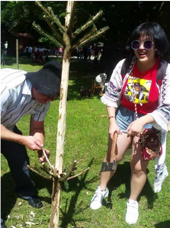
(照片說明：在傳統市集遇到的砍樹皮叔叔邀請我一起體驗)

在 olomoc 學習的兩個禮拜，體驗著和東方天壤之別的教學，即便已在政大學過些許的捷克文，但透過那兩個禮拜的學習，又讓我重新認識了這個語言，也多學了更多應用在當地日常生活的對話。學習不僅僅侷限於教室裡，這趟旅程更是我們最受用的教學，一路上我們竭盡所能和相遇的每個當地人用捷克文對話，不論是餐廳店員也好，抑或看到我們是東方臉孔而前來搭話的居民也罷，即便有一次去到捷克的傳統市集和一位正在砍樹皮的叔叔雞同鴨講了半天，這種冒險又帶點文化衝擊的學習之旅，真的是我一輩子都難忘記的回憶。剛到達台灣的沒幾天後，又忍不住懷念起當地的生活步調，未來我一定還會再到捷克，回味當時曾踏過的每條小徑，追尋沒有到達的目的地。