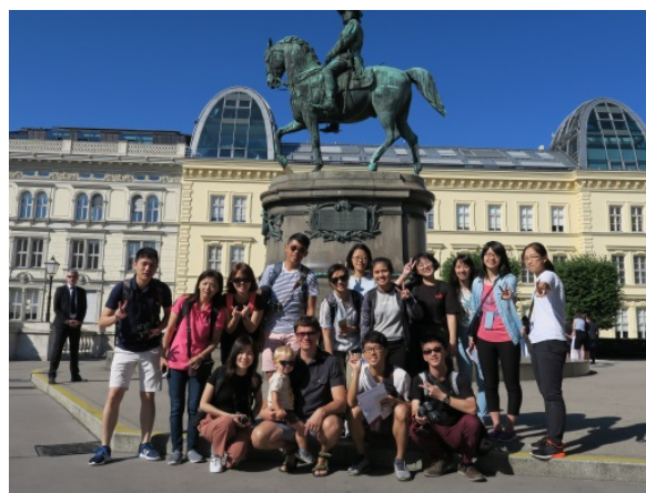
(照片說明：維也納市中心導覽後合照)