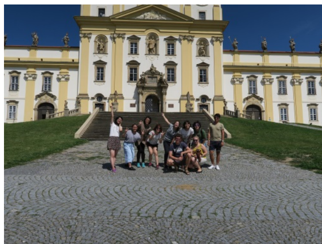
(照片說明：在聖瑪利亞教堂前合影)