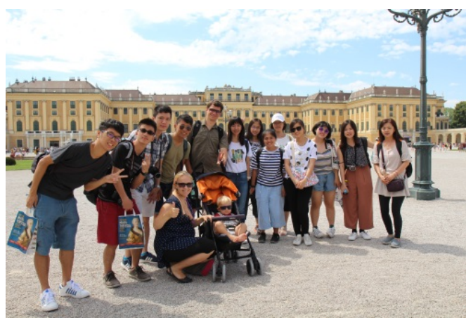
(照片說明：美泉宮前合影)