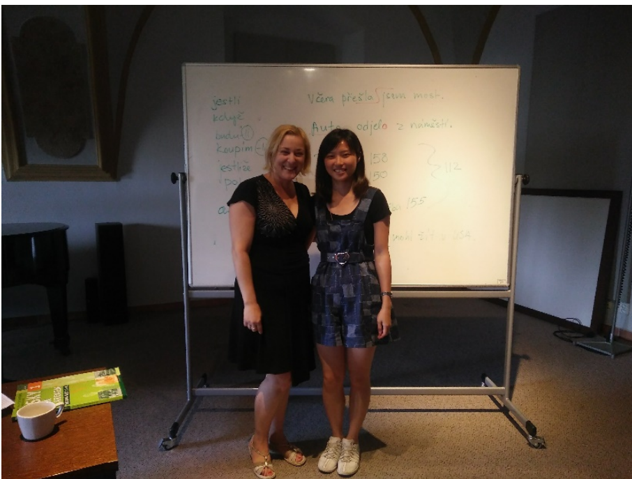
(照片說明：和夏日學校老師合影[右])

Olomouc 一個我憑聲音所選的城市，帶給我的迴響卻如此巨大，一個月的停留，卻給了我家的感受，假若還有一次機會，我還想回家，回到我的歸屬地。