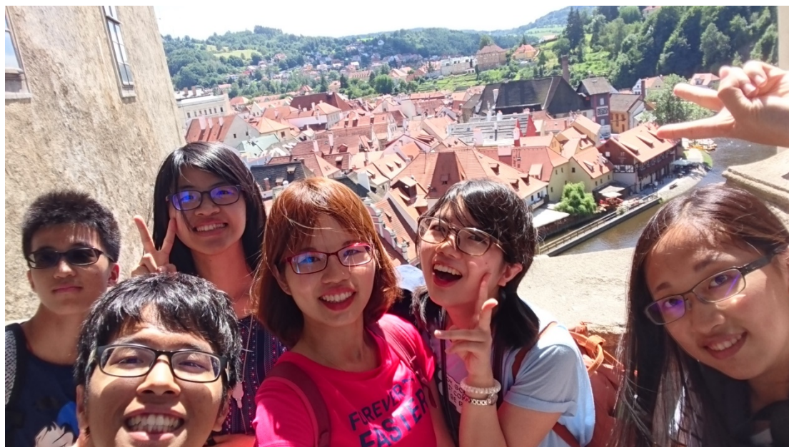
(照片說明：和政大同學於 Český Krumlov 的城景合照[中])

這次 21 天的捷克旅行，我認識了很多政大外系的同學，也結交了來自世界各地的朋友，並學會了簡單的捷克語，更是愛上了捷克這美麗又舒適的國家，期待在不遠的將來，我能夠再來捷克旅遊，或是試著申請獎學金，繼續重溫捷克語。