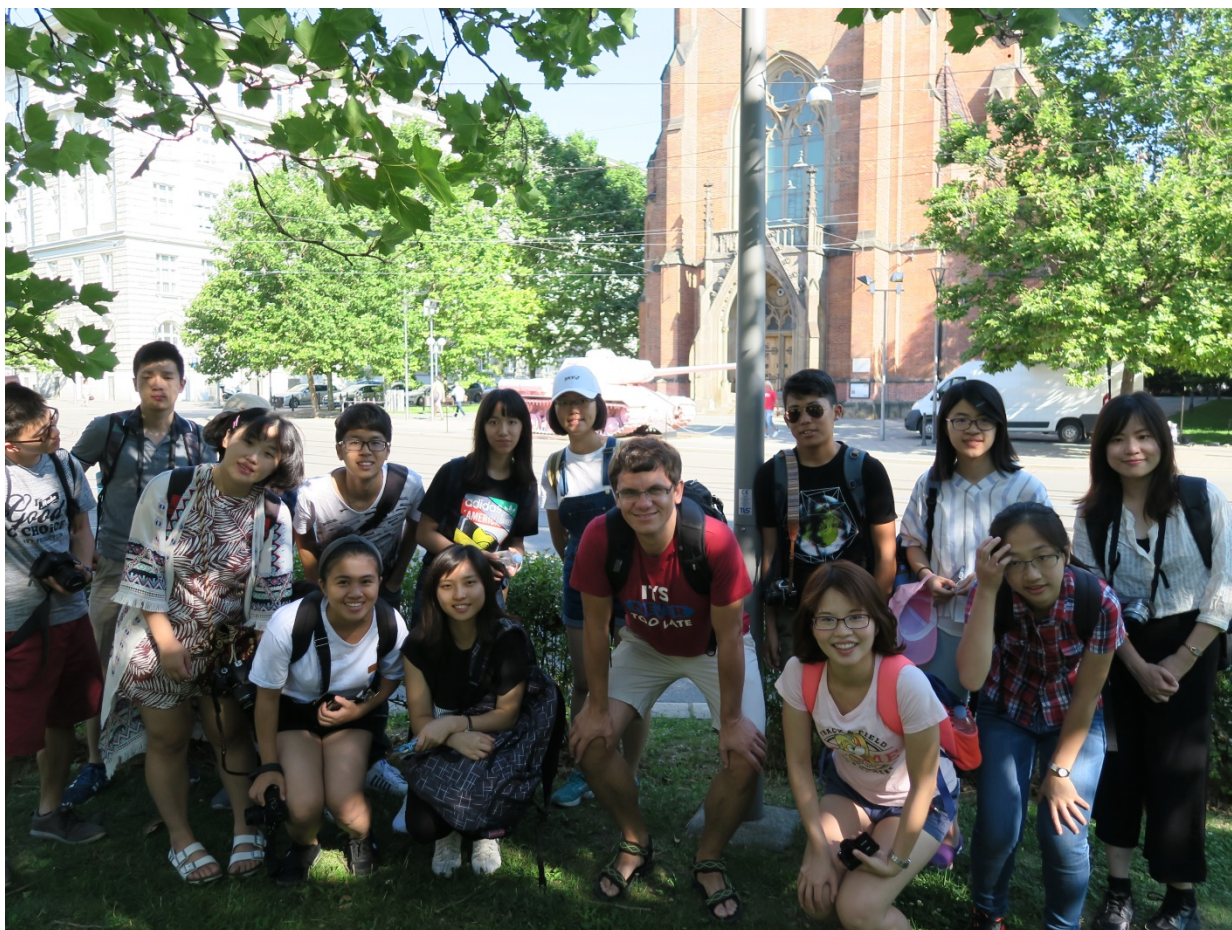
(照片說明：在布爾諾於紅教堂前合影[前排右二])

語言學校的老師也是相當親切，上課的方式不像我們以往教條式的教法，每個人都能參與到其中，並學會日常生活中會運用到的句子，也幫我們解決一些生活上的難題。當我們在電車上練習捷克文時，還遇到捷克人自己跟我們說他們也覺得捷克文很難，讓我覺得很有趣！此外還發現了捷克當地亞洲人偏少，我們到那兒反而變成了珍奇異獸，每天總有人會直直盯著我們看，也讓我們成為了一道風景。