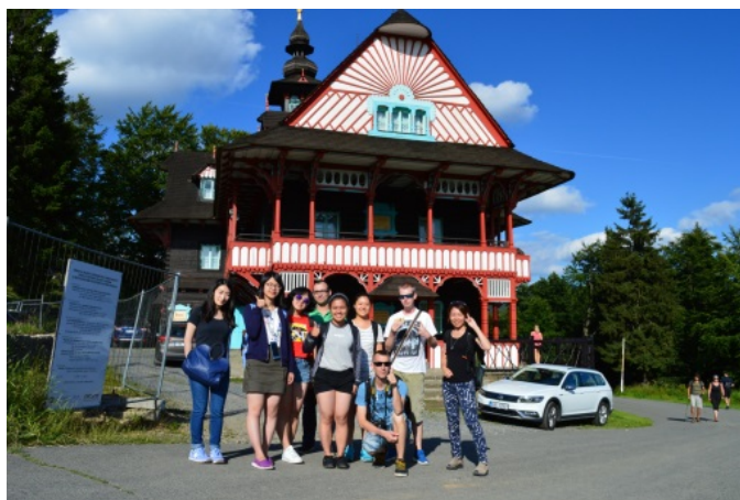
(照片說明：Rožnov pod Radhoštěm 合影)