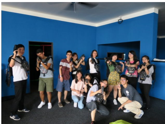
(照片說明：雷射槍遊戲前合影)