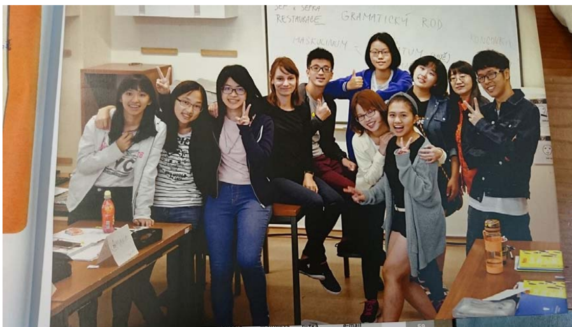
(照片說明：課程結束全班合影[左五])

這次的捷克之旅讓我了解到人生就像旅行，如果沒有踏出去根本不知道世界的美好，因為這世界上每個角落都有他美的存在，等待著我們去發現，不論是跟朋友或是跟家人，當我們發現這美好的同時，一定是感動萬分。捷克，只是一個開始，未來我一定會再去更多的地方旅行，發現世界的美好，因為我已愛上旅行。