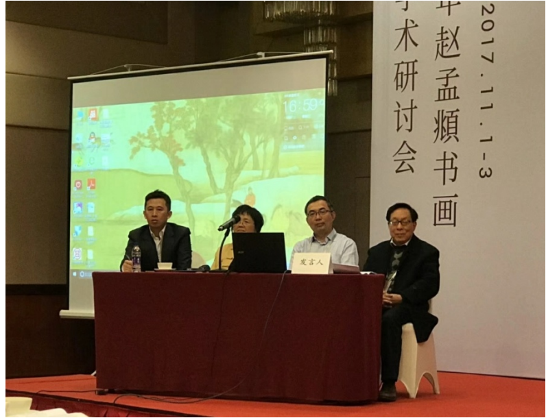
上圖：發表者接受提問