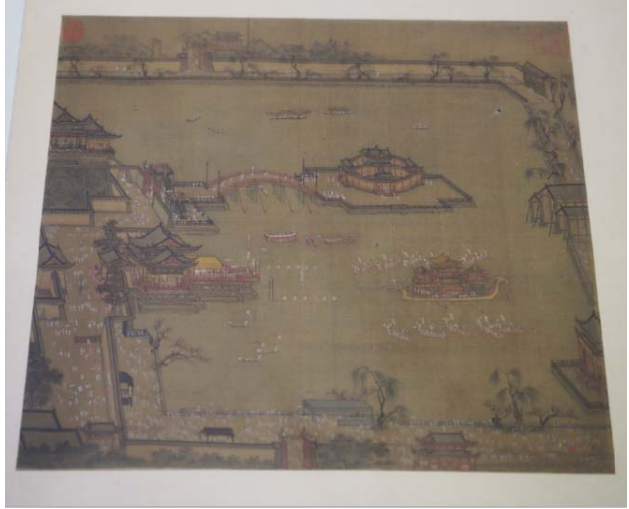
宋 張擇端 金明池爭標圖冊頁

此畫似為現存最早的龍池競渡圖，尺幅甚小卻以白粉描繪各式人物活動，可謂精能。可與本院所藏宋畫相參看，深化對於南宋宮廷繪畫風格取向及成就之了解。