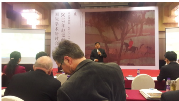
上圖：北京故宮博物院單霽翔院長致辭