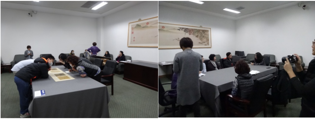
上方圖組：與遼寧省博物館人員晤談並提件參觀。