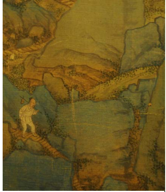
明 無款 玉陽洞天卷 局部

該作採文徵明青綠山水風格繪成，觀之有助於本院明年度「偽好物」特展之研究策展內容。