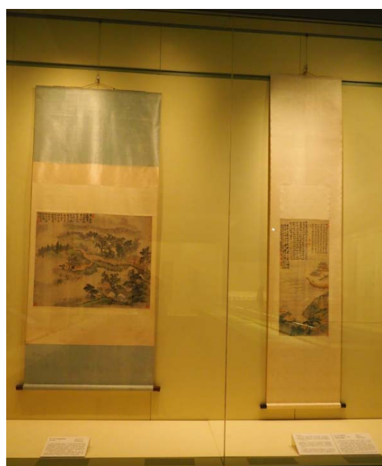
清 石濤 荷塘遊艇圖軸（左） 清 石濤 巢湖圖軸（右） 天津博物館所藏的石濤作品，呈現出石濤畫作靈活多樣的面貌。