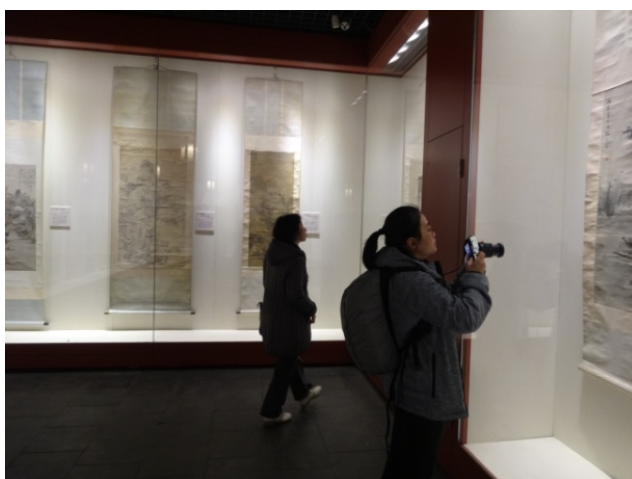
左圖：參觀瀋陽故宮明清書畫展。

此行除赴瀋陽故宮參觀該館書畫展覽，探訪與本院所藏來自北京紫禁城文淵閣四庫全書淵源甚深的文溯閣以外，並同時順帶參觀此處來源於滿族喜居台崗之上，「宮高殿低」俯瞰理政習慣，極富少數民族特色的各處宮殿布局。在保留了大量滿族元素，甚至布局仿照八旗行軍軍帳布局的瀋陽故宮，依舊看到大量脫胎自趙孟頫書風的館閣體牌匾榜書。可知趙孟頫純熟精美，雍容和諧的書風，影響力不僅止於當代，更為後人與其他民族所接受，遠及明清宮廷。