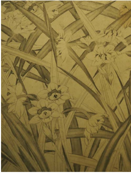
宋 趙孟堅 水仙圖卷