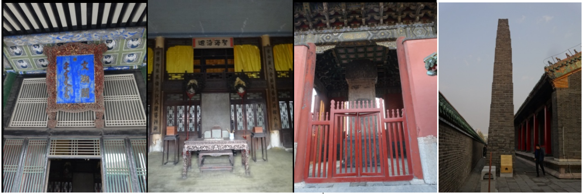
上方圖組：瀋陽故宮文淵閣、閣內陳設、碑亭，以及清寧宮建築群煙囪。