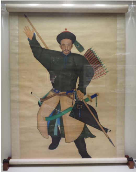
清 散秩大臣喀刺巴圖魯阿玉錫像軸 此畫像主即為院藏〈阿玉錫執矛蕩寇圖〉之主角，可與院藏文物連結，深化對繪製脈絡的理解。

天津博物館當期另有「動境：中華古代體育文物展」，以體育為題材，聯合十餘間友館，跨媒材呈現騎乘、武藝、投壺等古代體育類項，展品極為豐富多元。