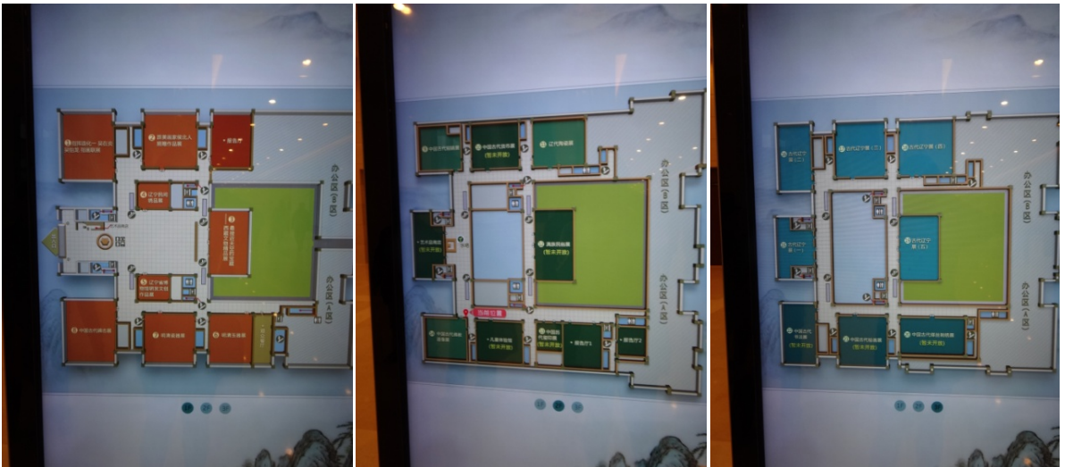
上方圖組：遼寧省博物館新館展區樓層平面圖。

本日上午參觀遼寧省博物館展廳。新館共計三層，由於尚在籌備階段，書法、繪畫以及織繡等諸多展廳皆尚未啟用，然新館幅員遼闊，明清玉器、瓷器、碑帖展覽與考古發掘等展覽都有相當大型而精彩的展件。