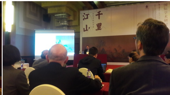
上左、右二圖：學者研究發表