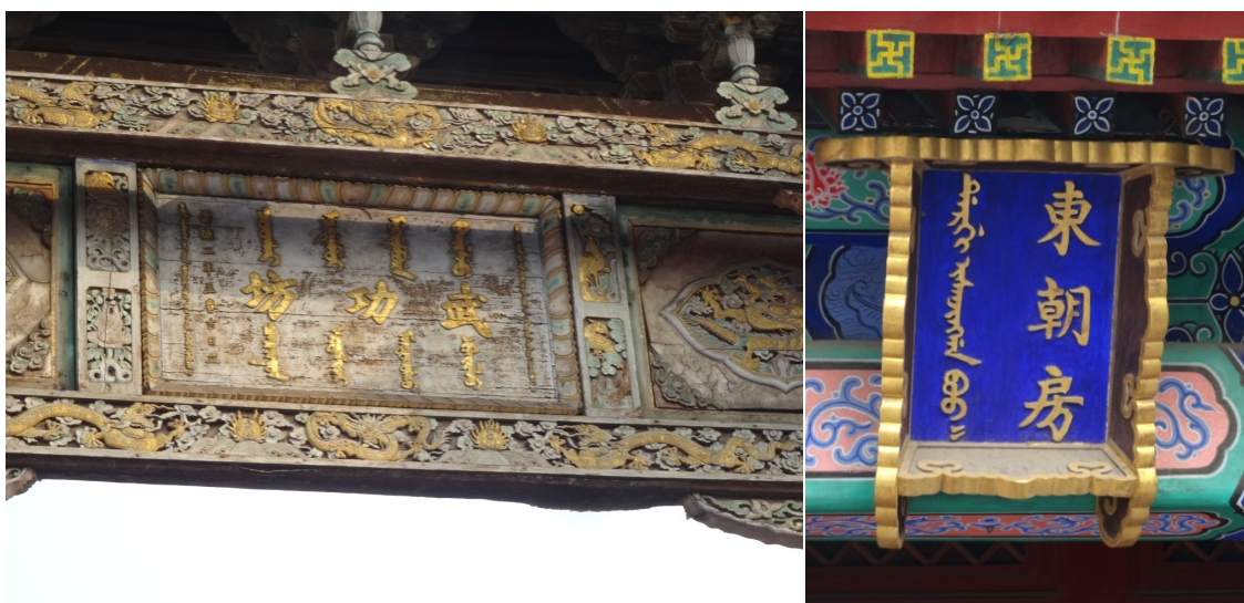
上方圖組：瀋陽故宮滿漢文牌匾，滿文為漢文意譯，與北京故宮音譯漢文發音不同。

下午參觀位於瀋陽市瀋河區明清舊城中心的瀋陽故宮，此為後金入關前的盛京皇宮，和清入關後盛京行宮，其建築群始建於1625年，至十八世紀乾隆時期又有較大規模的改建增修，占地約6萬平方米。2004年起，因獨特的滿、蒙、藏特色建築風格，列入世界遺產名錄。