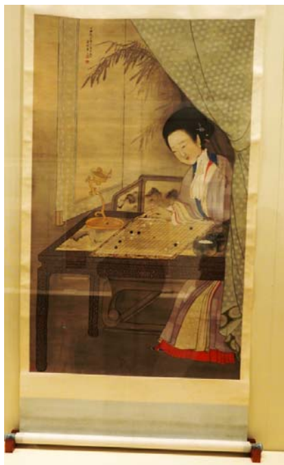
清 禹之鼎 閒敲棋子圖軸 仕女表情細膩，對各種畫中質材圖紋描繪不遺餘力，為仕女畫名作。此圖可與院藏仕女畫併觀比較。

此日參觀天津博物館「清前期特展」、「動境：中華古代體育文物展」、「館藏精品展」。天津博物館新館自2012年遷入新館後，一連舉辦數場聯合大陸重要博物館的特展。此次正逢該館「清前期特展」的尾聲。此特展除該館藏品外，也向北京故宮及上海博物館商借展品，因此內容豐富，展現清前期「山水」、「花鳥」、「人物」各門類繪畫的表現。