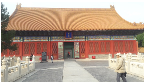
上圖：北京故宮博物院武英殿前風景