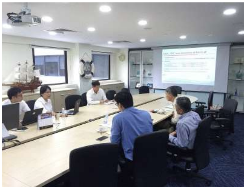
圖 1 與陽明海運公司聯盟辦公室代表會議