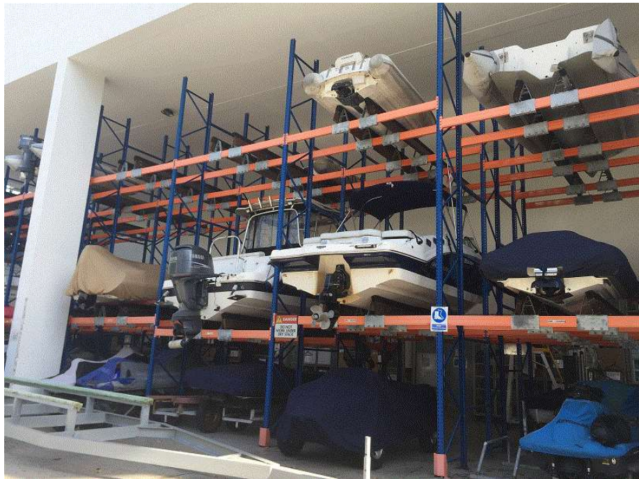
圖 11 陸上泊位(船架)