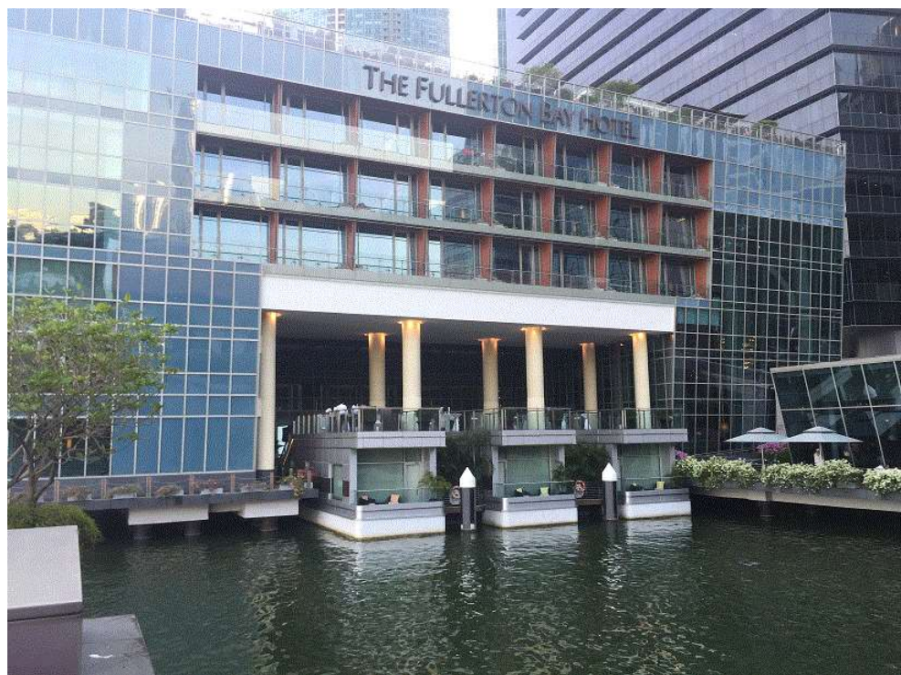
圖 6 富麗敦海灣酒店水上屋實景