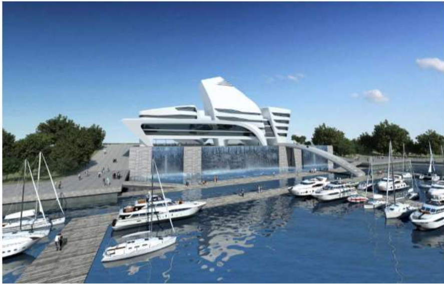
圖 13 ONE° 15 濱海俱樂部-公主港