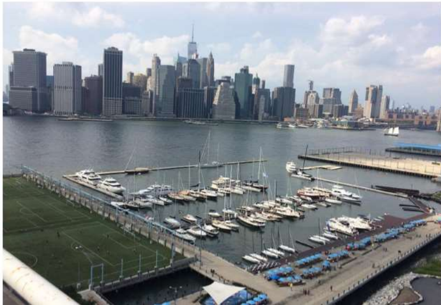
圖 12 ONE° 15 濱海俱樂部-布魯克林

設有 296 個泊位，泊位區域面積約 3 萬平方公尺，配備國際標準超級遊艇泊位，另外亦設置可容納 600 名學員的航海學校。該俱樂部正積極找尋適合的船隻作為水上休閒設施，如健身房、SPA，以及食宿用途。