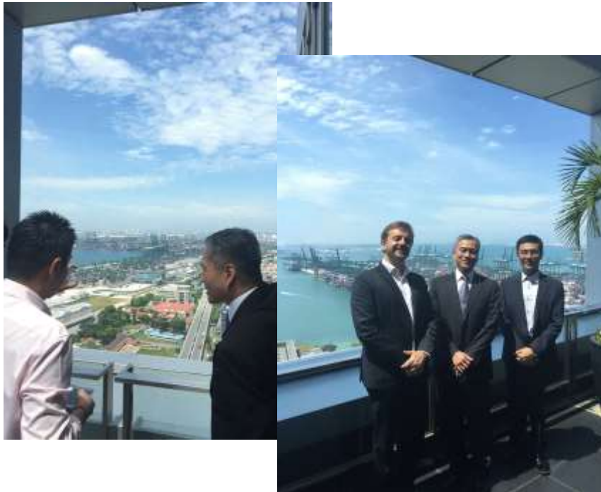
圖 4 PSA 導覽碼頭