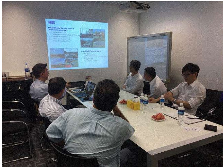
圖 8 拜會 MTC 公司