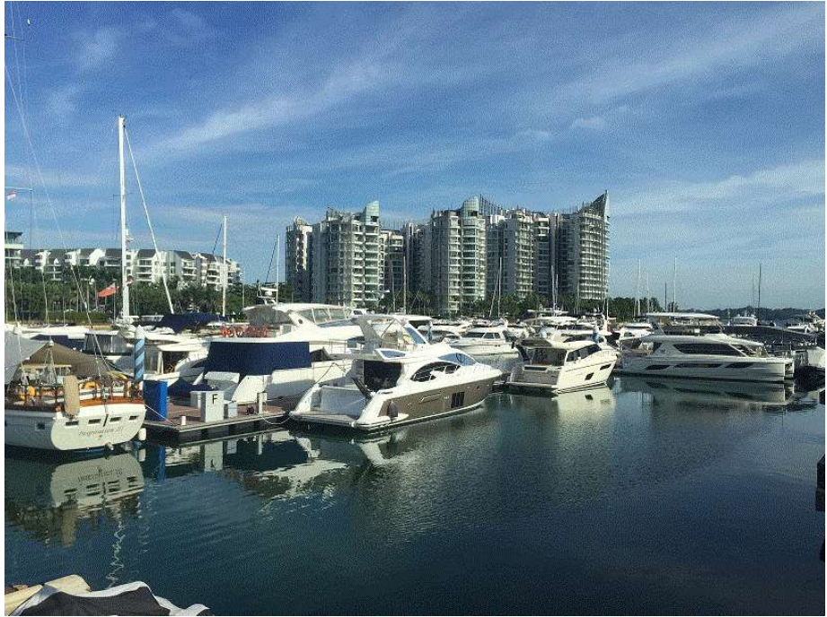
圖 10 水上泊位