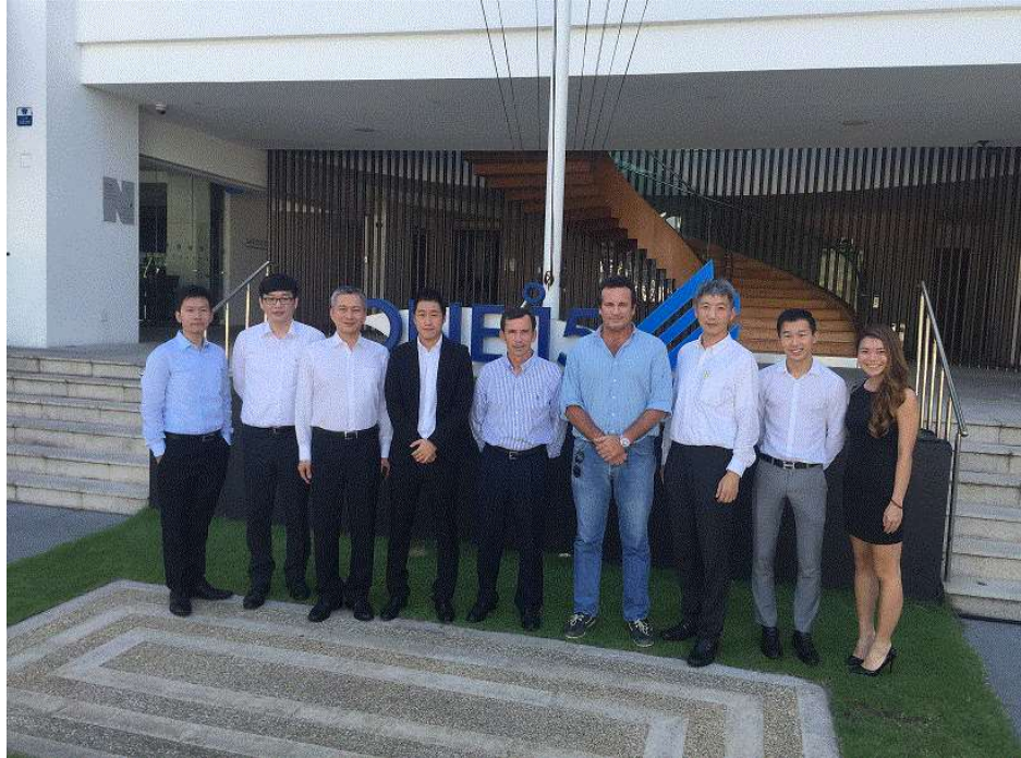
圖 17 與 SUTL、MTC 公司及 ONE° 15 合影留念