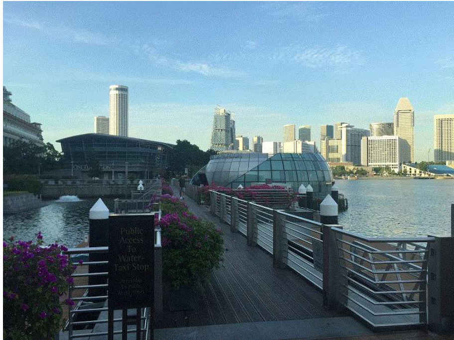
圖 7 富麗敦蓮亭水上餐廳實景