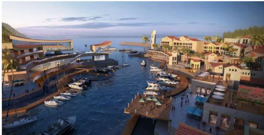
圖 14 ONE° 15 濱海俱樂部-桂山

ONE° 15 與當地企業合作，將負責管理當地規劃興建之遊艇俱樂部。該俱樂部擁有 156 個客房的酒店、高級度假別墅、餐飲、宴會及娛樂設施，預計於 2018 年對外開放。