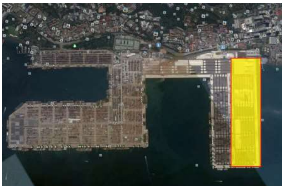
圖 3 Pasir Panjang Terminal Phases 3(黃色處)