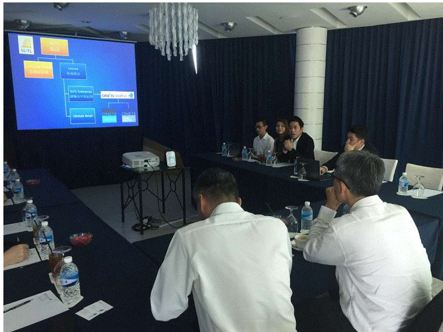
圖 16 本公司與 SUTL 公司及 ONE° 15 進行業務交流