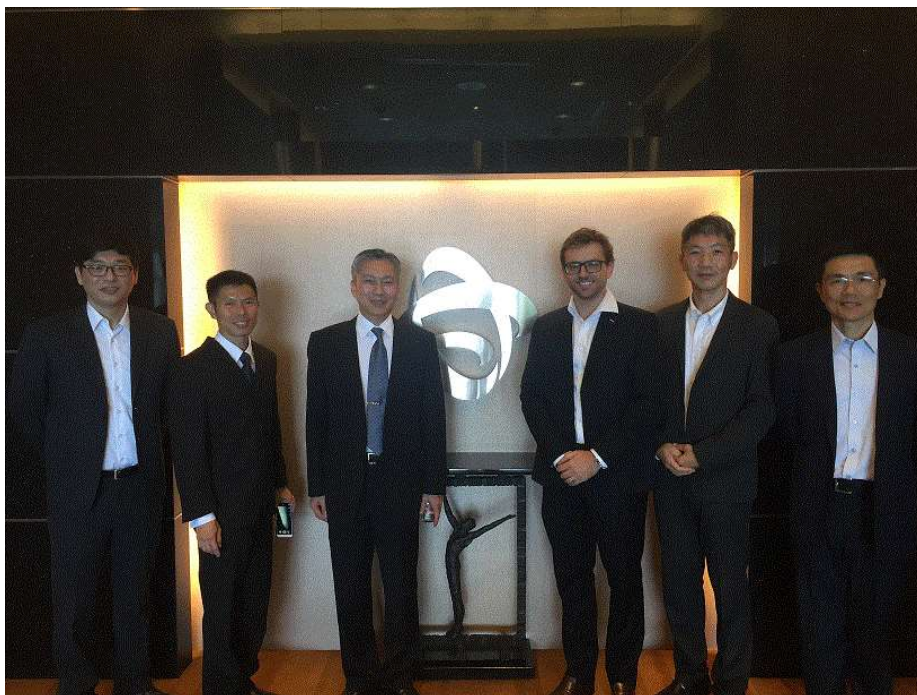
圖 5 參訪 PSA 辦公室