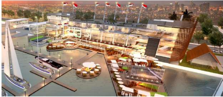
圖 15 ONE° 15 濱海俱樂部-雅加達