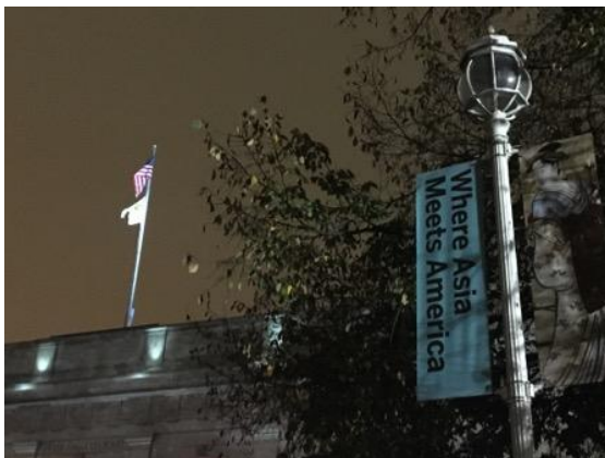
佛利爾美術館新定位：Where Asia Meets America