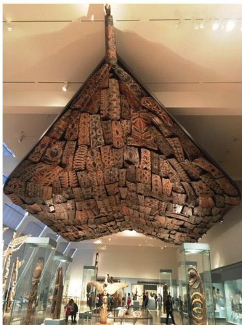
非洲及大洋洲藝術展廳一隅