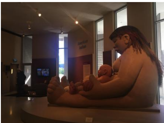
館方委託當代原住民藝術家於展廳就地創作之作品及創作過程展示