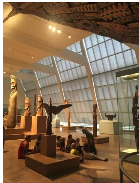
老師和學生在非洲及大洋洲藝術展廳