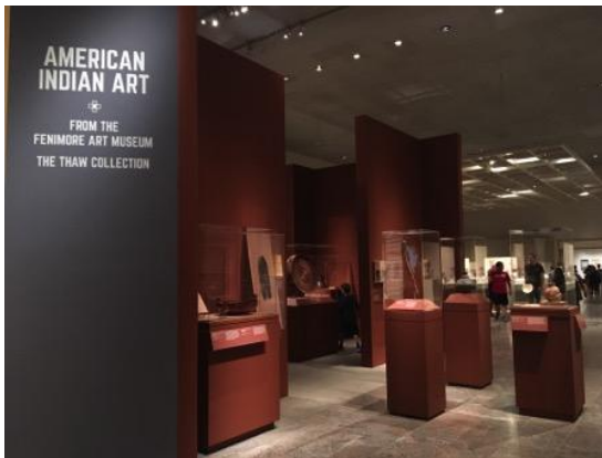
美洲原住民藝術特展

參觀當天是星期日，適逢展廳舉辦兒童教育活動。負責人員將所需器材悉數裝載於活動推車上，運至展廳，在展廳內就地舉辦活動。許多親子一同參與，孩童在展廳裡直接觀察展品，並依學習單上之提示當場記錄、創作。成品是一本內頁各部分可自由翻動組合的小書，頗受歡迎。