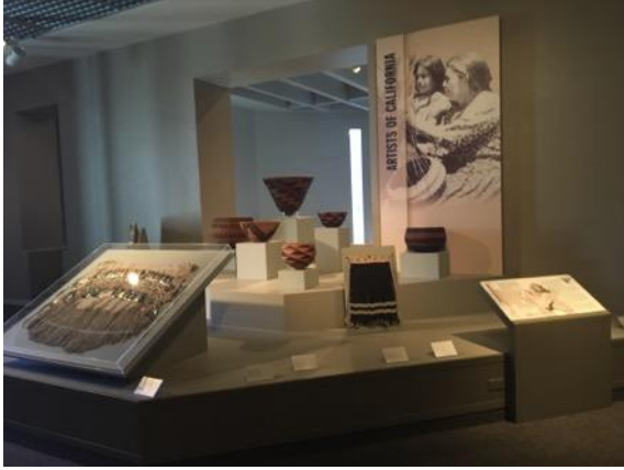
美洲原住民藝術展廳一隅