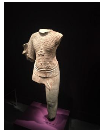
Encountering the Buddha: Art and Practice Across Asia 展覽場景