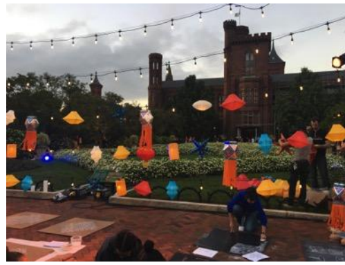
開幕活動：觀眾參與製做裝飾