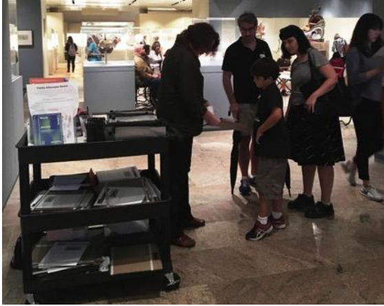
孩童前來索取活動學習單