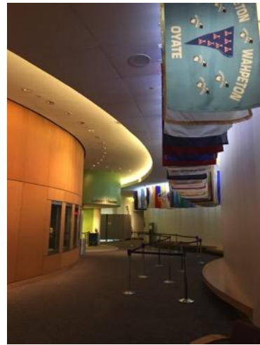
放映廳外懸有各部落旗幟