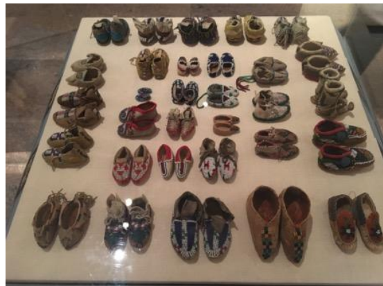
美洲原住民藝術常設展一景