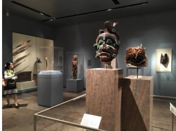
美洲原住民藝術常設展一景