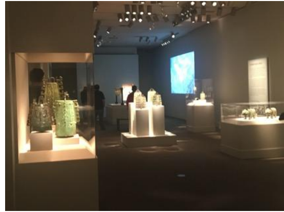
「Resound: Bells of Ancient China」展覽一隅