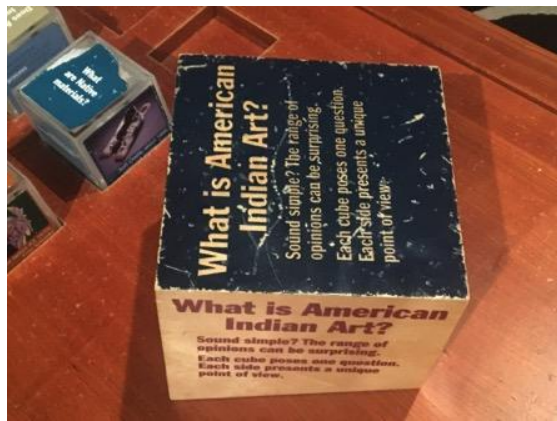
探討何謂原住民藝術