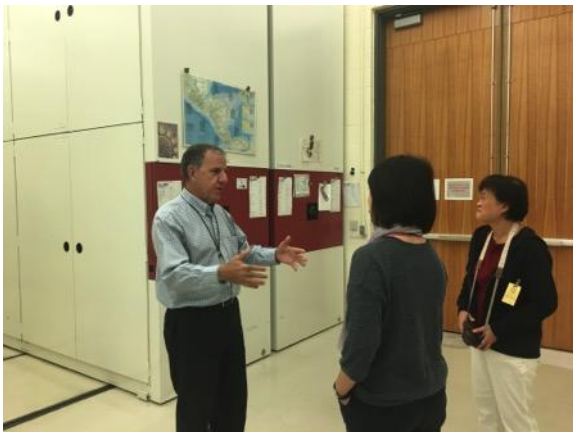
庫房依地理區域劃分