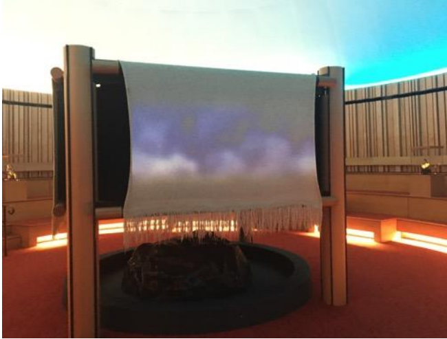
多媒體廳以原住民織品作為放映影片之屏幕