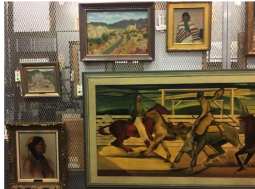
於庫房查看可能借展之作品