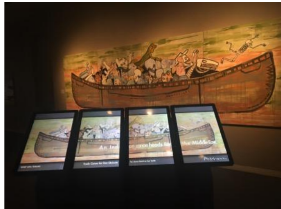
當代美洲原住民藝術創作及多媒體互動裝置