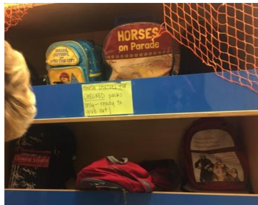
各式主題之活動小背包，供兒童自由取用