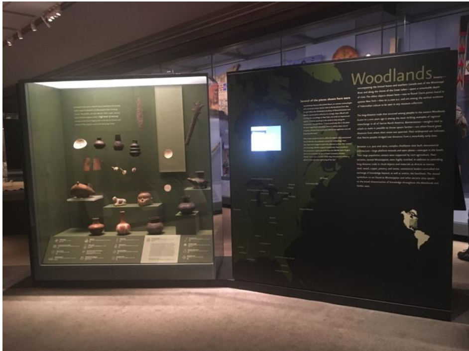
Infinity of Nations 展覽依區域畫分單元，此為 Woodlands 單元之說明板及展櫃