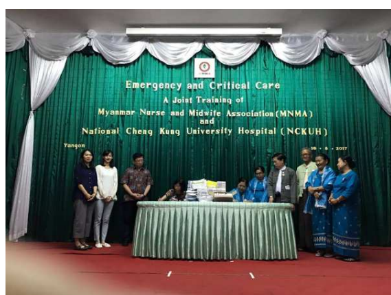
▲雙方代表簽訂合作備忘錄