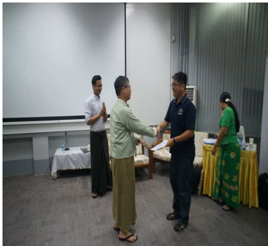
▲頒發感謝函予三名臺灣講師