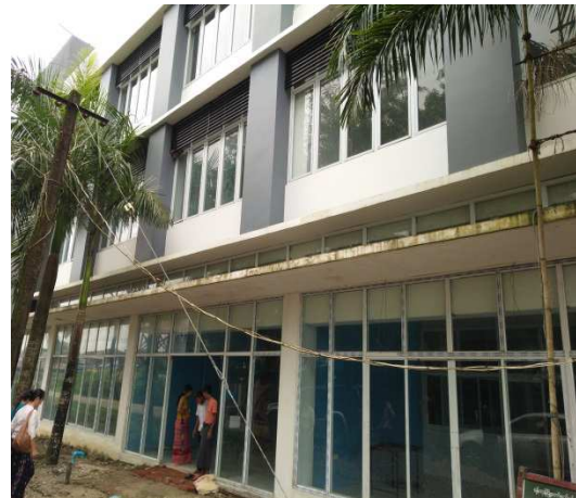
▲醫院外觀，共計三層樓