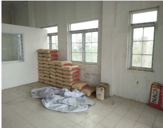
▲一樓為門診及各項檢查室