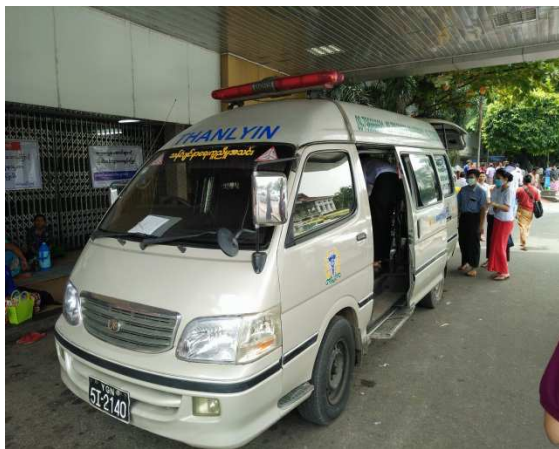
▲急診入口之民間救護車

目前，病患由救護車送達方式，仍分有民間救護車，以及政府機關之救護車。另外，相較於去年來訪時，該院急診無護理人員，所有醫療作業皆由醫師完成；但，今年已有護理人力進駐，專責執行急診護理工作。