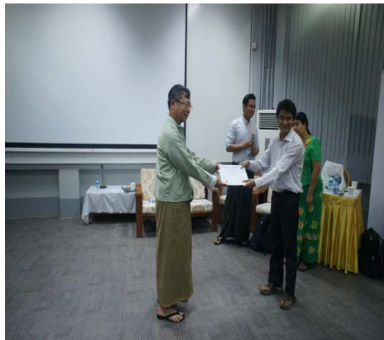
▲頒發受訓證書與參訓之醫師

(四) 與 University of Medicine (1), Yangon (仰光第一醫學大學)簽訂 Minutes of Discussion(會議記錄)