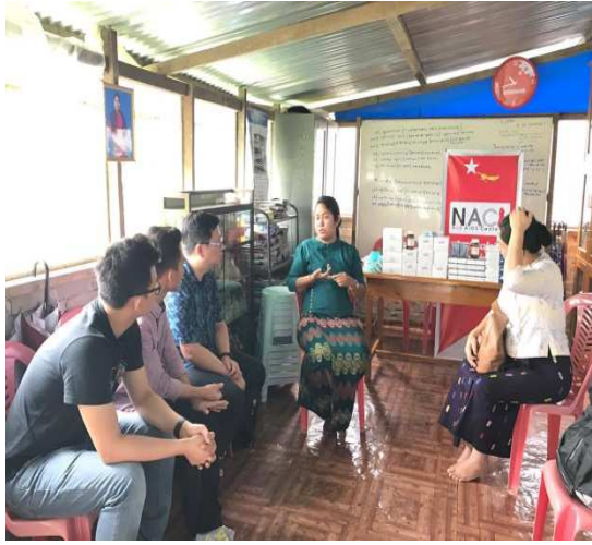
▲雙方討論明年合作計畫

意願，以及擔心旁人異樣眼光，因此，將規畫合併簡單健康檢查，如：血壓、血糖等檢驗項目，以消彌孕婦之受檢疑慮。