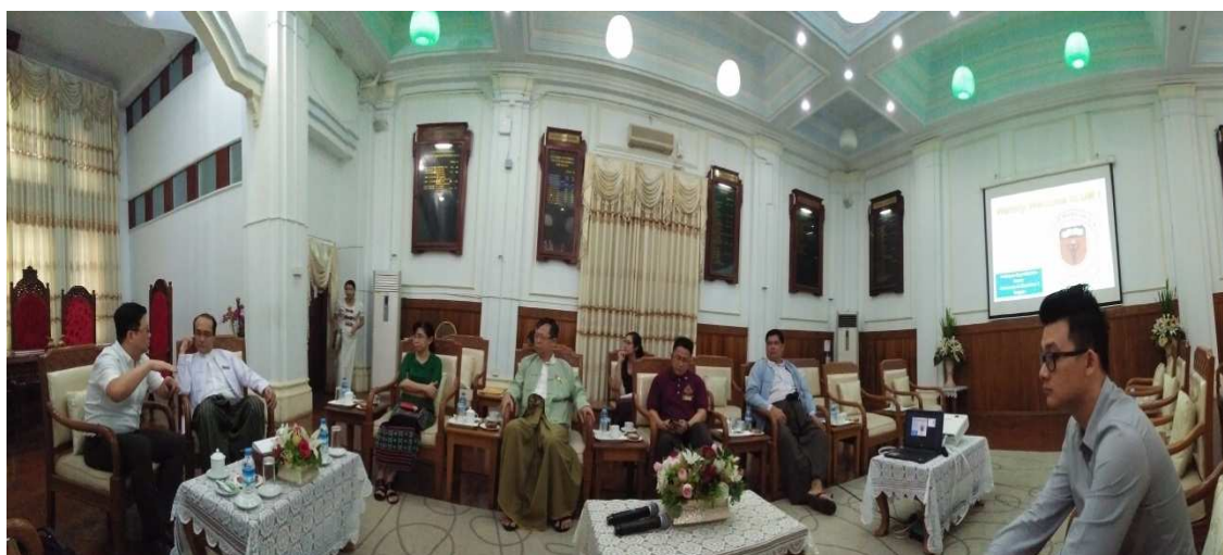
▲University of Medicine (1),Yangon (仰光第一醫學大學)校長(左二)、副校長(左三)、主任(右四)等