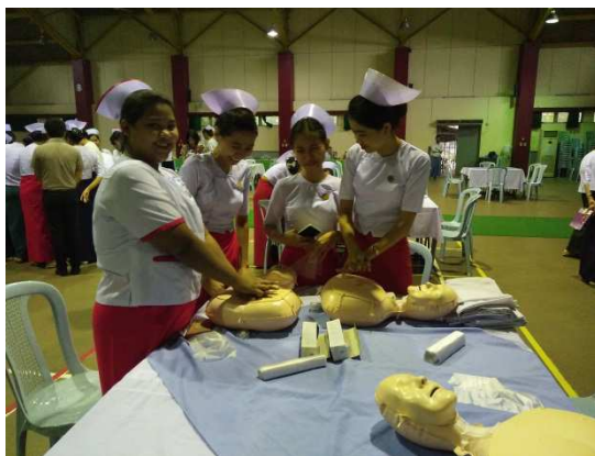
▲學員操作 Basic Life Support (BLS，基本救命術)