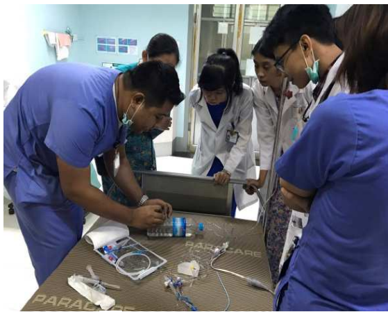
▲Parami General Hospital(派樂米醫院)醫師實際操作練習情形