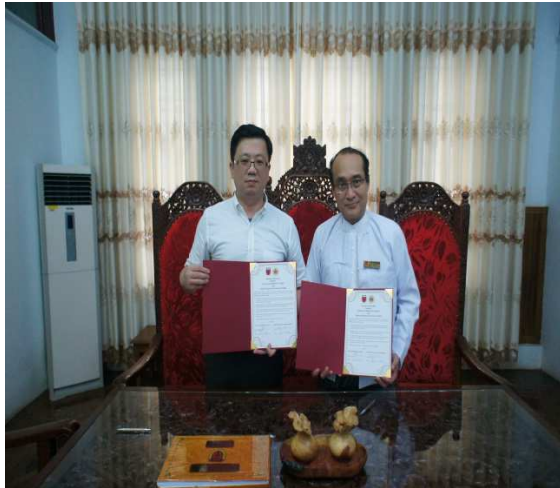
▲簽訂 Minutes of Discussion(會議記錄)