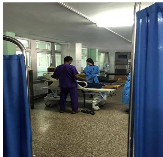
▲疑似 H1N1 病患之隔離區