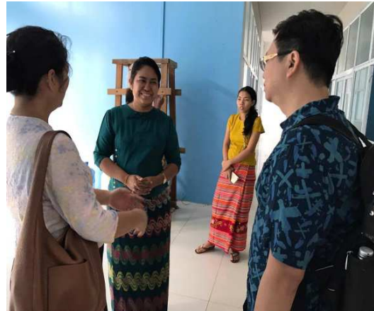
▲議員 Phyu Phyu Thin(漂漂錠)解說