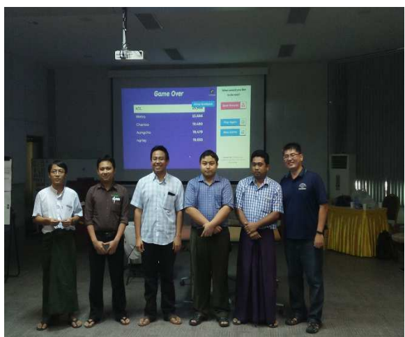
▲以 IRS (即時反饋系統)進行課後評值測驗，並頒發獎品予前五名學員