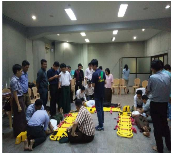
▲創傷病患處置流程、保護頭頸部技能