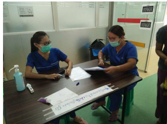
▲急診入口前發燒篩檢站

目前，病患由救護車送達方式，仍分有民間救護車，以及政府機關之救護車。另外，相較於去年來訪時，該院急診無護理人員，所有醫療作業皆由醫師完成；但，今年已有護理人力進駐，專責執行急診護理工作。