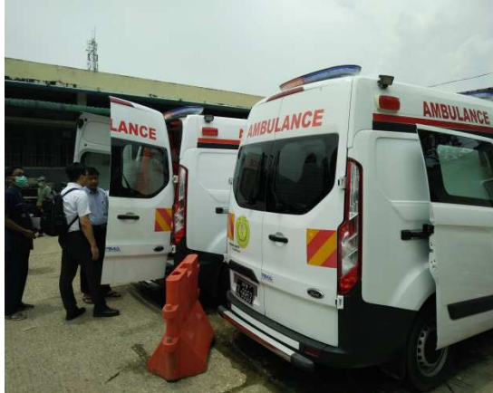
▲仰光公立醫院配置有兩輛救護車

此，各項醫療備不論是在保養方面，或是耗材添購上，對其而言價格皆十分昂貴，且當地也不容易尋得可以提供維修保養的廠商，甚至廠商可能也無法提供維修保養技術。面臨這種問題，將造成儀器損壞無法使用，以及衛材及耗材有短缺問題。