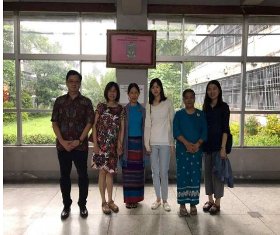
▲與仰光護理大學校長合影