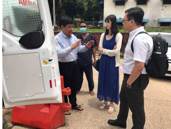
▲急診主任解說目前救護車使用現況