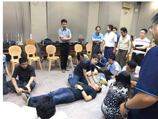
▲實際模擬示範情況