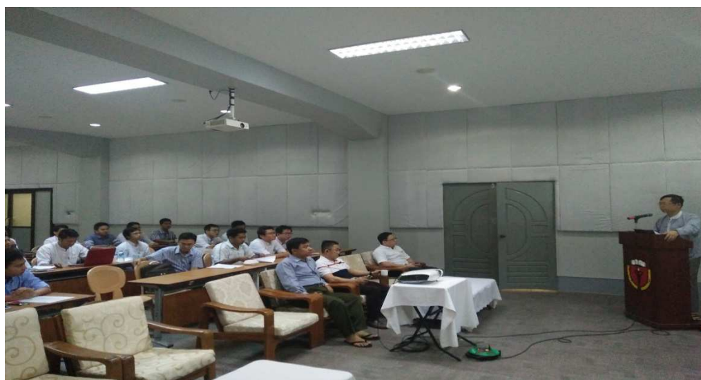
▲University of Medicine (1), Yangon(仰光第一醫學大學)骨科主任致詞