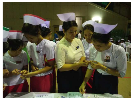
▲學員操作 HIV Rapid Test (愛滋病快速篩檢)