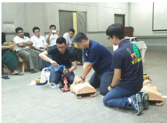
▲實際模擬示範情況