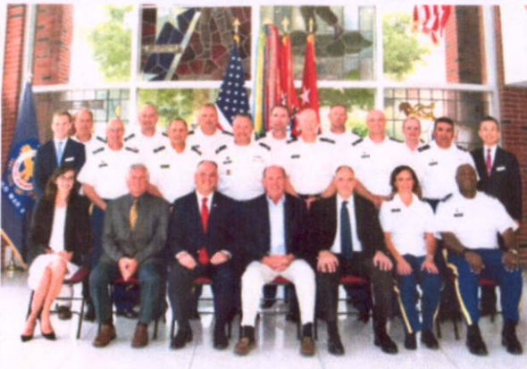
第 10 教授班學官合影