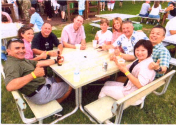
班級學官於校內茶敘

美國陸軍戰爭學院除嚴謹課程外，亦安排輕鬆的社交以及親子活動，藉由親子間互動、國際禮儀培養以及輕鬆的美國文化(Beer pub)等社交互動，強化雙向溝通、增加彼此瞭解，進一步培養同儕情感凝聚向心共識。