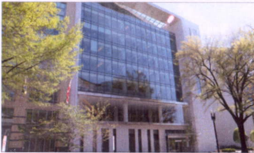
著名智庫-戰略與國際研究中心(CSIS)