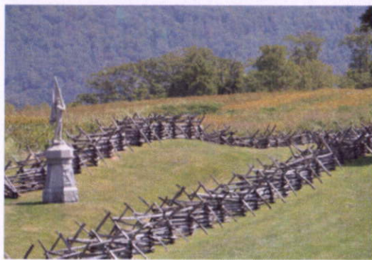
安提耶坦古戰場 (Battle of Antietam)