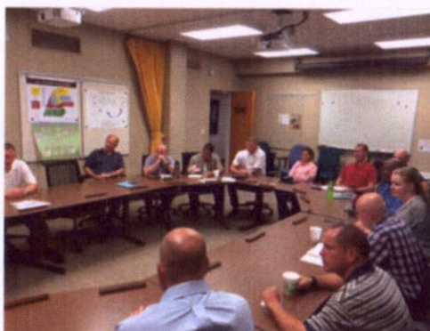
第 10 教授班(Seminar 10)2 階段校訓 2

美國陸軍戰爭學院遠距教學課程在第 1 學年時，依課程內容採取隨機混合編組(Mix)，在第 1 次校訓課程(First Residence Course)時即開始固定編組分設教授班，以 2017 年班為例，編組 19 個教授班，每班平均約 20 人，為達班級成員多元化成效，班級學官均儘量在性別、軍種、兵科、政府機關及外國學官等安排上採取一定比例式編組。另外每日授課均著軍裝、西裝或套裝，在美國軍方的彈性文化下，每周有三天可以著輕便的衣服(polo 衫及西裝褲，女性比照同標準)上課，藉脫下具有階級象徵的軍裝，使所有學官排除階級高低或是軍文職的藩籬，在學術殿堂得以輕鬆、無壓力及負擔，且在學術上保有平等地位的角度進行研討。