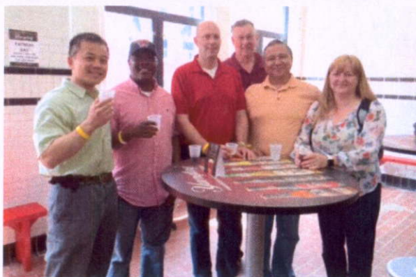
學校安排外籍學官參觀博物館