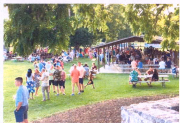
學校安排戶外野餐