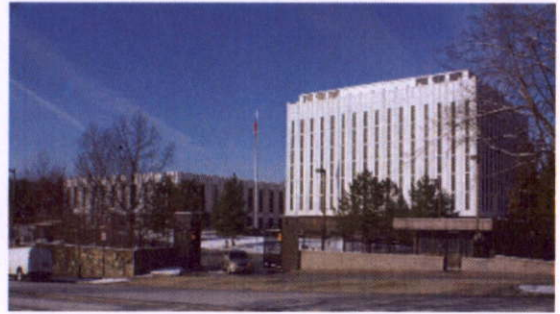
俄國駐美國大使館