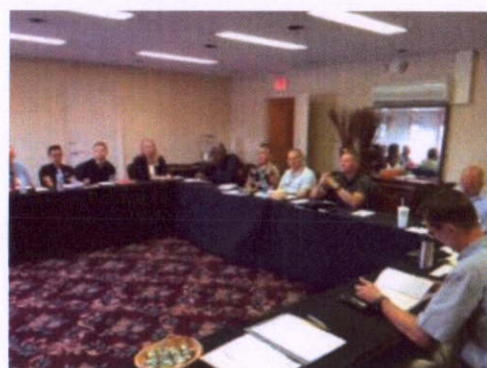
第 10 教授班校外教學後研討