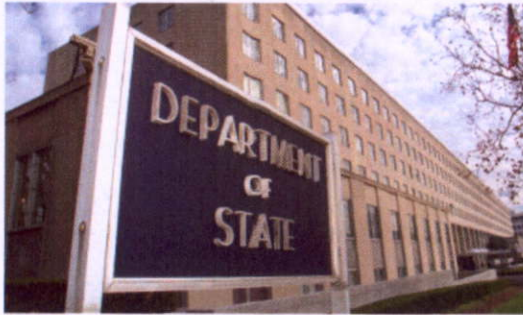
參訪美聯邦政府機關組織