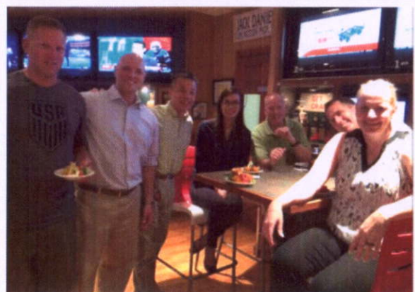
體驗美國文化 Pub 餐敘