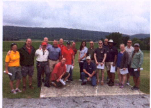
安提耶坦戰場合影