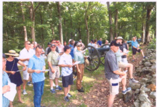
蓋茲堡古戰場授課