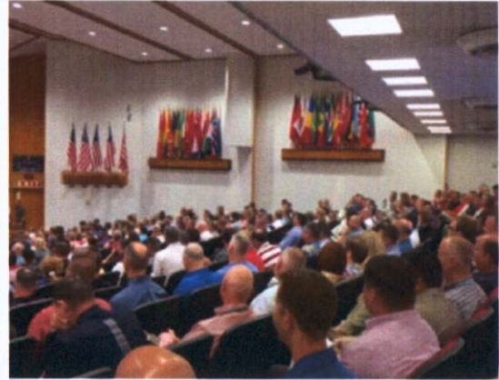
講者與學官問答互動