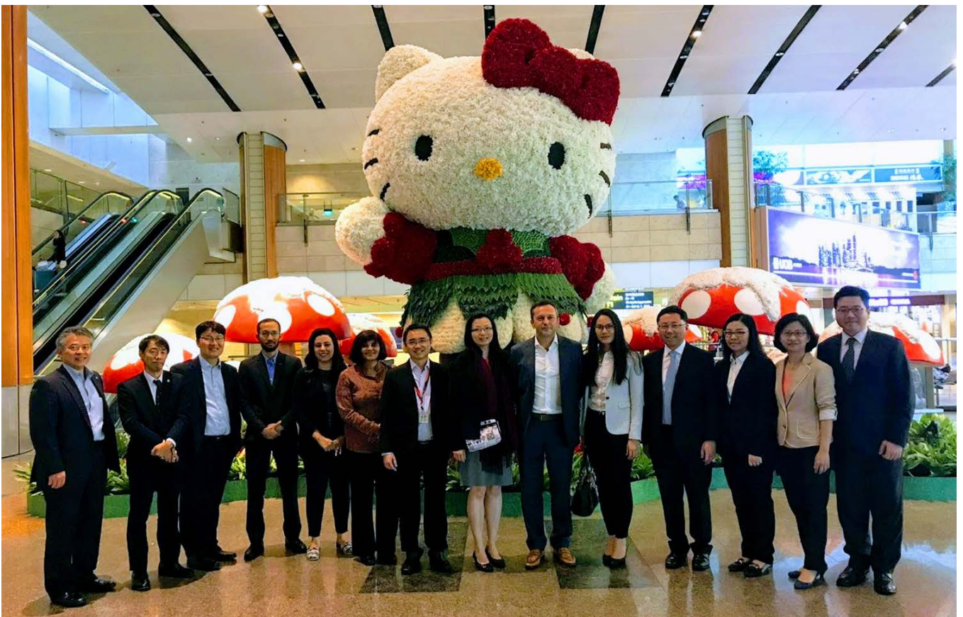
圖:ACI 亞太區第 6 次經濟委員會成員合照