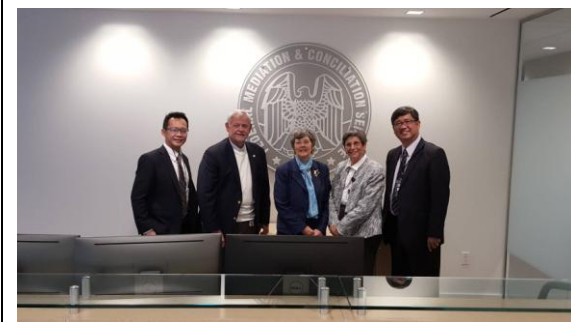
拜會美國聯邦調解調停署(FMCS)