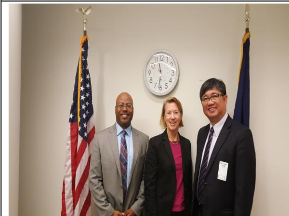
拜會美國公平就業機會委員會(EEOC)