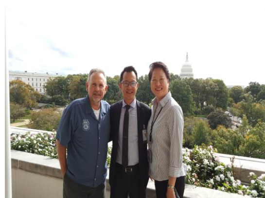
與國際駕駛員工會(IBT)幹部合影