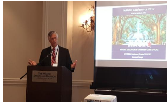
喬治亞州薩凡納市市長 Eddie DeLoach 致歡迎詞