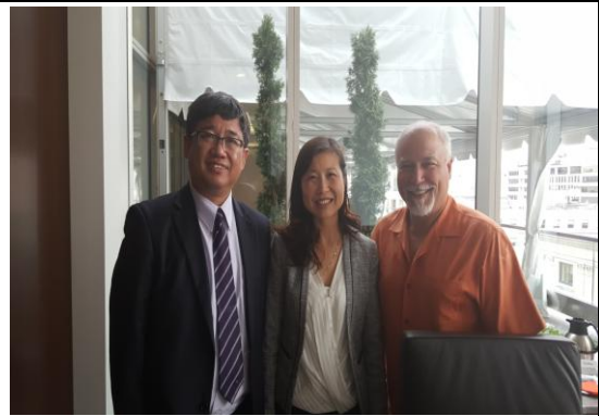
拜會北美國際工會聯盟 (LIUNA)