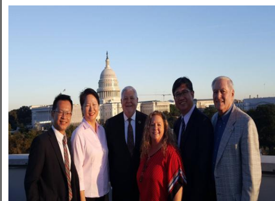
與美國工會領袖合影