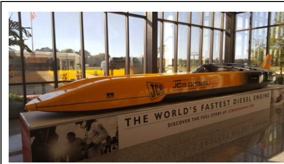
參訪 JCB 公司