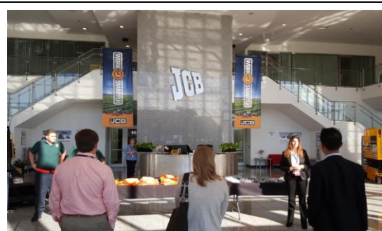
參訪 JCB 公司