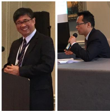
王司長就「我國當前勞動市場趨勢之挑 戰與因應」做專題報告