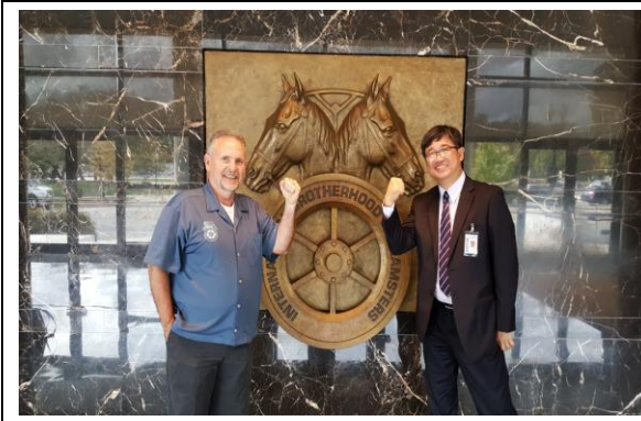
拜會國際駕駛員工會 (IBT)