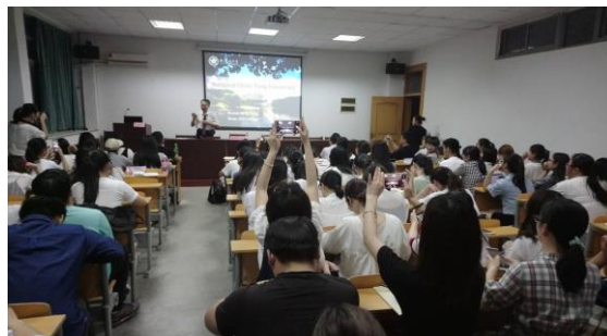
拜訪安徽師範學院新聞傳播學院

5/19日（周五）一行人搭車繼續前往巢湖學院，下午期間參訪校園，由巢湖學院副校長接待，隨後三個人分別拜訪新聞傳播學院、計算機學院、與設計學院進行交流。