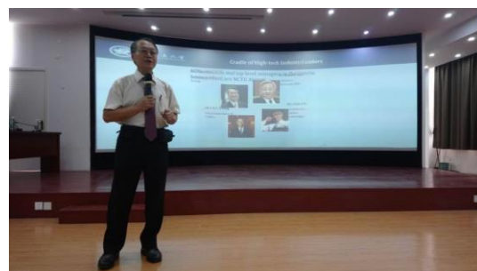
拜訪巢湖學院新聞傳播學院、計算機學院、與設計學院