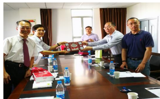
參訪蘇州大學傳媒學院、計算機學院