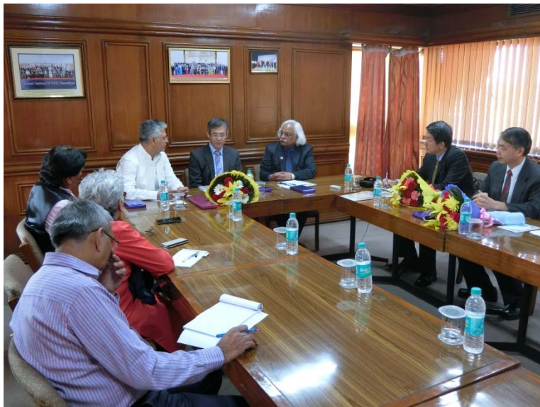
姚政務次長及畢司長在印度大學協會（Association of Indian University, AIU）會談情形