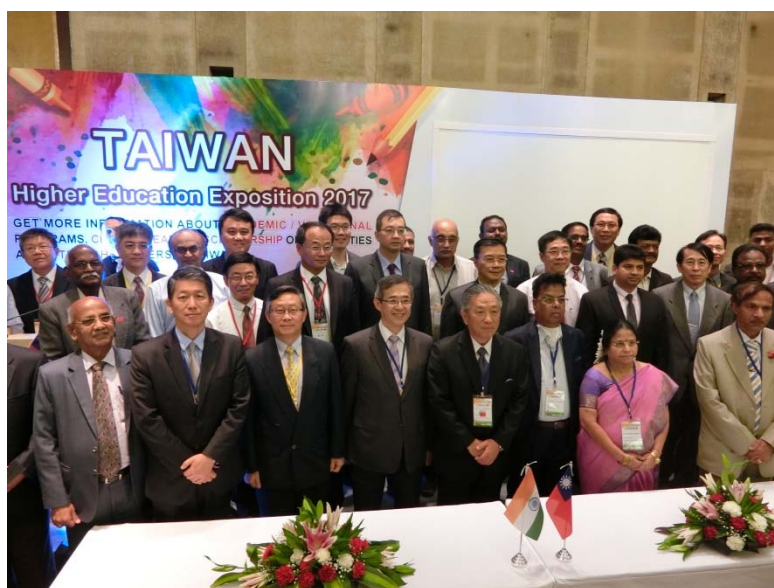
姚政務次長率領教育展訪團出席 2017 年印度臺灣高等教育展開幕儀式

姚政務次長隨後出席「2017 年印度臺灣高等教育展」開幕式，並對國內大學、印度大學代表師生及媒體發表演說，說明我國優質高等教育及技職教育產學合作現況，獲得與會人士熱烈響應，姚政務次長並見證臺印雙方大學簽訂教育合作備忘錄，共計有 9 所國內大學與 6 所印度大學簽訂 21 件教育合作備忘錄。