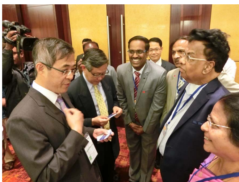
姚政務次長與出席 2017 年印度臺灣高等教育展開幕儀式之印度訪賓互動交流