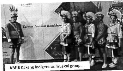
AMIS Kakeng Indigenous musical group.