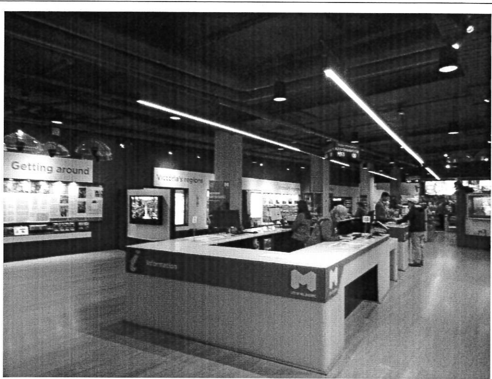
墨爾本車站前旅客服務中心內豐富旅遊資訊及解說服務