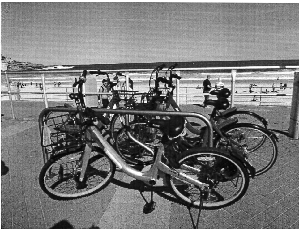
雪梨海灘共享單車