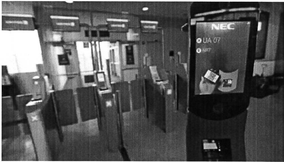
澳洲臉部辨識自動通關