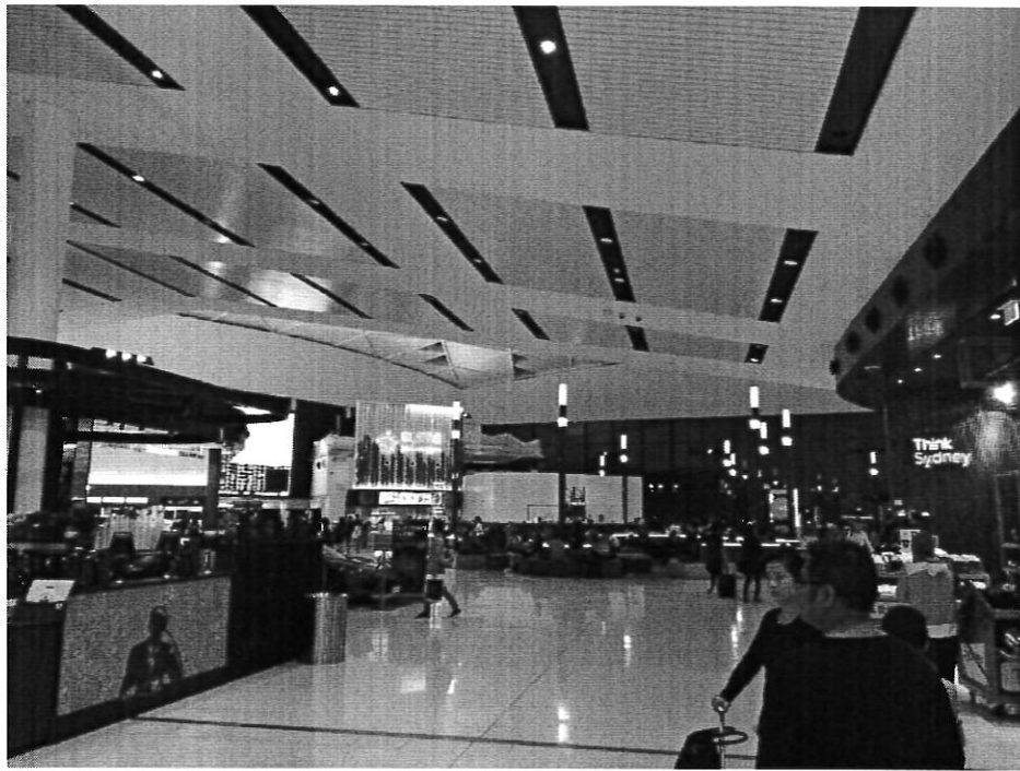
雪梨機場寬敞空間