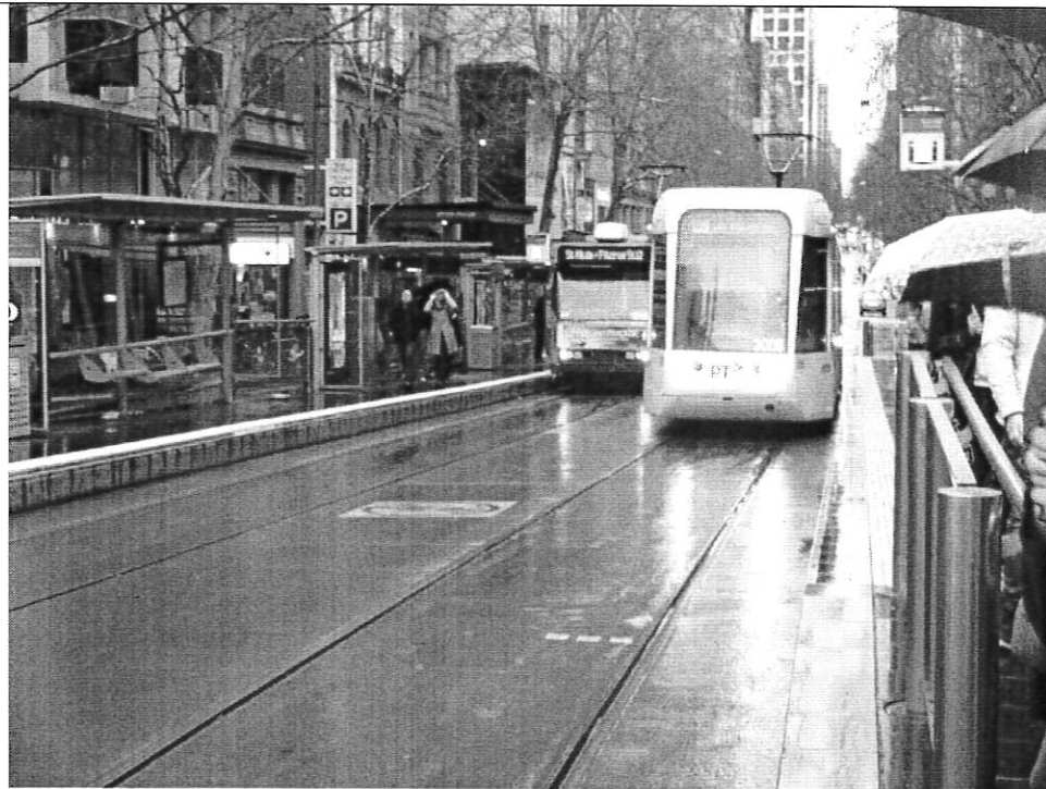
墨爾本不同形式有軌電車車型代表它的發展沿革