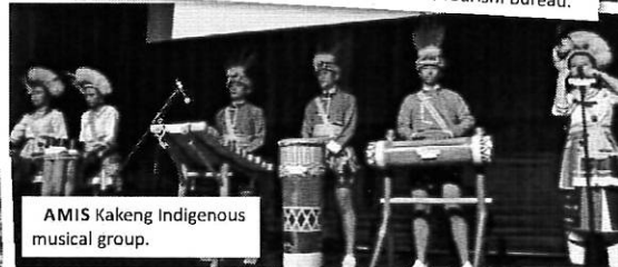
AMIS Kakeng Indigenous musical group.