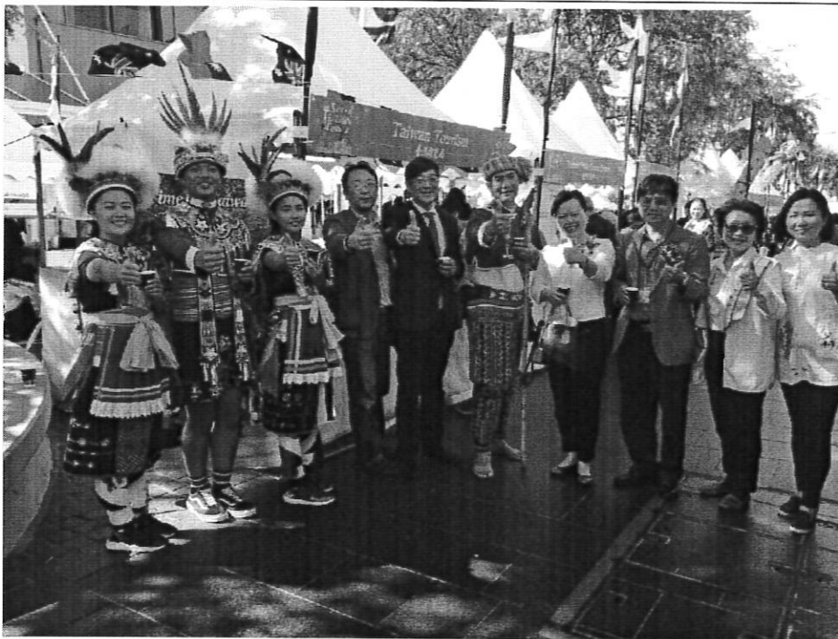
嘉年華活動本局攤位