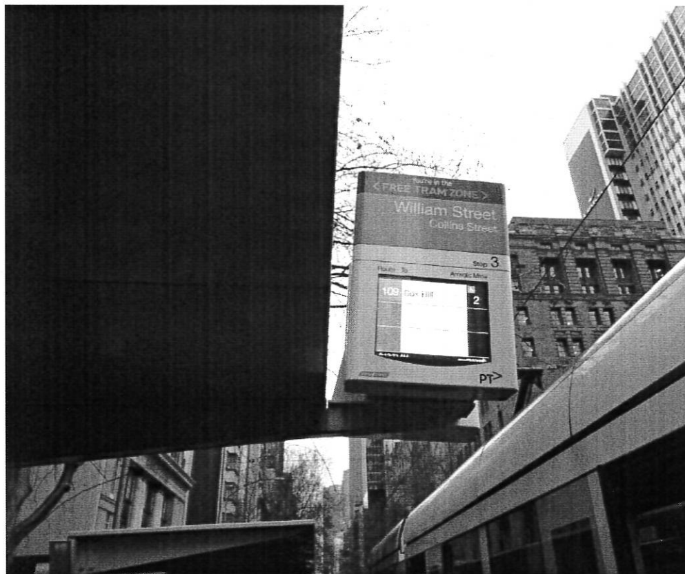
有歷史的電車有科技的服務