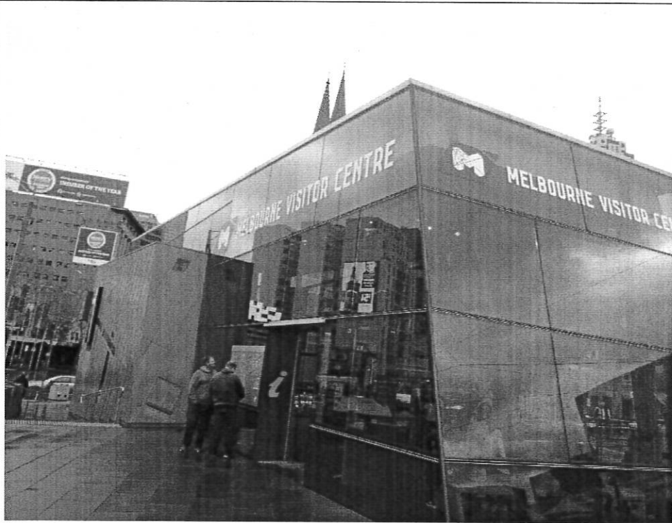
墨爾本車站前旅客服務中心