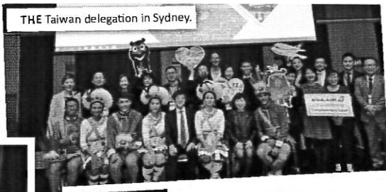
THE Taiwan delegation in Sydney.