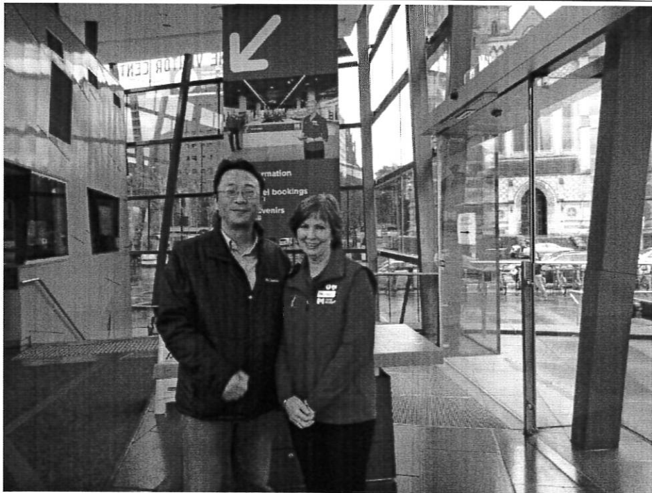
旅客服務中心親切解說志工