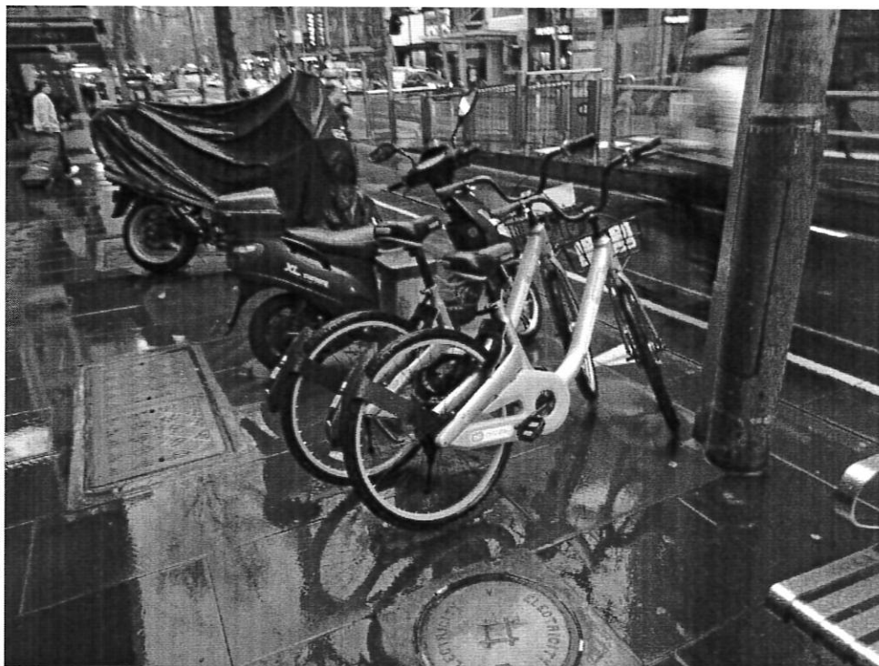
墨爾本街頭共享單車