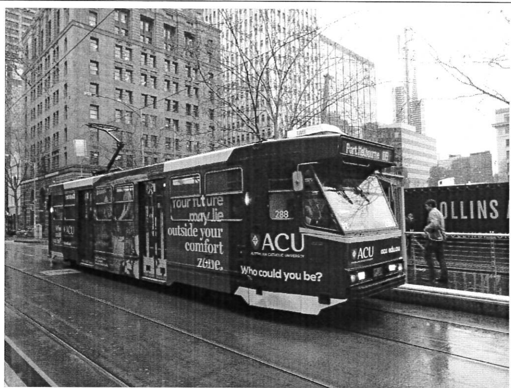
墨爾本方便有軌電車大眾運輸服務