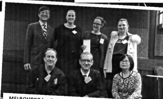
MELBOURNE famil winners with Trust Lin director and Pearl Lee marketing representative Australia & NZ, Taiwan Tourism Bureau.

During the evening attendees were given the opportunity to enjoy delicious Taiwanese eats such as sun cakes, pineapple pastries, mung bean cakes and nougats, leaving them with unforgettable impressions of the allure of Taiwanese cuisine.