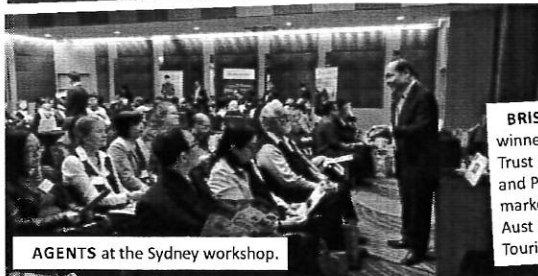
AGENTS at the Sydney workshop.