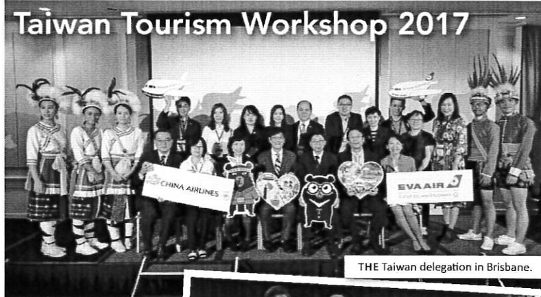
THE Taiwan delegation in Brisbane.