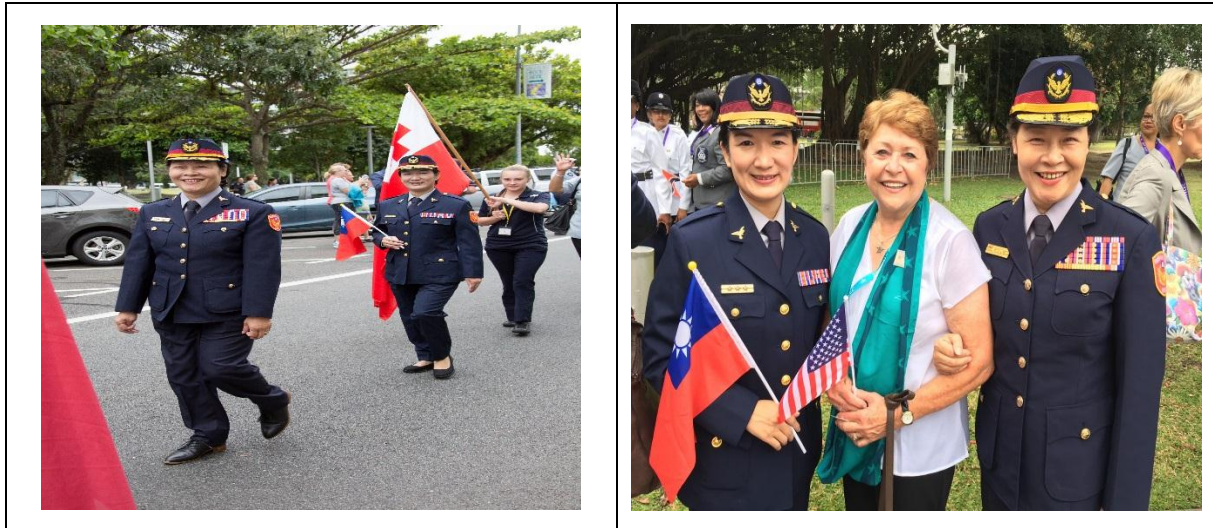
圖 4 「2017 國際女性與執法年會」各國制服遊行活動照片