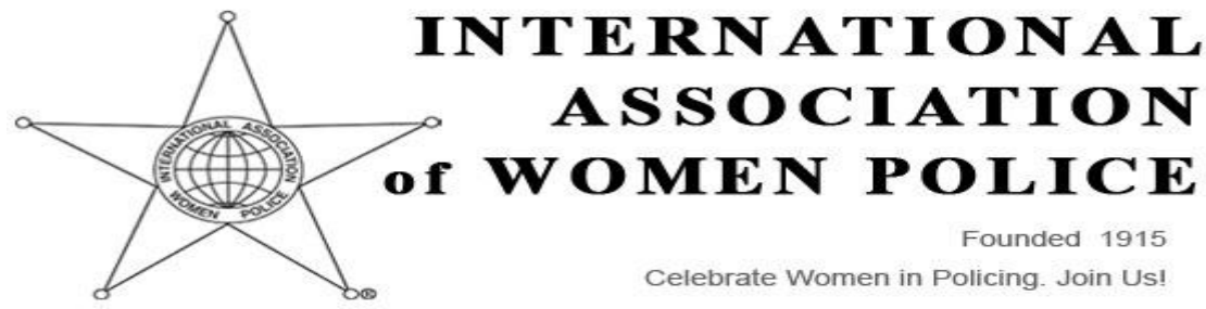
圖 1 國際女警協會標誌

IAWP 係於西元 1915 年由美國女警所創立，其目的在於提升女性執法人員專業發展、經驗交流、網絡建立及肯定認同的機會。經過 100 多年的發展，該協會現今仍然持續推動許多強化、團結及提升女性執法人員形象的訓練方案及服務。IAWP 是一個相當多元且不斷成長的全球性組織，該協會認為警察應該反映其所服務社區的多元性及保障人權，其成立使命在於強化及提升女性從事國際警政工作的能力，目前會員遍及全球 70 多個國家。