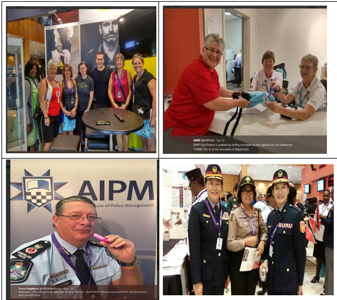
圖 7 2017 澳洲國際女性與執法年會活動照片