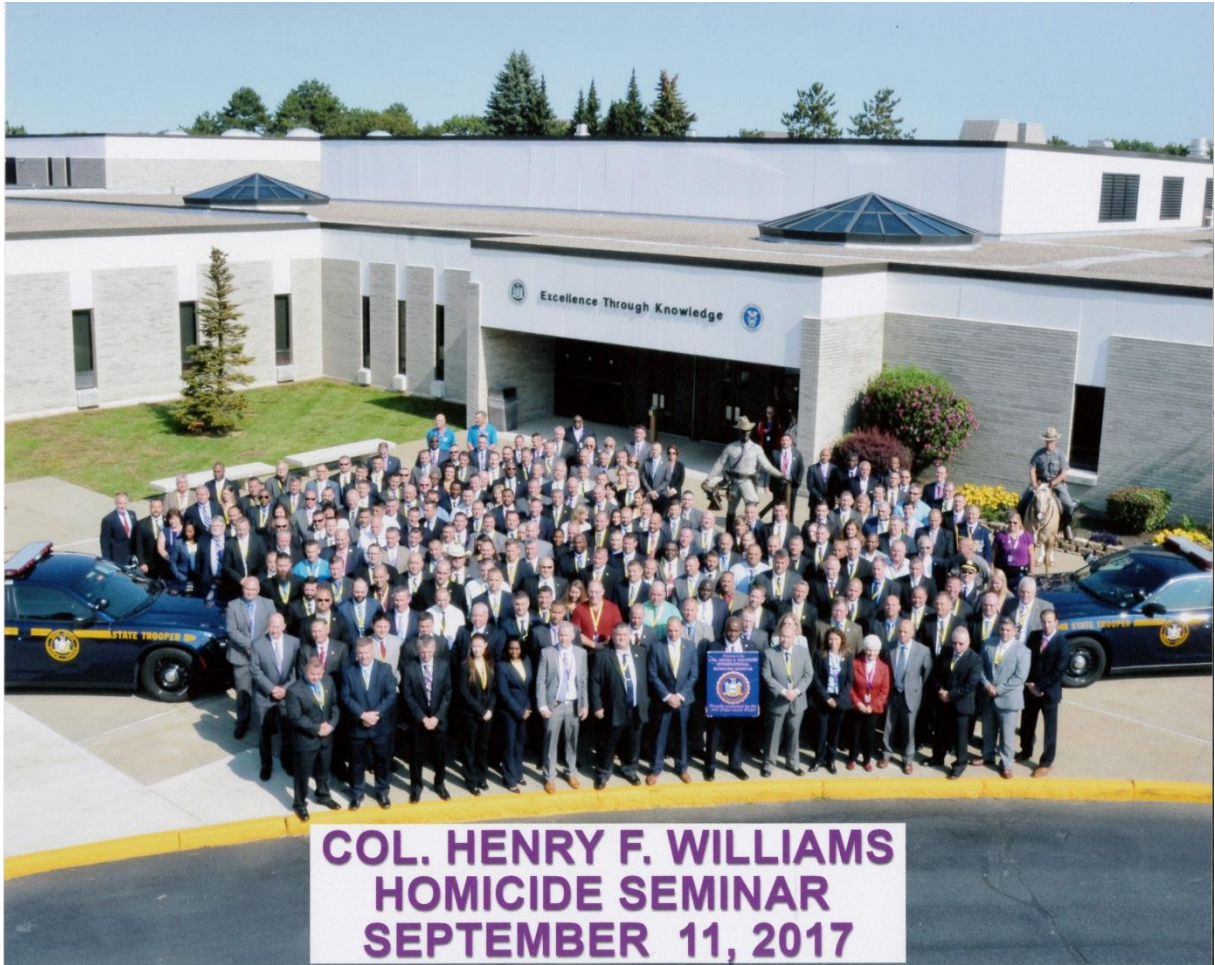
COL. HENRY F. WILLIAMS HOMICIDE SEMINAR SEPTEMBER 11, 2017