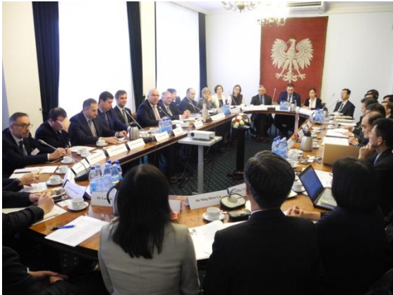
圖左：第 7 屆臺波次長級經貿諮商會議；右：金融監管合作備忘錄換文

(六) 明年度 K 次長擬率波國重要企業代表來臺與我業者進行深度交流，建議可預先接洽具知名度、有興趣及技術能力良好之廠商，並事先了解波蘭重要企業之背景，伺機促成合作商機。