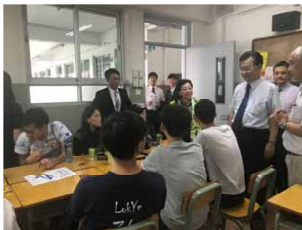
↪ 各校分組時間-國立宜蘭大學。