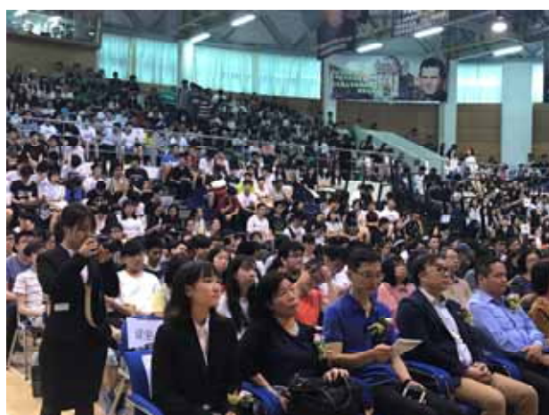
↪ 輔導會現場學生家長坐無虛席。