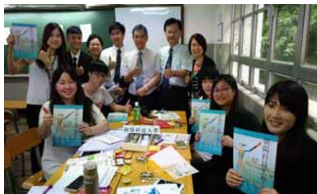
↪ 各校分組時間-朝陽科技大學。