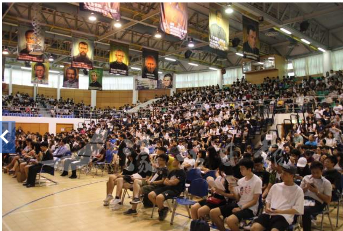
輔導會吸引逾800學生及家長出席

【特訊】由澳門中華科研教育推廣交流協會主辦、澳門天主教中學校友在台學生聯會及中華全國在台港澳大專學生聯會承辦的“2017澳門新生赴台入學輔導會”昨日舉行，邀得台灣40間高校師長及學長出席，與即將赴台升學的學生及其家長分享經驗，包括赴台升學注意事項、入台證申請、註冊入學須知等資訊，讓澳門新生做好赴台升學準備，活動吸引逾800學生參加。