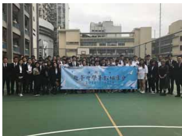
↪ 全臺港澳學聯及澳聯全體工作人員合照