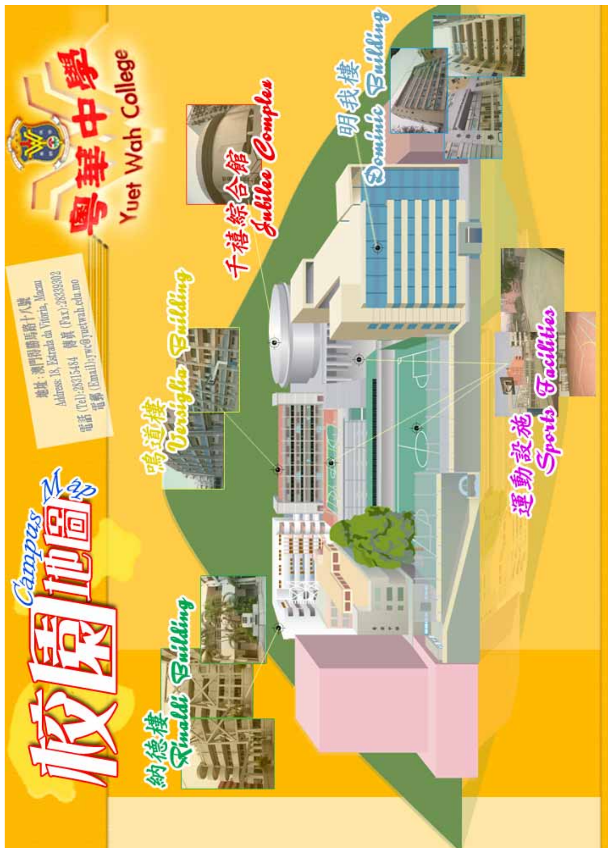
註 1：粵華中學校舍分佈圖