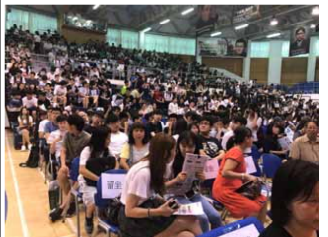
↪ 輔導會現場學生家長坐無虛席。