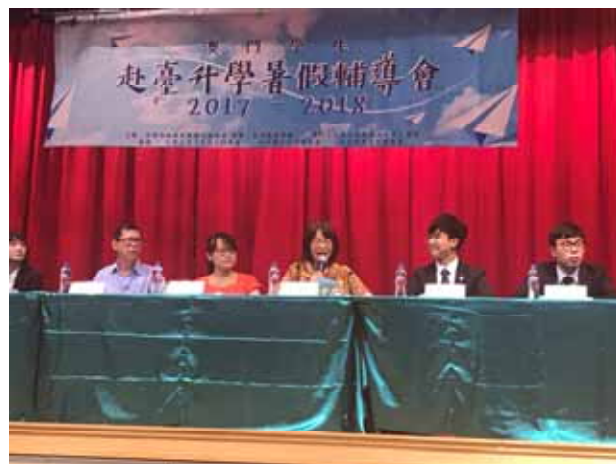
↪ 輔導大會 Q&A 時間，各單位代表於臺上應答