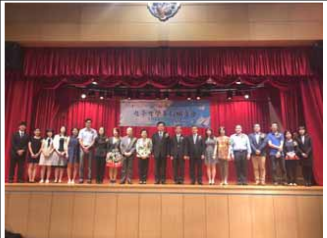
↪ 輔導大會與會嘉賓大合照。