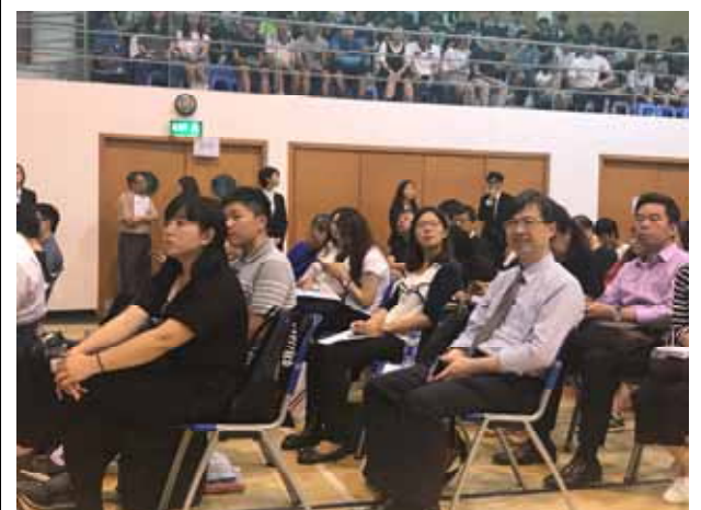
↪ 臺灣各大學師長蒞臨參與輔導會