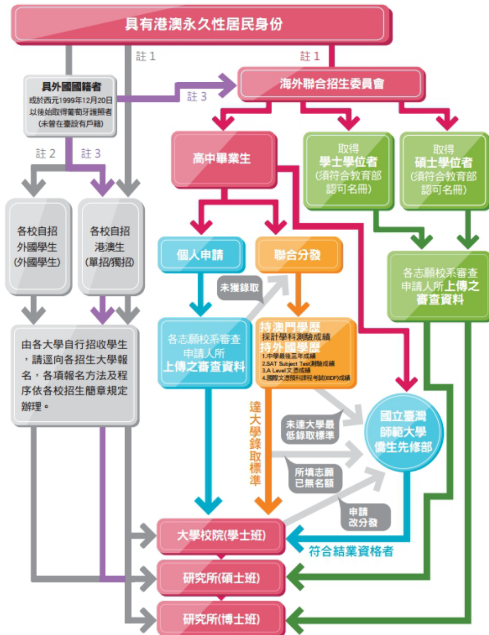
澳門赴臺 升學路徑圖