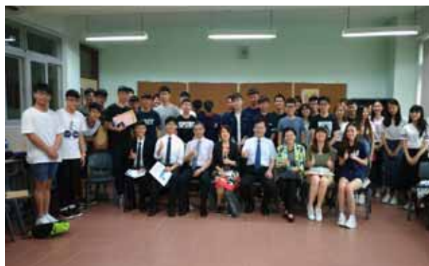
↪ 主、協辦單位於分組時間和同學們合照