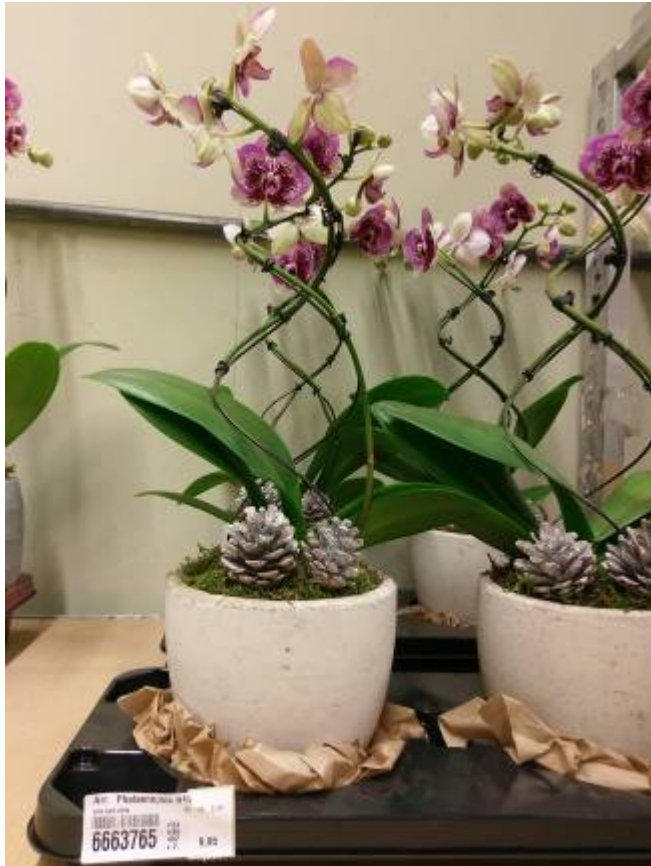
左圖為中輪雜色花，以人工雕出螺旋造型，輔以松果裝飾，批發價 9.95 歐元。