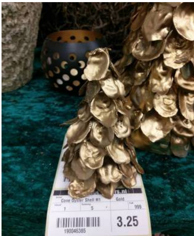
阿姆斯特丹花市內除蘭花與其他花卉外，亦販售相關園藝資材、飾品，大多利用天然素材再行美化，左圖即為牡蠣殼所製作之耶誕樹飾品。充分發揮環保再利用之精神。