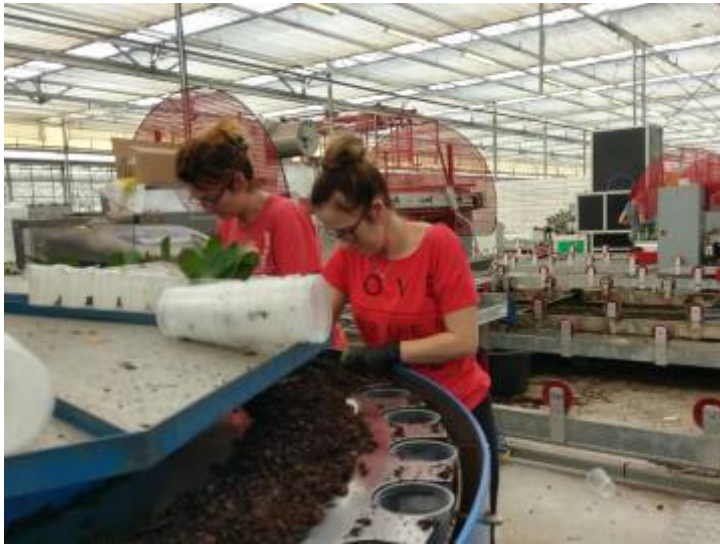
荷商採用機器輔佐人工種植小苗，以樹皮栽種。

荷蘭 Bernhard 公司過去以生產玫瑰花起家，過去曾與本事業部分公司有過生意往來。其溫室除生產蝴蝶蘭外，亦有一部份持續生產玫瑰。蝴蝶蘭生產採用荷系自動化系統，品質非常整齊，高度均一，60%產量採用自動化生產，40%則仍以人工雕花方式生產具有造型的盆花。該公司認為未來蝴蝶蘭市場價格將持平，惟能源費用必定持續上漲。因此規劃將於地底 5 公里處鑿取地熱，以節省能源費用，其節能走向之規劃相當值得本事業部學習。