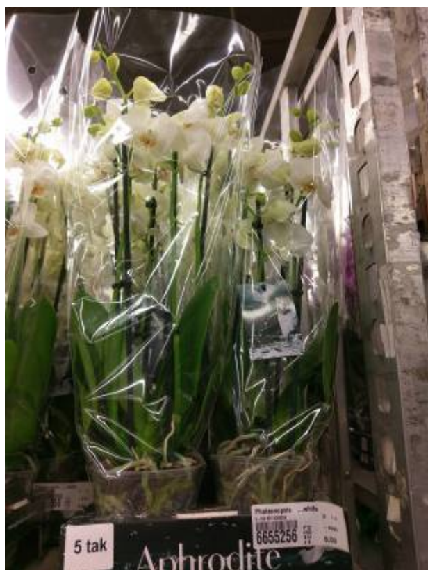
左圖即為 5 梗之大花品系蝴蝶蘭，單株批發價為 6.5 歐元。

在組盆佈置上，其風格均傾向採用自然素材，除了草花外，亦選用木質飾品、玻璃或其他高雅盆器，所呈現之風貌與臺灣當地販售蝴蝶蘭的方式相當不同。