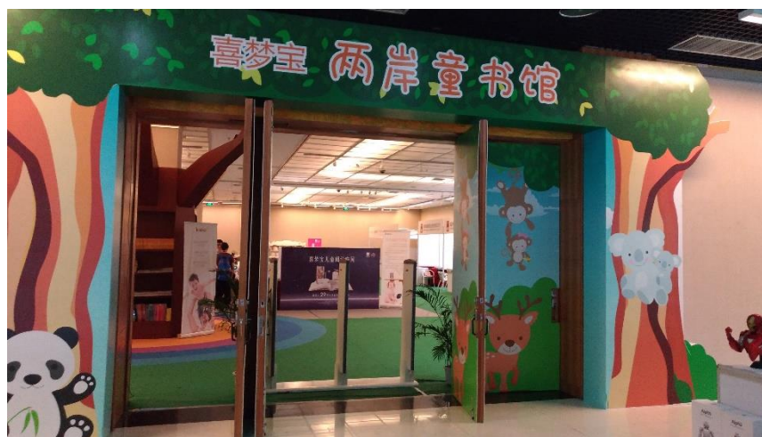
圖 4：開幕前，兩岸共同經營的童書館準備就緒。

電子書的轉捩點，首先是 2016 年投入市場的 Kobo 電子書平台幾乎是全年都在進行補貼式的打折活動，它常常打折打到要補貼出版社，進而提升了營業額。其次，上