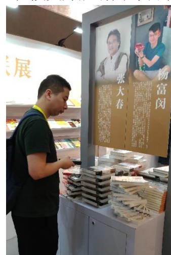
圖 9：大陸讀者對臺灣作家並不陌生。

本屆海圖會首次開放全區可向大眾銷售，以前僅開放一小區域，造成看書、選書、結帳人潮擠成一團的現象已不復見，臺灣出版業界對這項新措施表示歡迎，認為對臺灣出版界是一個很好的機會。