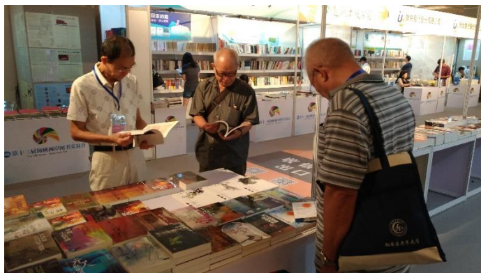
圖 16：展場開放全館零售，民眾聞香而來。

鼓浪嶼申請世界文化遺產的重要歷史風貌建築。拾級而上這棟別墅型書店，一樓設有閱覽區和圖書陳列專櫃，二樓是圖書陳列專櫃，還有臨窗閱覽卡座、繪本室、小型集中閱覽室兼討論室。書店的陳設除了按學科類別分類陳列