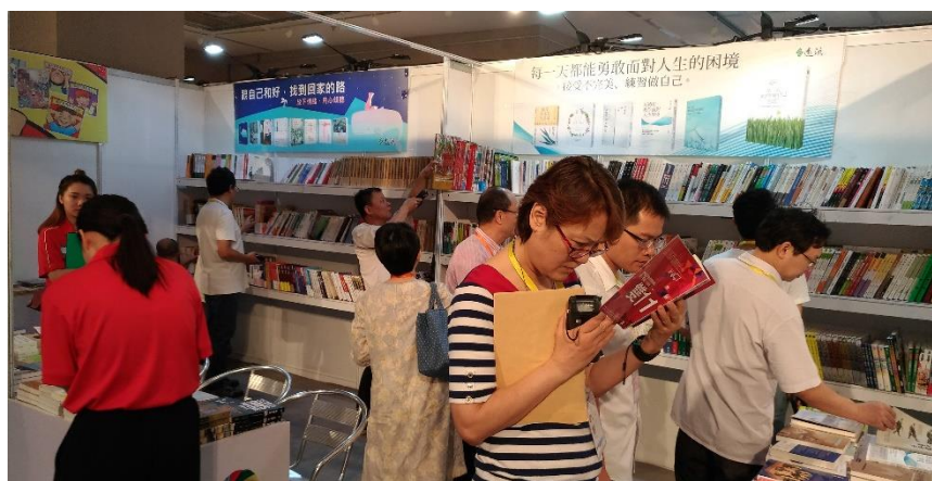
圖7：民眾對臺版書仍充滿好奇、覺得新鮮。

出版產業展示，大陸圖書看樣訂貨會，臺灣圖書採購訂貨會，兩岸圖書版權貿易，第22屆華文出版年會暨兩岸出版高峰論壇；兩岸出