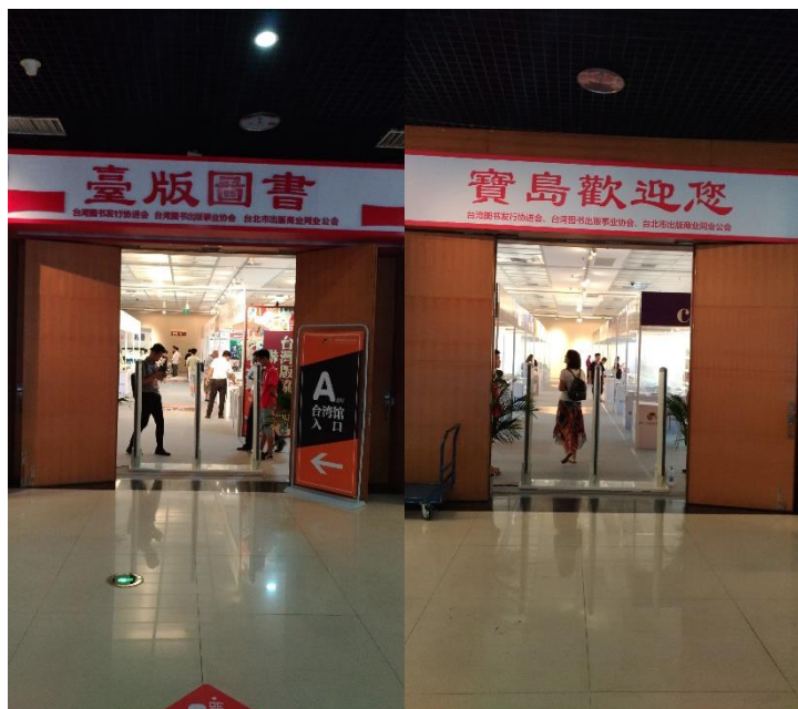
圖 3：臺灣館獨立設置於會場 2 樓。

盈虧問題。所以，當政府要推動全國閱讀時，各地設立免費借書站，手續越來越方便，讓民眾很輕易取得免費圖書閱讀，不需要考量是否對出版社造成衝擊。相反地，借書人口越多，出版社出版量越多，兩者是共生關係，沒有矛盾，沒有衝擊。