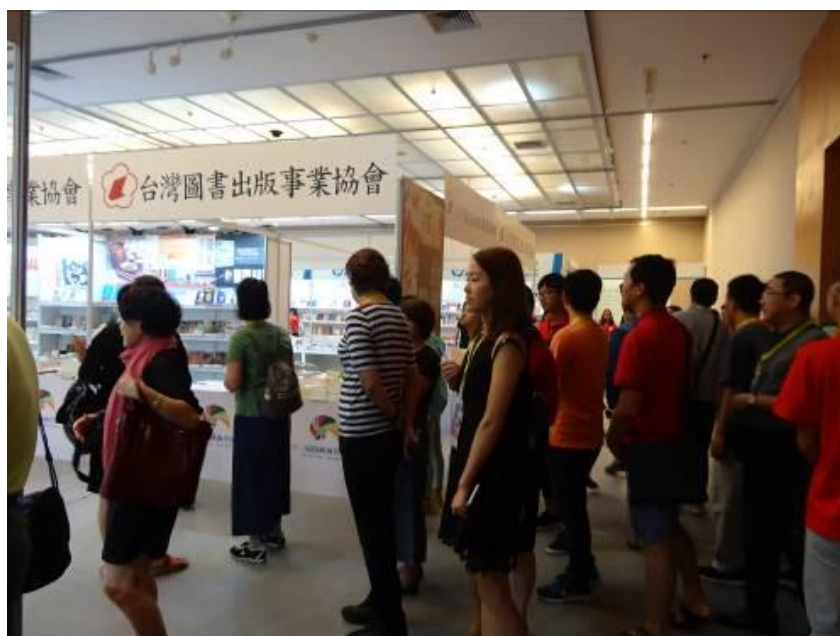
圖6：開幕時間未到，已有民眾進場排隊準備進入臺灣館。

10月13日上午，以「書香兩岸，情繫中華」的第13屆海峽兩岸圖書交易會在廈門文化藝術中心美術館正式揭開序幕，主辦單位別出心裁地在舞台上以線裝書造型搭設一座大門，且邀請兩岸代表一同補上幾針，象徵今日由兩岸共