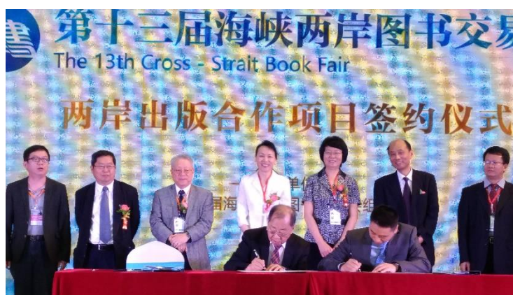
圖 17：兩岸出版社有多項合作項目現場簽約。

1921~1935》、《中國民間信仰民間文化資料匯編：第三輯》等前來，受到大陸圖書館和出版界高度關切。