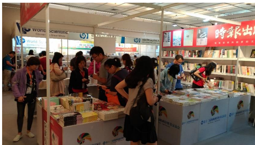
圖 8：讀者爭相搶購臺版書。

本屆海圖會展場總面積約3萬4,000平方米，除了主會場廈門文化藝術中心美術館專業展區及廈門外圖公司廈門書城全民閱讀展區外，組委會另在廈門海滄