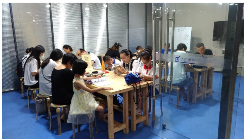
圖 22：廈門外圖集團臺灣書店一隅，民眾閱讀風氣逐漸形成。

讀者，只需要在設備上插進社保卡或借書證就能借到想看的書。而從來沒辦過借書手續者，也可通過機器立即辦理借書認證手續，辦完後現場就可借書。歸還書籍時也不受地點限制，在任何