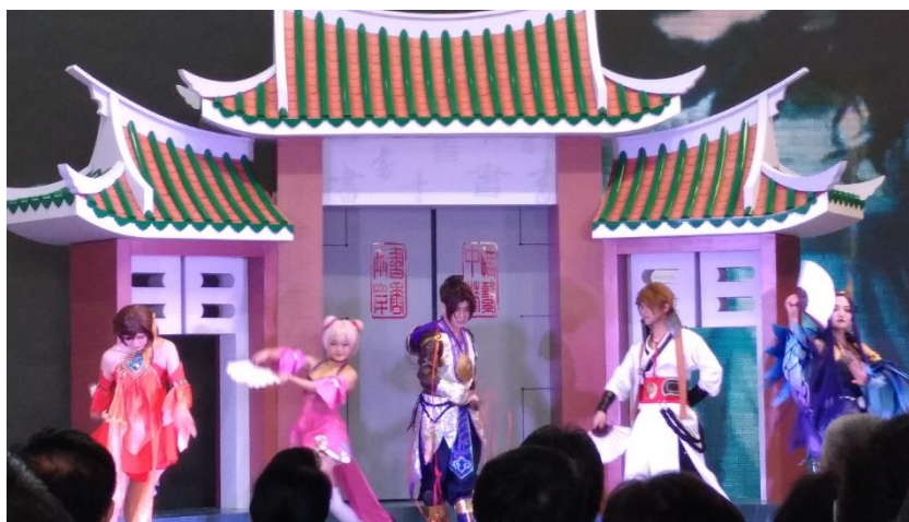
圖 5：開幕式上小朋友盡情演出。