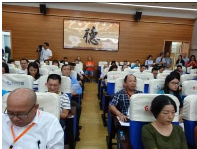
圖 19：兩岸出版高峰論壇吸引兩岸出版商前去參與。

本屆海圖會的另一焦點是兩岸出版高峰論壇暨第 22 屆華文出版年會，中華民國圖書出版事業協會、中國出版協會、香港出版總會、澳門出版協會等代表 100 餘人，就中國傳統文化與出版商機，探討出版與文創、科技等產業的融合發展，探索出版發行業轉型升級的機會，加強圖書內容、數位出版、版權交易及圖書發行貿易等合作。主辦單位特別邀請大陸及臺灣、香港、澳門出版界 7