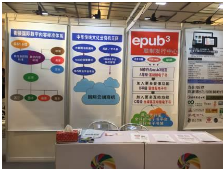
圖 20：業者展出臺灣數位出版現況。

2年前，中共國務院將數位出版及其相關規格統一化的問題視為「國家級」問題，責成中國出版協會以及中國數字出版聯盟研發，當時對外發佈研發有成，推出的系統號稱「無需編碼，零基礎輕鬆製作具有極致體驗的APP，可同時編輯圖、文、影、音，產製出互動APP