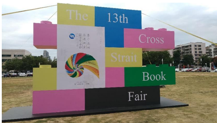
圖 2：第 13 屆海圖會視覺形象設置於會場前。

然而，彼此之間因為國情、自由化程度不同，中國大陸採共產制度，計畫出版，出版言論自由程度低，出版社幾乎都具官方色彩；採計畫經濟，盈虧並非出版社的重要考量因素，在兩岸圖書出版交流合作上仍存在部分不同做法與節奏，某種程度阻礙了交流進程。尤其中共十九大後，將習(近平)思想