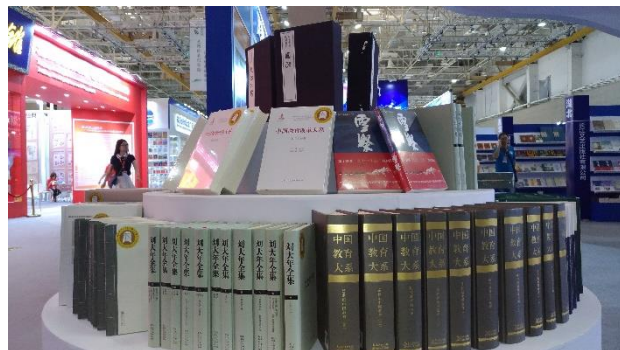
圖 15：中版圖書也是圖書館大宗採購的標的。 圖 16：展場開放全館零售，民眾聞香而來。

外，還將兩岸暢銷新書、關於閩臺兩岸風土人情的特色圖書、廈門和鼓浪嶼地方文獻、作家簽名書、進口西文原版圖書專櫃陳設，另外還特別為小朋友打造了一間繪本室。書店所在的三樓面積有215平方米，已經