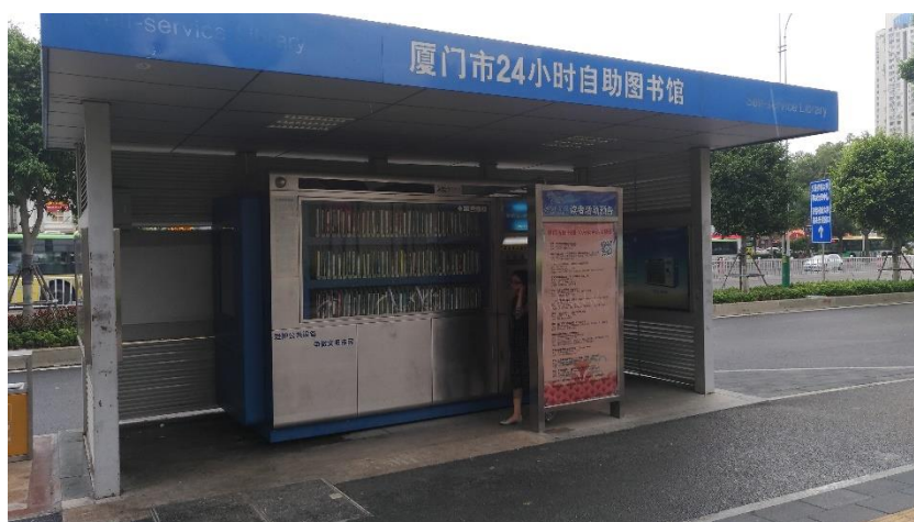
圖 21：廈門市區公車站旁都設有 24 小時自助圖書館推廣閱讀。

廈門，這個長期以來被拿來與金門等質齊觀的城市，多年來的經濟、工業發展，已讓這個城市竄升為中國大陸一線城市。在經濟發展逐漸成熟後，和其他一線城市一樣，發現文化素質遠遠