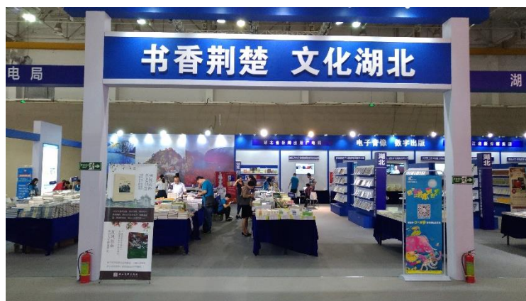
圖 18：主賓省湖北省端出各種好書以饗讀者。

兩年一度在廈門登場的海峽兩岸圖書交易會，於10月15日熱鬧成功畫下句點。綜觀本次交易成果豐盛，兩岸達成版權貿易352項，圖書成交額約人民幣4,600萬元(約合新臺幣2億1,252萬元)。