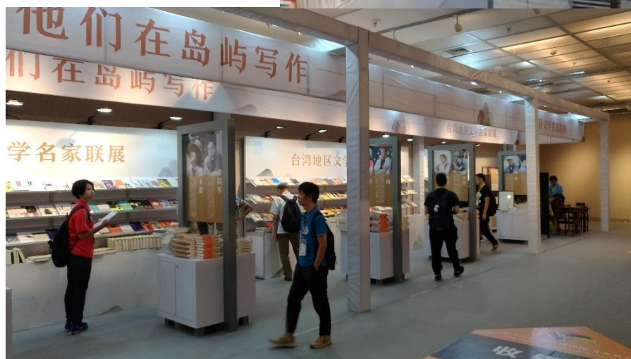
圖10：「臺灣文學名家聯展」以「他們在島上寫作」為主題展出

了臺灣文學名家簽名書30餘種、2,000餘冊，包括白先勇、蔣勳、張大春、朱天心、舒國治、簡媜、黃春明、吳明益、蘇偉貞、駱以軍、王定國、周芬伶、廖玉蕙、蔡素芬、陳雨航、楊富閔、蔡智恆、張曼娟、朱德庸、向明、蘇紹連等20餘位臺灣文學名家之一時之作，可謂當代臺灣文學及華語文學成果的一次繽紛蟹逅。