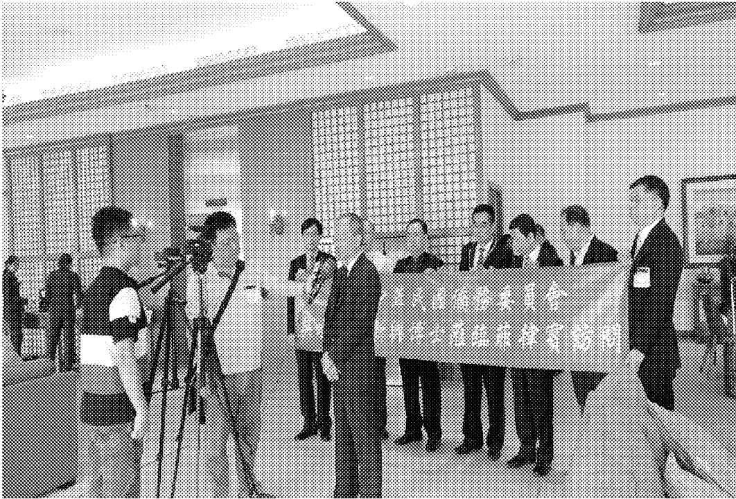
9月30日上午抵達馬尼拉機場接受宏觀電視記者專訪