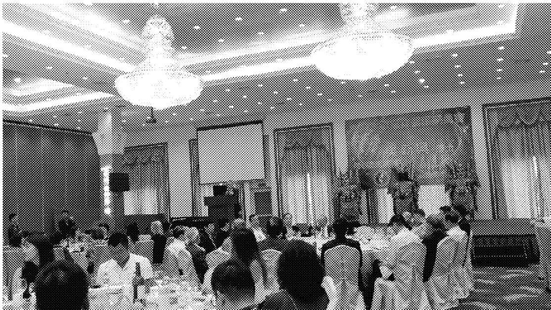
10月1日出席臺灣同鄉會歡迎午宴