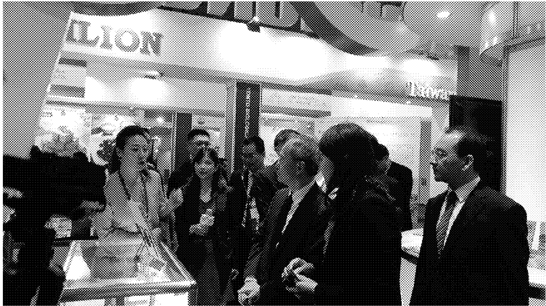
9月30日下午赴臺灣形象展現場(2)