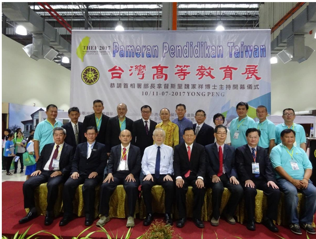
圖四、永平場次開幕典禮嘉賓合影

在為期兩天的永平場次中，到場觀展的學生除了華裔學子之外，也有部分的馬來裔及印裔學生到場。永平場共計有 5,500 人觀展。