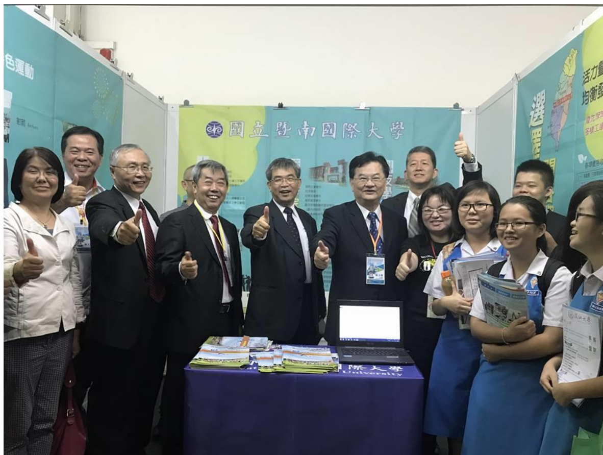
圖五、長官前來暨大攤位鼓舞士氣

在為期兩天的永平場次中，到場觀展的學生除了華裔學子之外，也有部分的馬來裔及印裔學生到場。永平場共計有 5,500 人觀展。