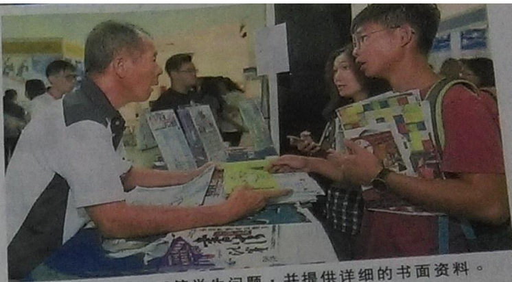
台湾大学代表耐心回答学生问题，并提供详细的书面资料。