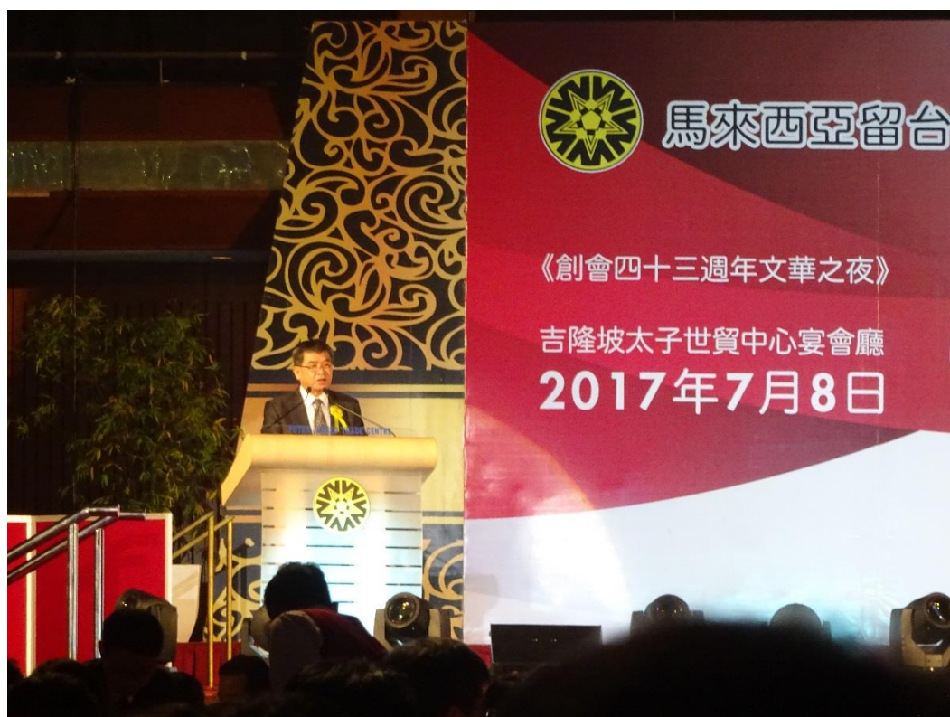
圖三、蔡清華政務次長在文華之夜致詞

7月8日晚上，馬來西亞留臺聯總43週年文華之夜「同心築夢，共創精彩」，在教育部蔡清華政務次長及僑務委員會張良民主任秘書的致詞下，拉開了晚宴的序幕。