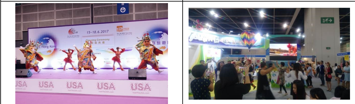
香港旅展大會開幕式