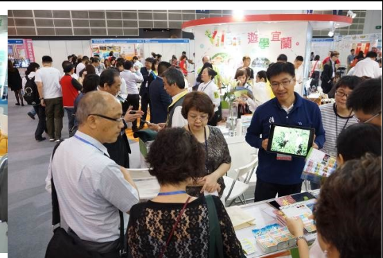
向民眾解說農場旅遊資訊