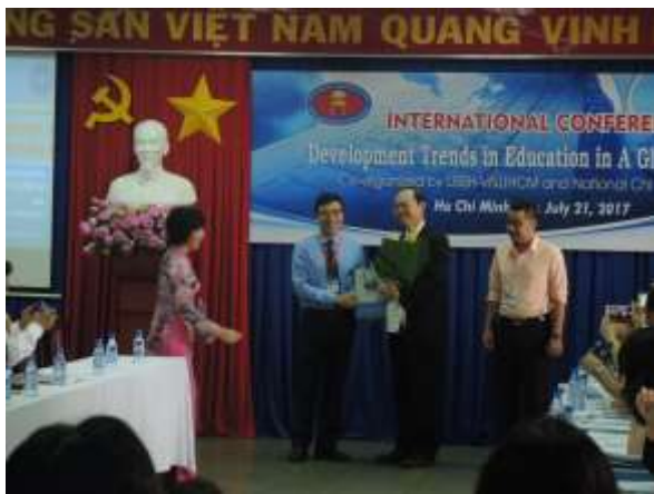
胡志明市人文與社會科學大學副校長與本校教育學院院長互贈紀念品。