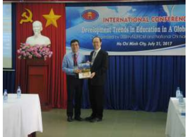
胡志明市人文與社會科學大學副校長與本校教育學院院長互贈紀念品。