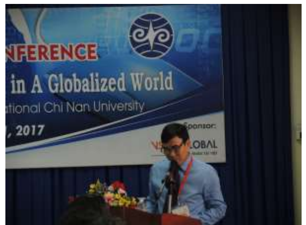
胡志明市人文與社會科學大學副校長開幕式致詞。