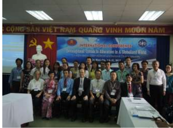
胡志明市人文與社會科學大學與國立暨南國際大學與會人員合影。