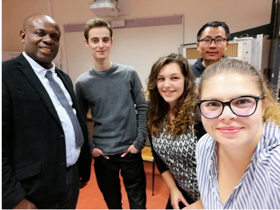
照片說明: 研討會結束後同學與教授合影