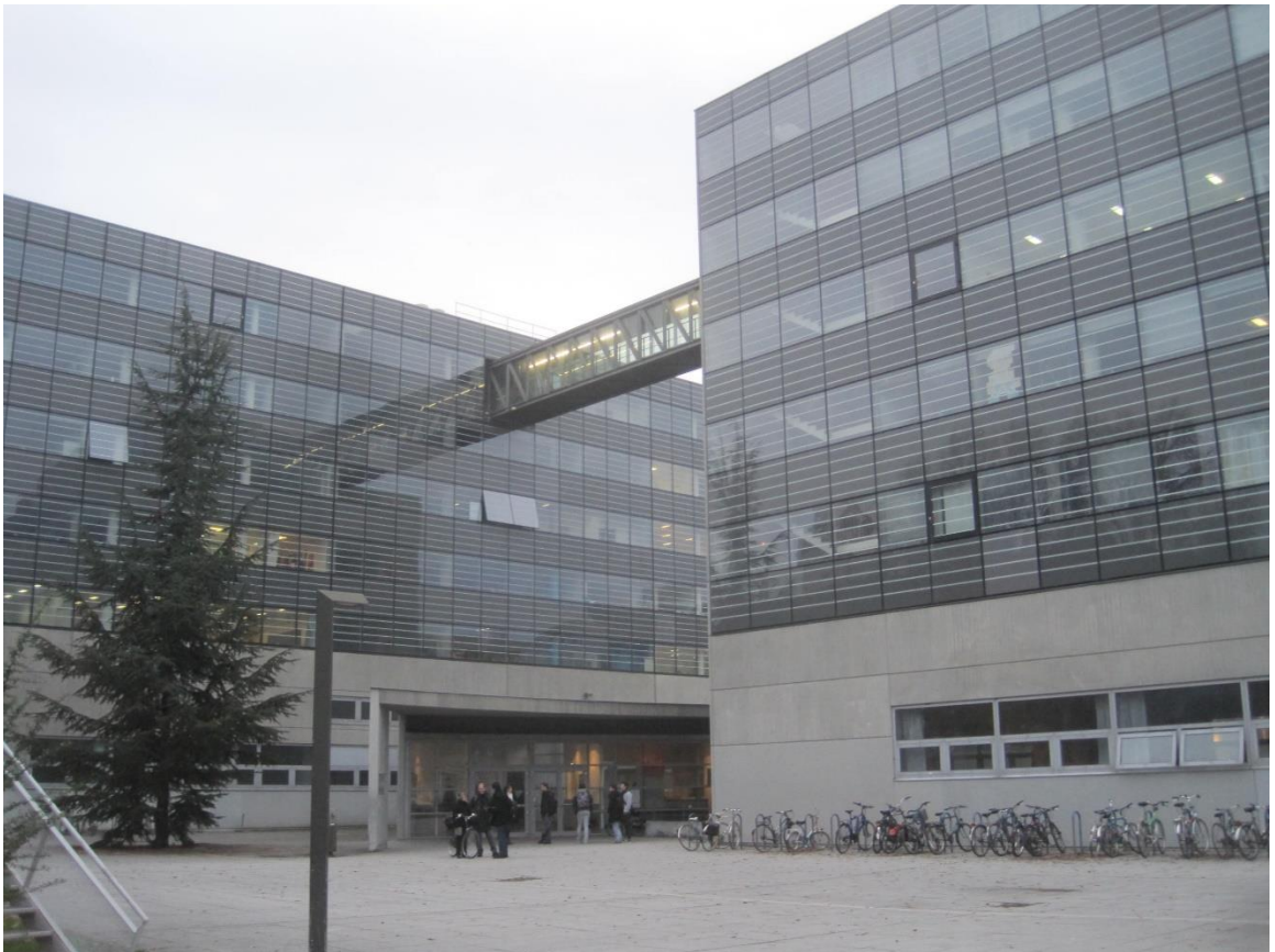
照片說明:史特拉斯堡大學(University de Strasbourg)文學院坐落大樓 Portique

本人自 106 年 9 月 8 日赴至法國史特拉斯堡(University de Strasbourg)進修語言科學(Sciences du langage)碩士班，緣起於國防部 106 年度人才培育甄選作業實施計畫內容內之語文教育類，進修目的旨在於培養國軍各單位實際從事語文訓練班次教官成為語言人才，以達為用而育及計畫培養之宗旨，本人於 108 年 7 月 4 日修業期滿後，返國報到任職。本報告內容旨在簡述人員於進修期間相關經驗與心得感想，提供相關資訊於大眾查閱，更可提供日後國內培訓語言教學、語言研究及翻譯人員訓練派訓參考資料。