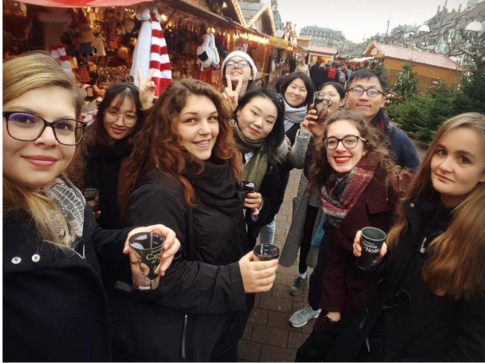
照片說明: 與同班外國同學一體驗耶誕市集