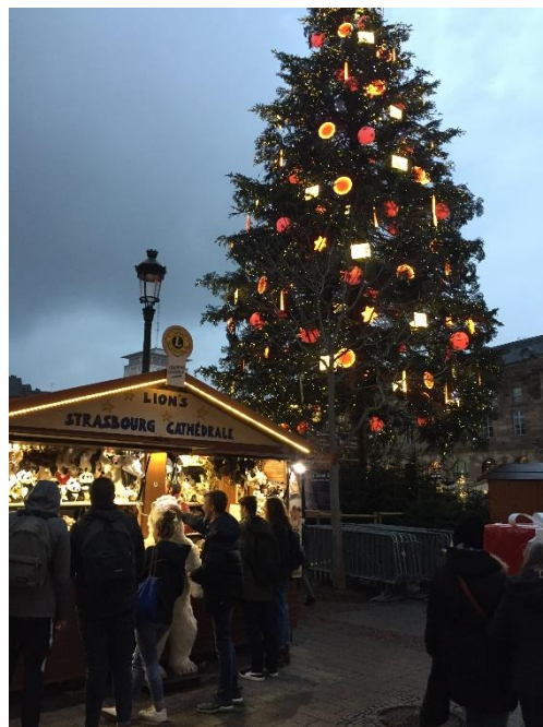
照片說明: Kleiber 廣場耶誕節市集場景

史特拉斯堡又有法國耶誕節首都(capitale de Noël)之別名，每年耶誕節前夕市區便會籌畫舉辦耶誕市集，此時將會是該城市觀光旅遊人數最多之時刻，也因此人員在 2018 年 12 月該城市成為恐怖攻擊目標之一。