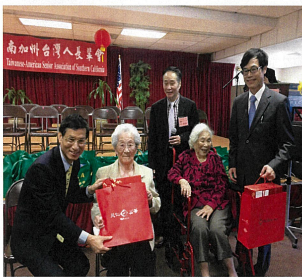
10月28日出席南加州臺灣人長輩會重陽敬老慶祝會，關懷問候兩位百歲耆老