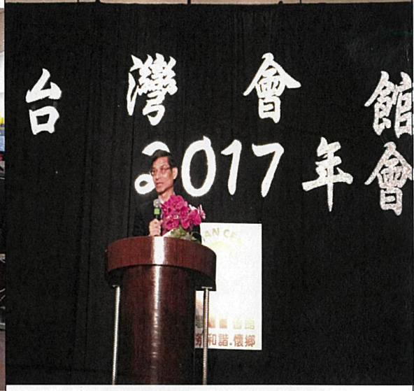
10月28日於大洛杉磯臺灣會館年度大會以「臺灣的改革」為題發表演說