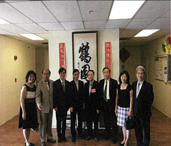
10月28日參訪長照機構「鶴園老人公寓」