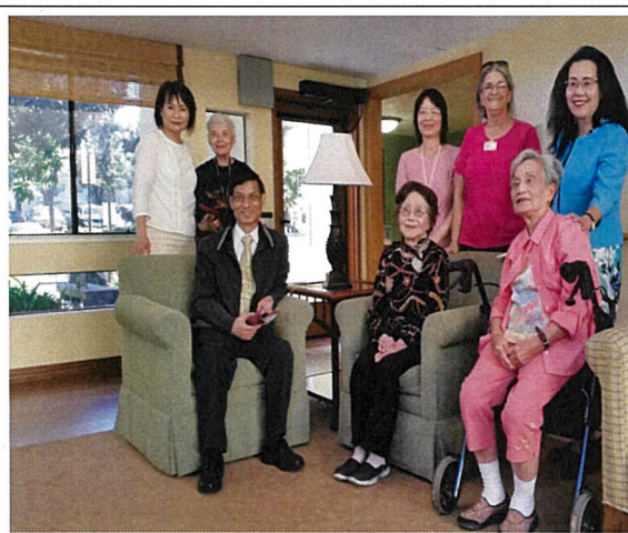
10月24日與「Sunnyview」主管及住戶合影