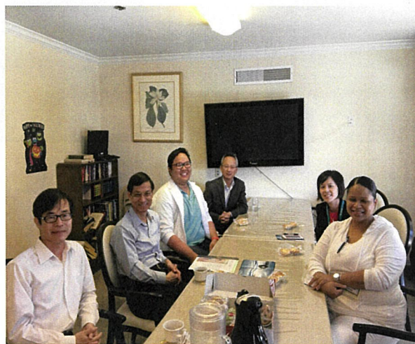
10月27日與阿罕布拉醫療保健中心護理及管理人員意見交流