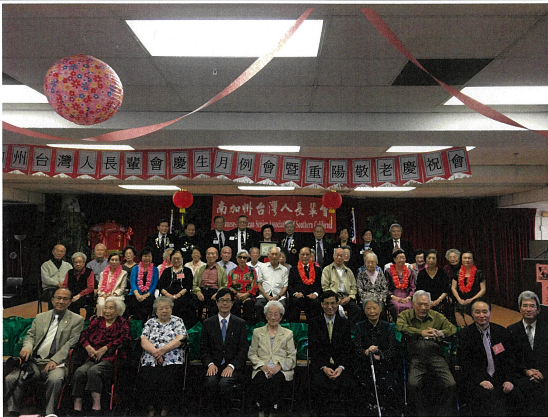
10月28日出席南加州臺灣人長輩會重陽敬老慶祝會