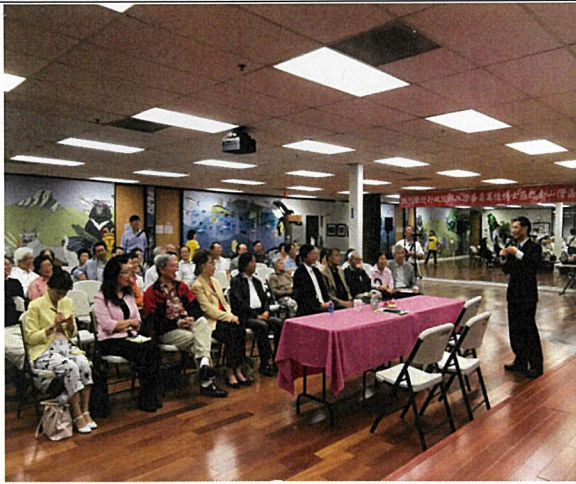
10月25日赴北加州臺灣會館發表專題演講