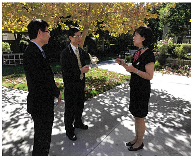
10月24日參訪 Fremont 市長照機構「樂敘之家」

行政院林政務委員萬億出席「大洛杉磯臺灣會館」年度大會暨訪視舊金山與洛杉磯僑社相片