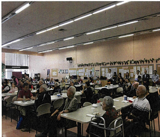
10月27日與亞凱迪亞成人日間保健中心耆老同樂