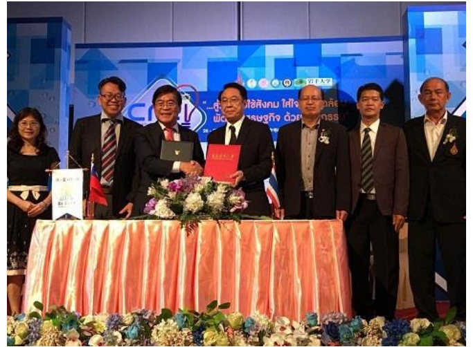
與 RMUTL 簽署合作備忘錄