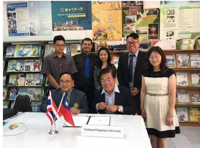
與湄洲大學洽談合作並簽約