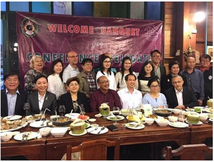
與 BSRU 參與研討會之來賓合影