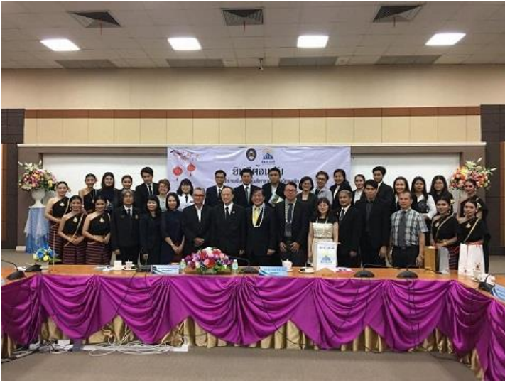
與 URU 師長洽談合作議題，會後留影