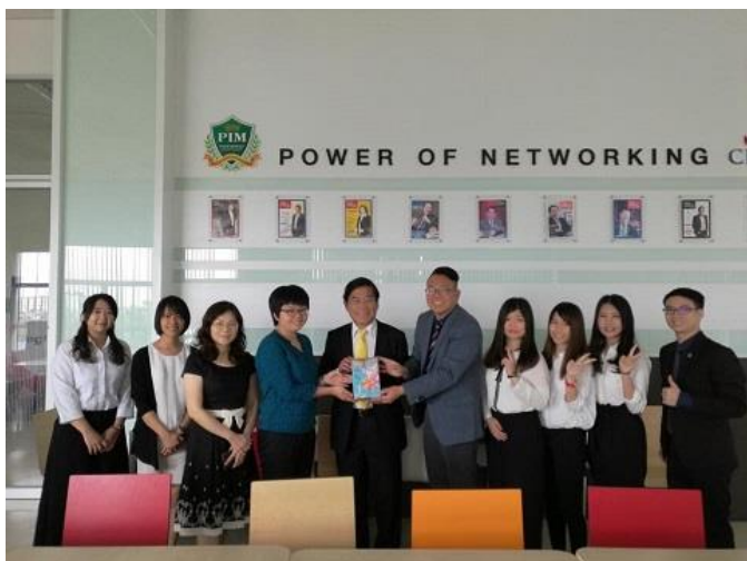
於 PIM 訪視執行新南向築夢實習生