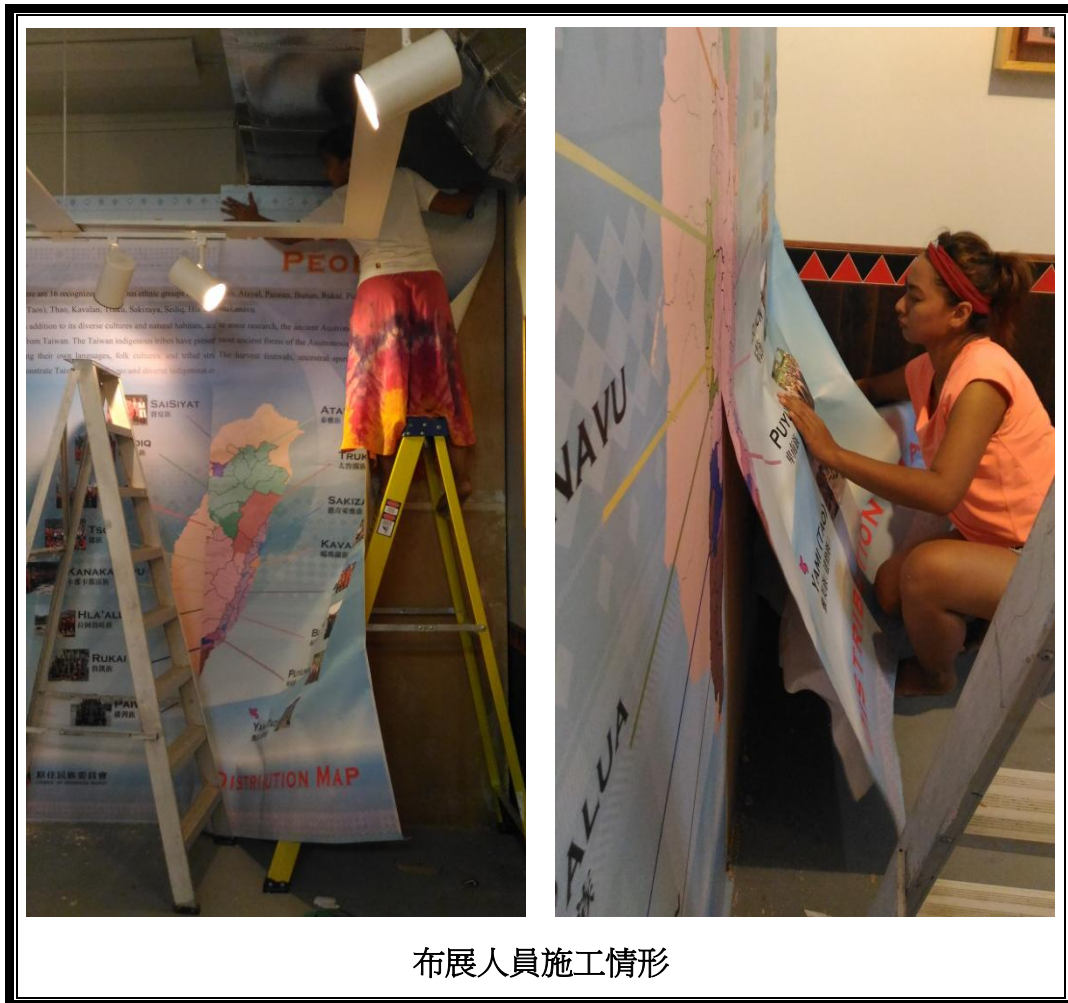
布展人員施工情形

本次出訪最重要的工作是針對臺灣展示區內容之資訊更新，實際施工流程及遇到的問題比原先評估的還要繁雜許多，例如大型展版的更新，需要用到的工具如砂輪機、坯土以及砂紙須在帛琉當地租借或購買，惟帛琉當地物資缺乏，相關器具又租借不易，增加了人員執行任務的困難度，又為順利更換大型展板，更需要兩位以上專業人員才得以協力完成，汰舊更新工程遠超過人員原先預期的困難，所幸布展人員具有足夠專業技能與熱忱，及博物館館方人員、臺灣駐帛琉大使館同仁各方面的鼎力協助，讓原本預估需要四個工作天的施工作業得以在有限的兩個工作天半就完成任務。