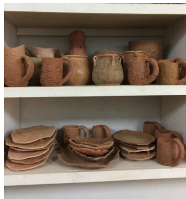
帛琉陶藝學校設置於帛琉博物館後方，本會設立陶藝培訓工作坊，協助帛琉復振失傳逾百年的傳統陶藝。