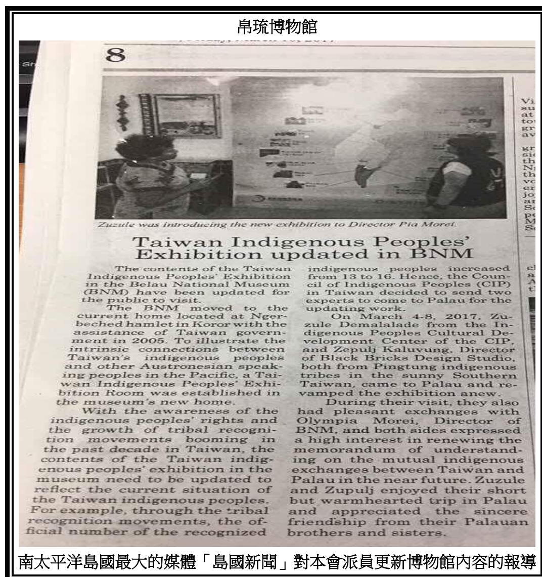
南太平洋島國最大的媒體「島國新聞」對本會派員更新博物館內容的報導

本次任務成圓滿達成，不僅順利執行帛琉國家博物館臺灣原住民族文化展示區舊型展版更新作業，展現我國推動原住民族政策之努力與成果，本會跨處室通力合作，在有限的工作天數及工作人力之下完成任務，展現本會積極的執行力與效率，並藉此蒐集現場資料，以作為臺灣文化展示區未來全面更新規劃所需，有效推廣原住民族文化於國際文化展示平臺。