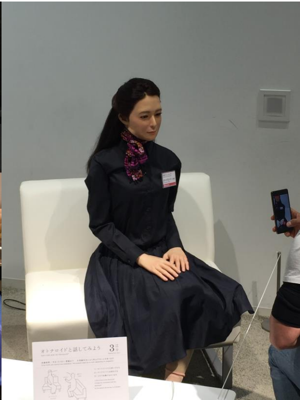
參訪日本科學未來館-Miraikan。