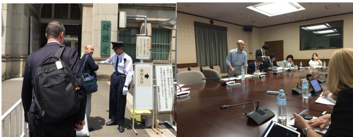
ICA 2017 年第 2 次委員會議討論。