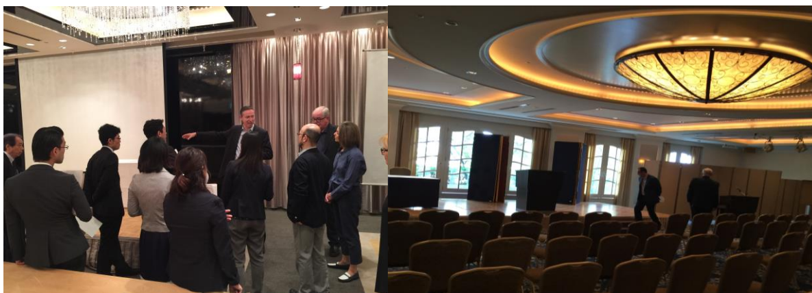
ICA 2017 年年會場地勘察。