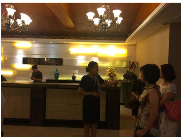
安麗爾 SPA 會所參訪交流