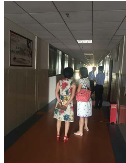
美容學院參觀交流