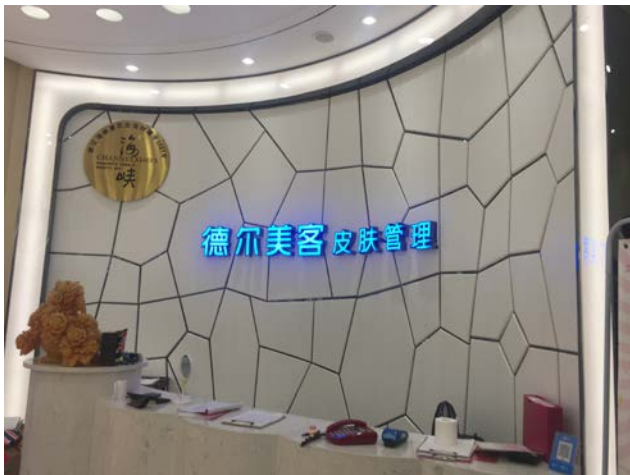
醫美診所接待中心