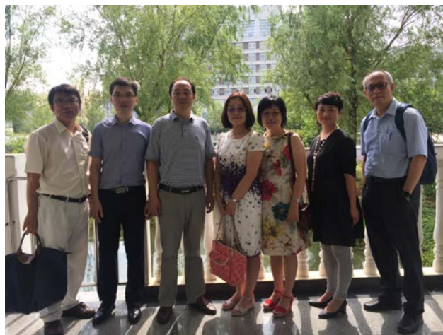
與老人護理院人員合影