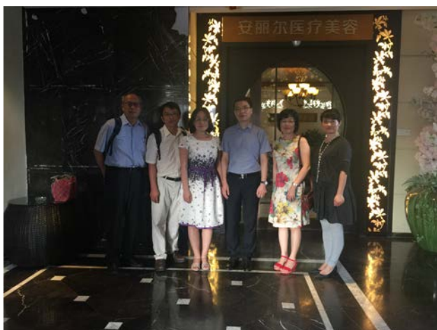
與安麗爾 SPA 會所陪同參訪人員合影