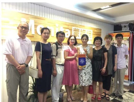
與國際證照認證學校人員合影