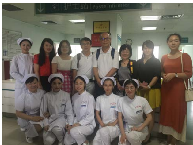
與武漢大學中南醫院護理人員合影