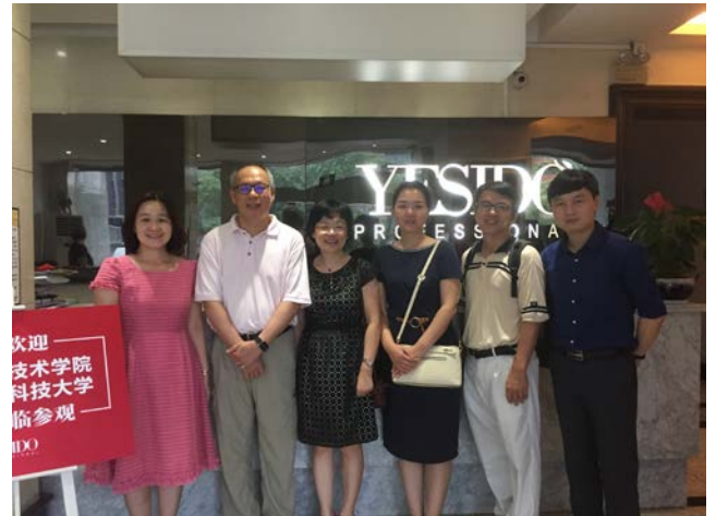
與美麗椰島美容美髮有限公司人員合影