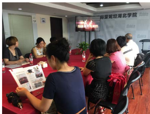
國際證照認證學校介紹