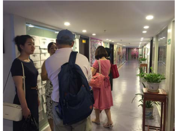
與學校負責人交換意見