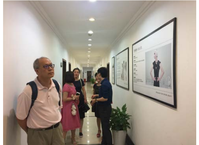
參觀公司及交流討論