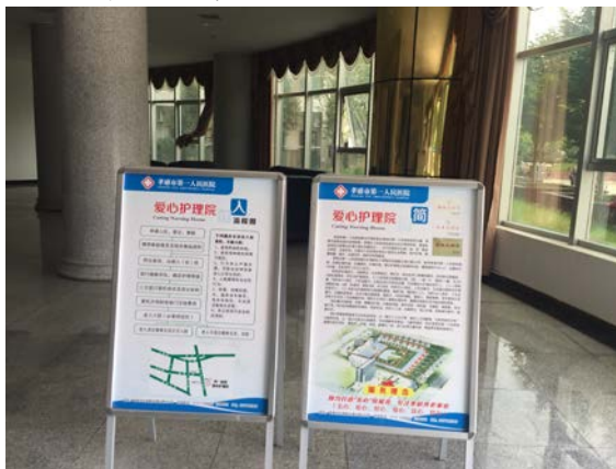
孝感市第一人民醫院老人護理院