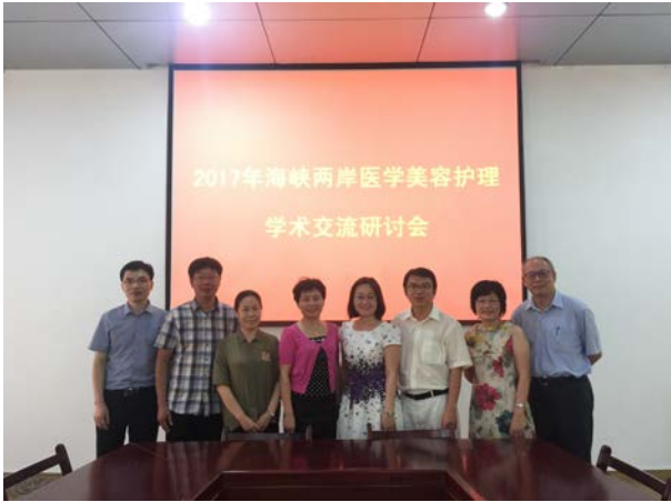
與湖北職業技術學院教師合影