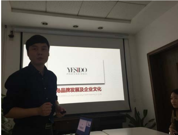
人資部主管公司簡報