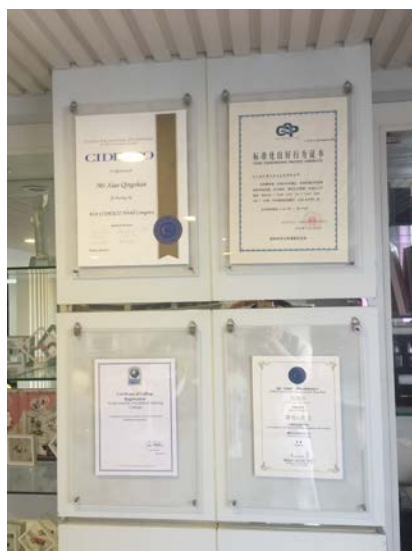
相關認證之國際證照