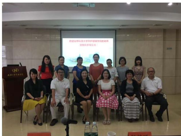
與武漢大學中南醫院主管合影