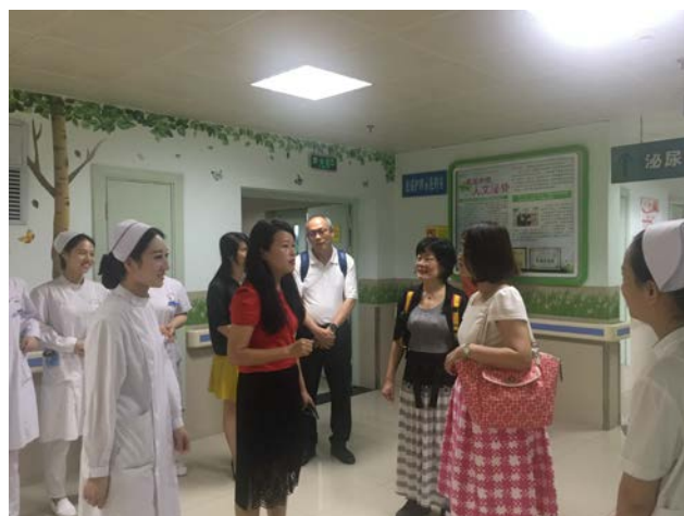
中南醫院參觀交流