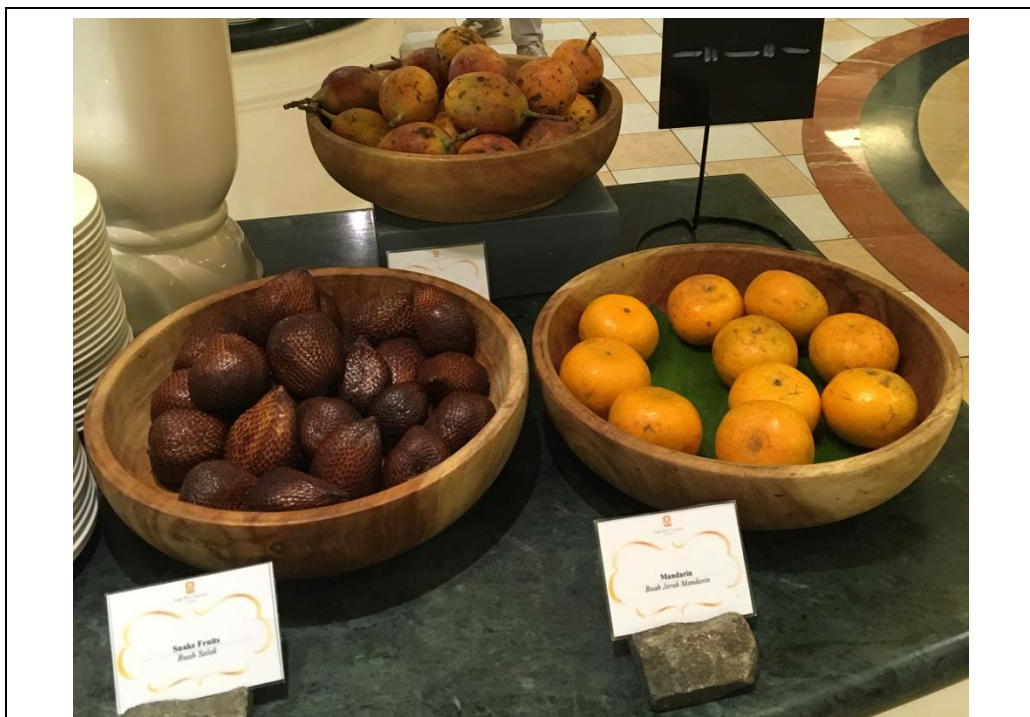
當地特有的蛇皮果、厚皮百香果、柑橘，別有風味。