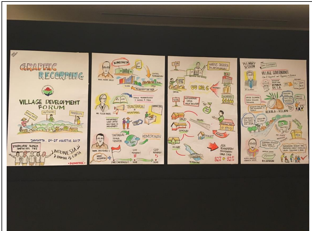
農村發展論壇戶外展場透過簡易圖文說明每天討論的內容及進程，增進參與者的認識。