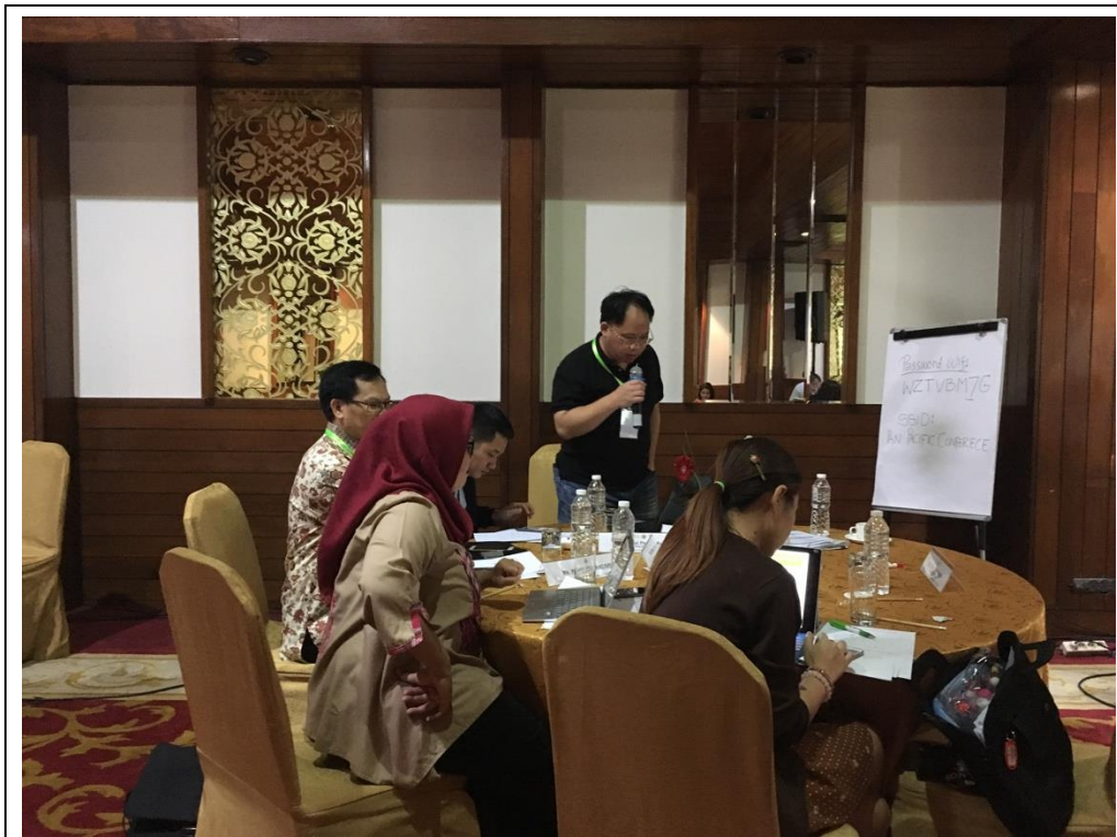
圖四、團體討論報告