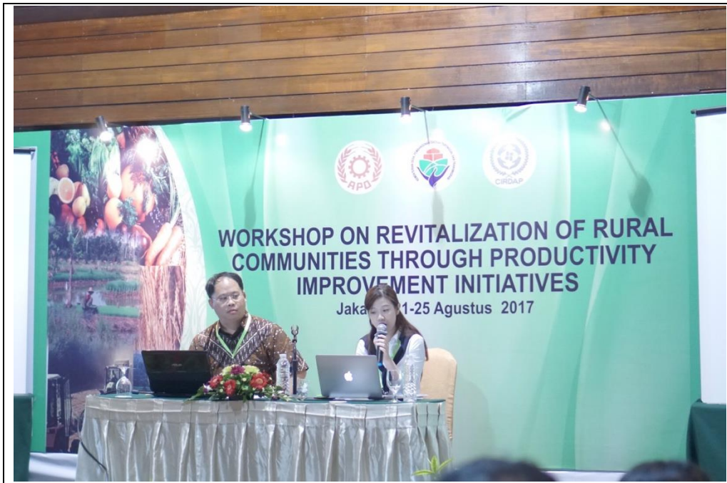
圖三、各國代表進行國情報告