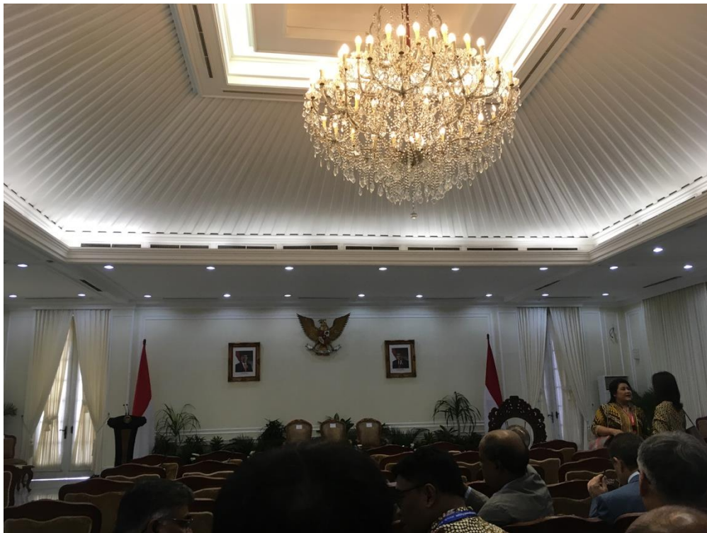
圖五、於副總統官邸參與印尼所主辦之農村發展論壇開幕典禮