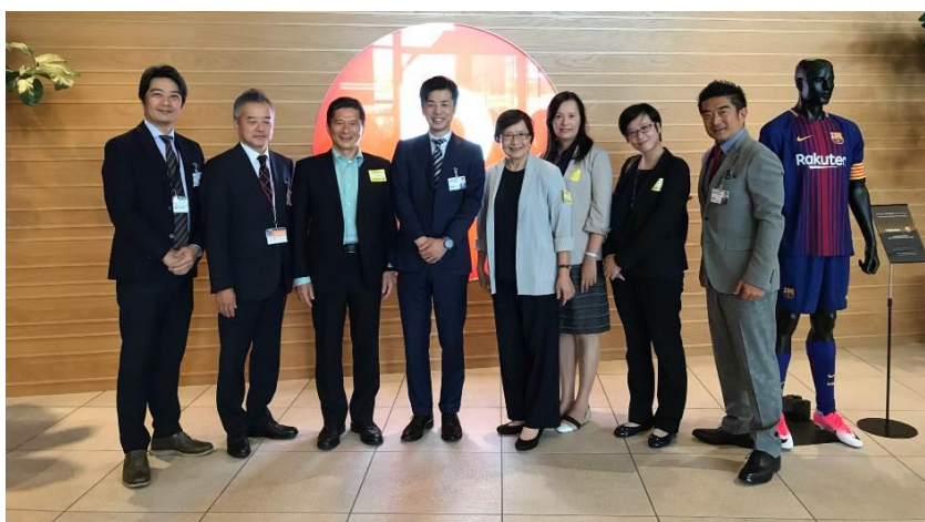
圖 5：與樂天旅遊株式會社合影

樂天旅行社是一個以線上網站與 APP 做為主要銷售的平臺的公司，自由行、年輕族群為其主要用戶，該公司人員針對自由行旅客的交通接駁規劃、住宿推薦地點(如桃園或新竹)等提出了非常實際的詢問，此外，對於本會製作的浪漫臺三線手冊表示內容完整，將著手研究相關內容。