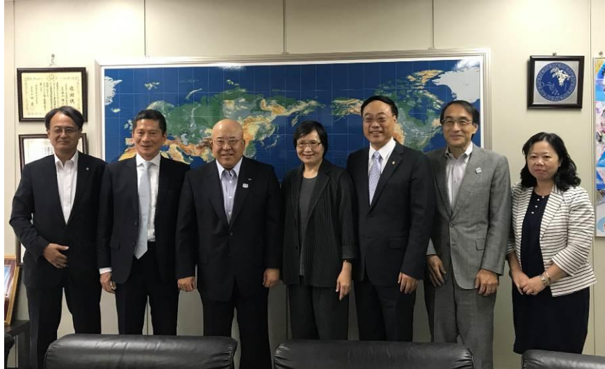
圖 11：與 JATA 日本旅行業協會合影