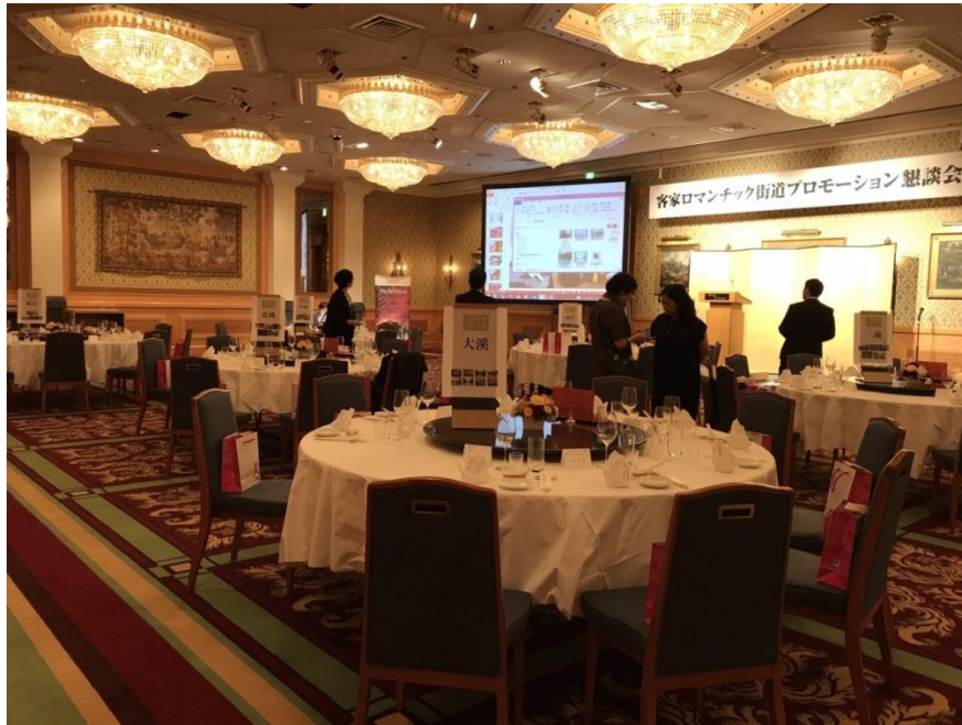
圖 21：浪漫臺三線說明暨懇親會-各桌桌次特別以臺三線上地名命名