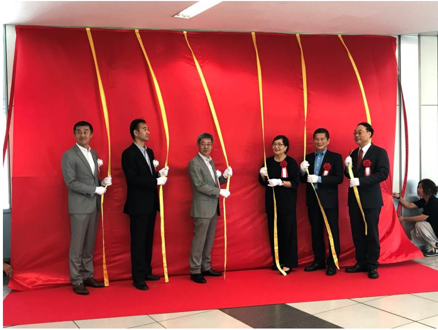
圖 32：京急電鐵臺灣觀光廣告牆揭幕