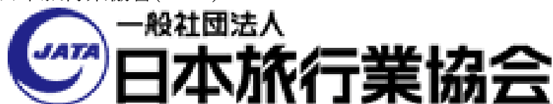
圖 10：JATA 日本旅行業協會 LOGO