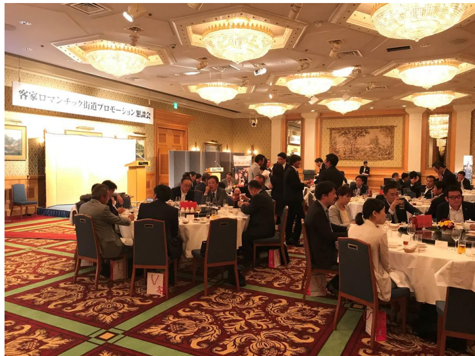
圖 28：浪漫臺三線説明暨懇親會現場情況