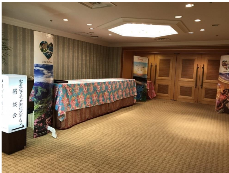
圖 20：浪漫臺三線說明暨懇親會-報到區域