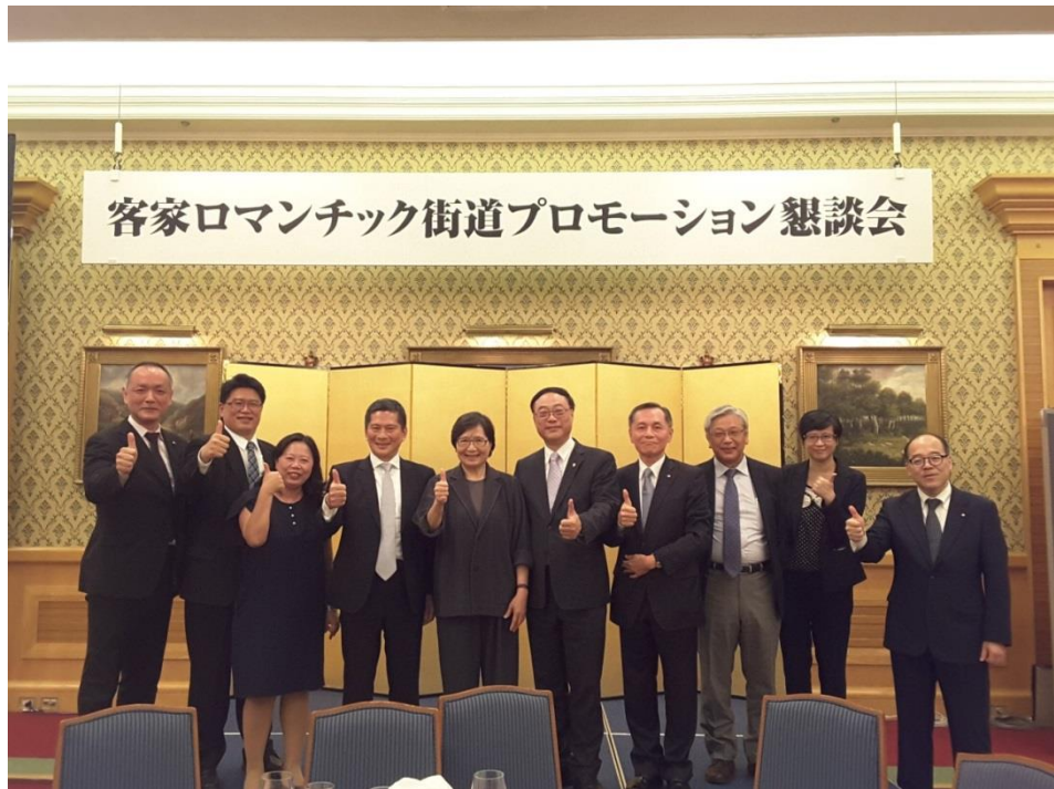
圖 29：浪漫臺三線說明暨懇親會會後合照