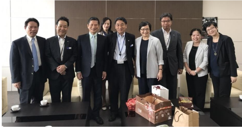
圖 2：與株式会社日本旅行合影