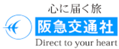
圖 13：阪急交通社 LOGO