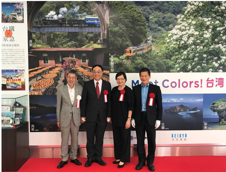
圖 33：京急電鐵臺灣觀光廣告牆揭幕合影：京急電鐵社長根津嘉澄(左一)