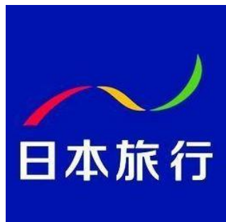
圖 1: 株式会社日本旅行 LOGO