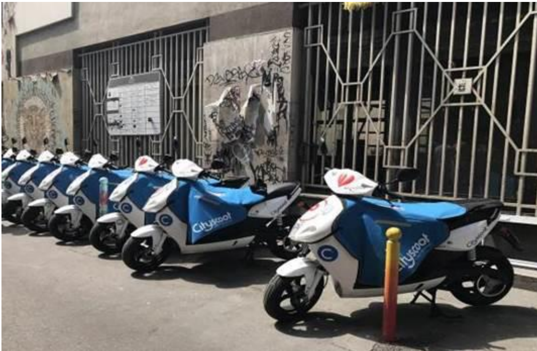
圖 5 Cityscoot 車輛