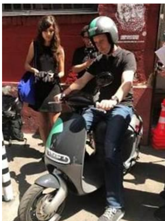
法國媒體對來自台灣電動機車感到非常興趣，紛紛預約試乘體驗