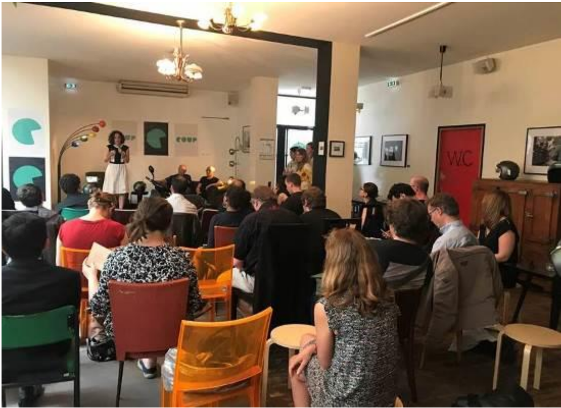
圖 4 COUP 總經理說明