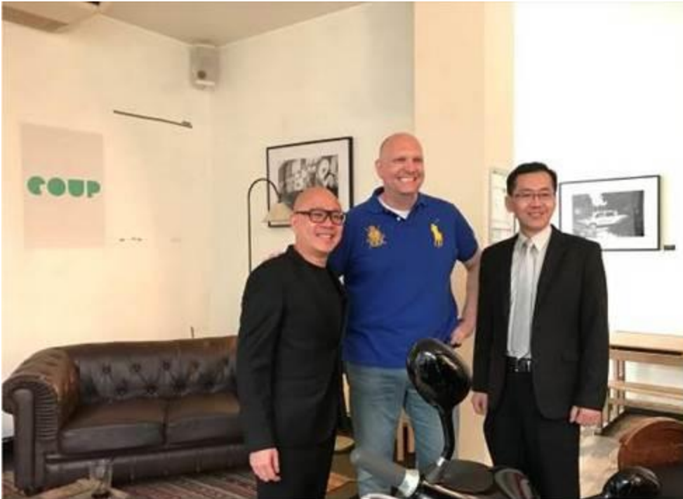
圖 1 與 Gogoro 執行長 陸學森及 COUP 總裁 Mat Schubert 合影