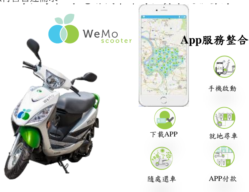
圖 9 新創團隊威摩科技即時租賃系統服務模式