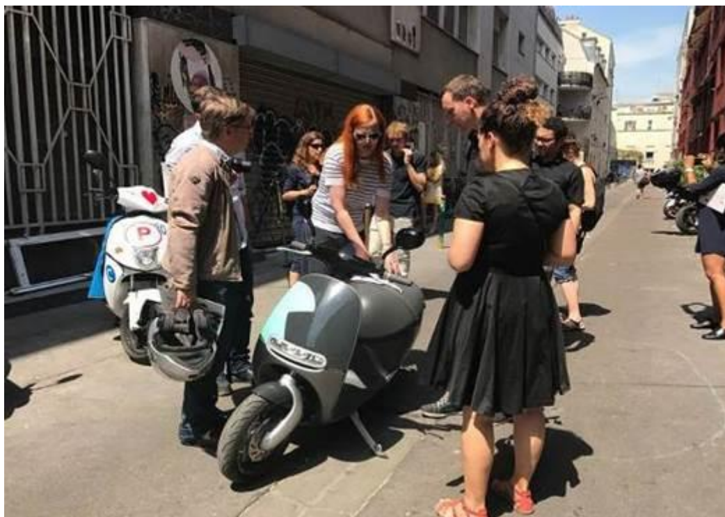
法國媒體對來自台灣電動機車感到非常興趣