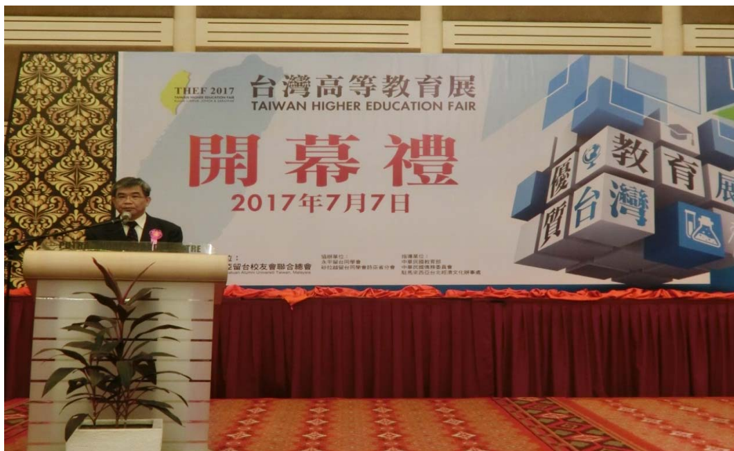
蔡政務次長應邀擔任「106年臺灣高等教育展」開幕致詞嘉賓