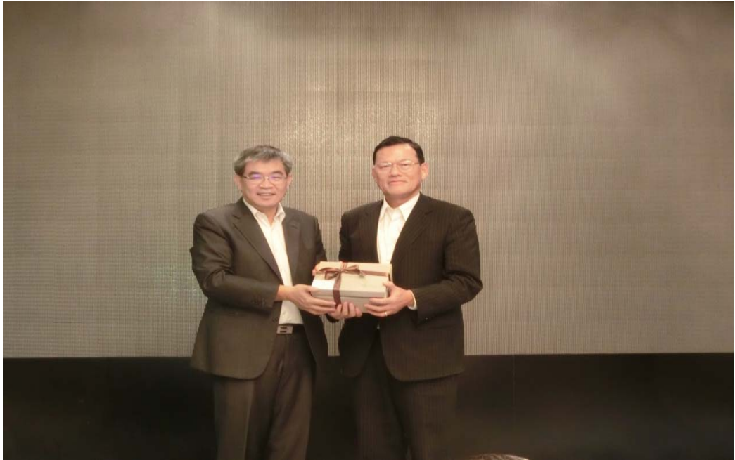
蔡政務次長（左）致贈駐馬來西亞代表處章大使計平紀念品