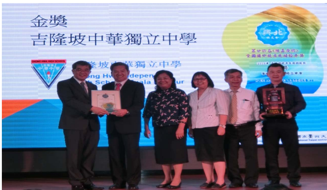
蔡政務次長（左一）與馬來西亞獨立中學獲獎師長合影留念

本次 7 月 8 日午宴由教育組朱組長及白秘書陪同蔡政務次長、國際司楊敏玲司長及畢祖安教育副參事出席，主賓係立法院蔡副院長其昌兼我國中興大學校友總會理事長，現場嘉賓包括僑務委員會張良民主任秘書、章大使計平、留臺聯總余安副會長、國立臺北大學林道通代理校長、李承嘉副校長、國立中興大學薛富盛校長、多位留臺校友及獨立中學師長。