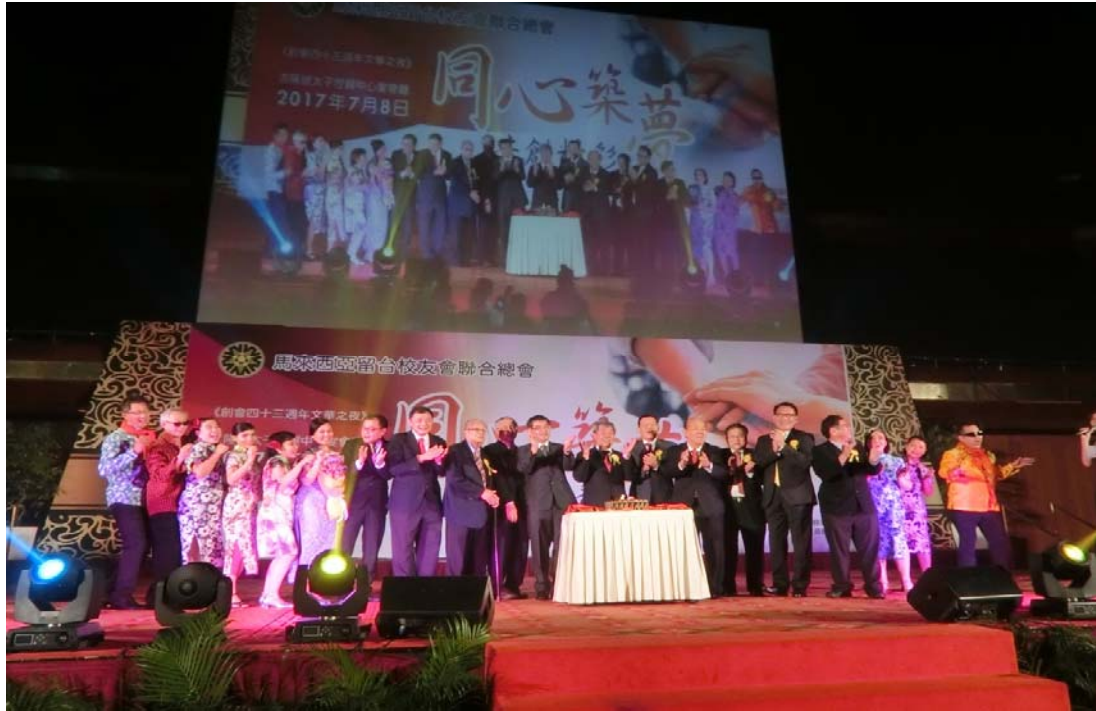
(桌後左一) 蔡政務次長與留臺聯總陳治光會長 (桌後左二)、章計平大使 (桌後左三)、留臺聯總永久名譽會長丹斯里吳德芳 (桌後左四) 共同慶祝「留臺聯總創會 43 週年文華之夜」