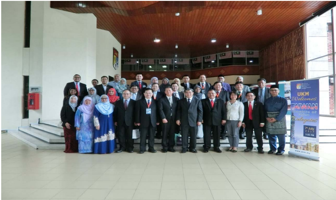
蔡政務次長（前排右五）與馬來西亞國立大學校長拿督斯里阿茲蘭教授博士（前排右四）、各學院代表，及我國出席交流座談之大學校長、副校長合影留念