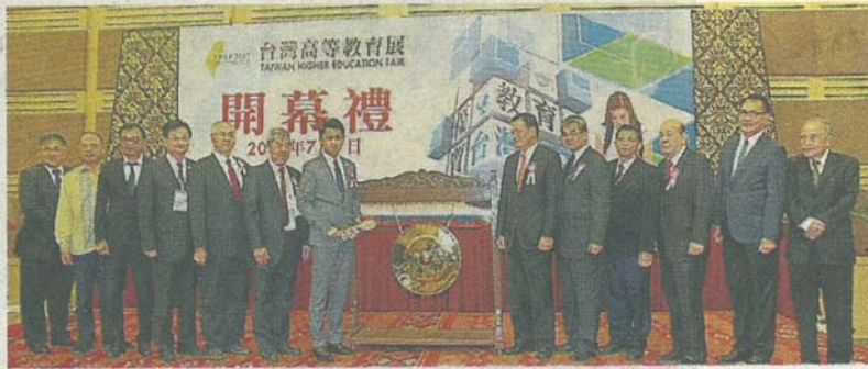
張盛聞（中）主持“2017年台灣高等教育展”開幕禮鳴鑼儀式。左起為韓保定、劉天吉、方俊能、蘇玉龍、張良民和陳治光；右起為賴觀福、李子松、吳德芳、洪進興、蔡清華和章計平。

（吉隆坡7日訊）教育部副部長拿督張盛聞指出，教育部非常重視技職教育能為國家未來經濟發展作出的貢獻，但該部目前