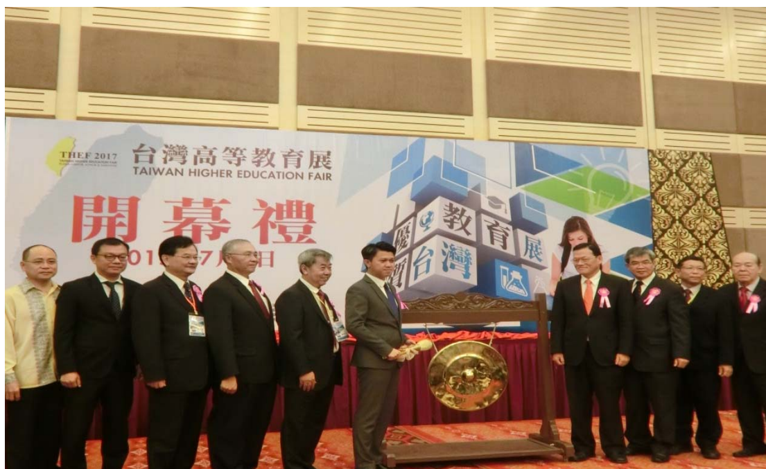
右起：留臺聯總永久名譽會長丹斯里吳德芳先生、留臺聯總署洪進興理會長、教育部蔡清華政務次長、駐馬來西亞臺北經濟文化辦事處章計平大使、馬來西亞教育部副部長拿督張盛聞上議員、留臺聯總陳治光會長、僑務委員會張良民主任秘書、海外聯合招生委員會蘇玉龍校長、留臺聯總方俊能顧問與劉天吉顧問共同主持開幕儀式