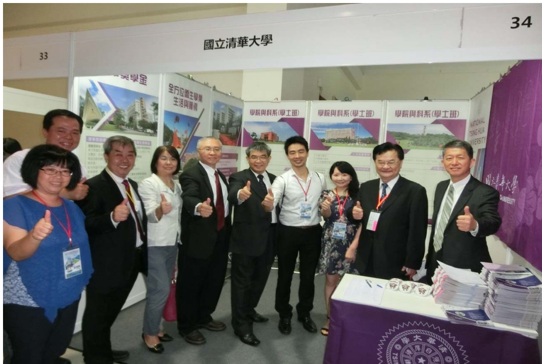
蔡政務次長一行及留臺聯總幹部與大專校院參展師長合影