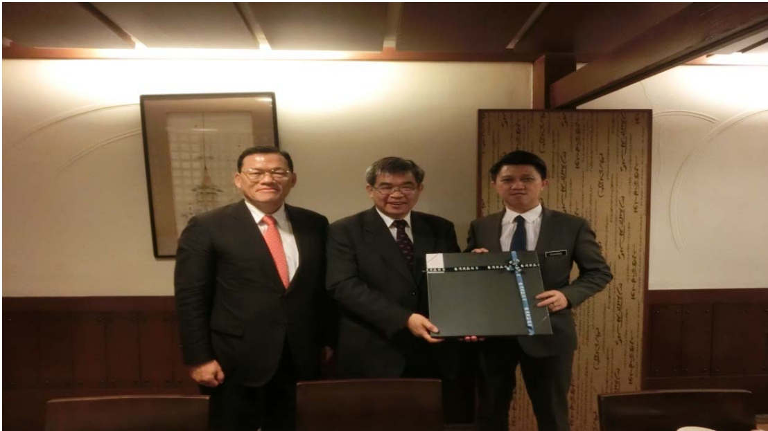
蔡政務次長（中）致贈馬來西亞教育部張盛聞副部長（右）紀念品，左為章計平大使

本次餐敘馬國除張副部長外，張副部長機要秘書曾繁翀亦陪同與會。蔡政務次長與張副部長對技職教育、客家文化議題相談甚歡，餐敘進行一個多小時後，蔡政務次長致贈張副部長紀念品並合影留念。