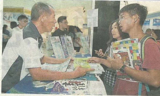
台湾大学代表耐心回答学生问题，并提供详细的书面资料。