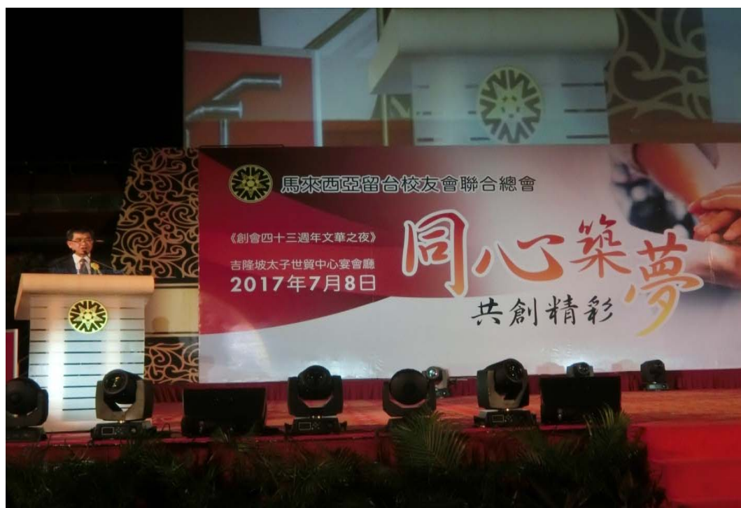
蔡政務次長應邀於留臺聯總創會 43 週年文華之夜致詞

教育部對於馬來西亞華社積極為學生提供優質教育的精神感到欽佩，也希望能為獨中教師師資不足的問題盡一份心力，因此著手進行試辦選送臺灣數理化教師至獨中任教計畫，已於 106 年 7 月上旬公告受理申請，未來也將研擬相關精進方案，因應獨中教師需求，選送優秀臺灣教師赴馬來西亞任教。另一方面，教育部也增加給馬來西亞學生的獎學金名額，現在推動的「臺灣獎學金」鼓勵馬來西亞學生赴臺修讀學位課程，106 學年度起從 20 名增加至 35 名，希望讓更多有志赴臺深造的學生在經濟上無後顧之憂。活動於晚間 10 時 30 分左右圓滿落幕。