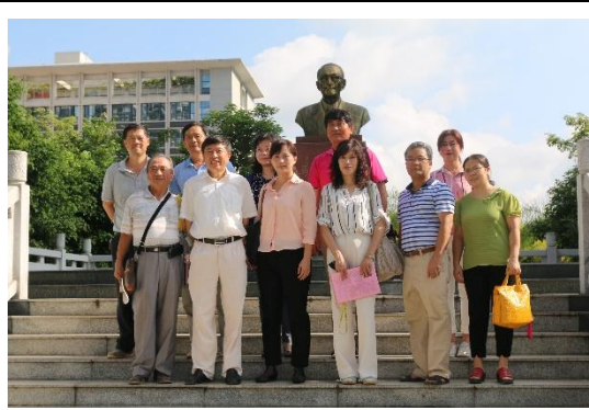
與農科院同仁於馬保之銅像前合影