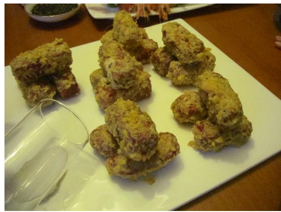
紅龍果風味料理-紅心炸彈