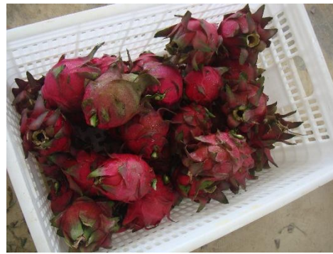
為延長樹架壽命，果實常未完全轉色前即行採收