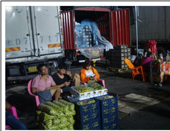
於貨櫃前展售其果品尋找買主的產地 批發方式