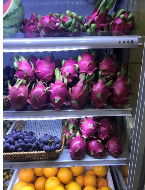
冷藏櫃內的紅龍果為越南進口，鮮度與賣相均佳，售價也較高(廣州)