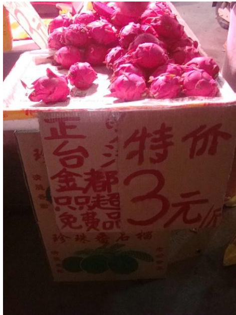
南寧陳東市場類似黃昏市場，紅龍果售價較為低廉(南寧)