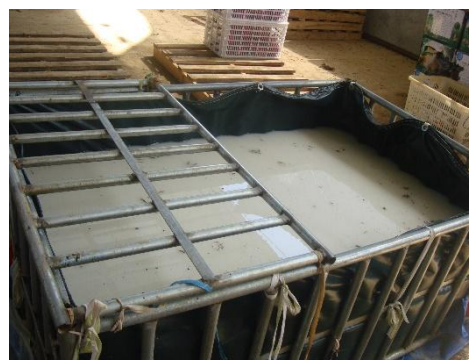
果實採收後先進行殺菌與保鮮處理，風乾後再進行包裝作業