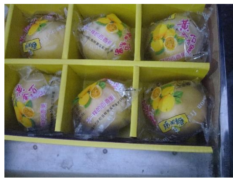
各式包裝精美的零售果品，多為進口