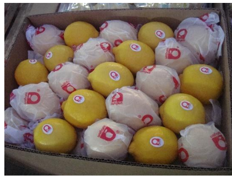
於洋貨批發區將拍賣後的商品於市場 外圍進行零售，零售的商品其包裝樣式 較為精美