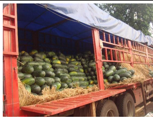
來自各省的貨櫃車於批發市場進行議 價販售，租金以車位/日計價