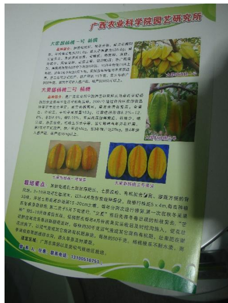
農科院選育之楊桃品種