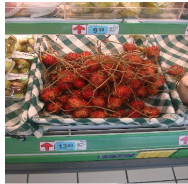
紅毛丹於市場上的價位頗高