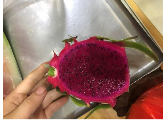
越南產的紅龍果果皮厚，風味平淡(廣州)