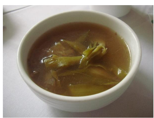
紅龍果花苞煲湯料理