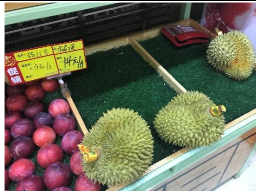
榴槿於當地市場上的價位頗高