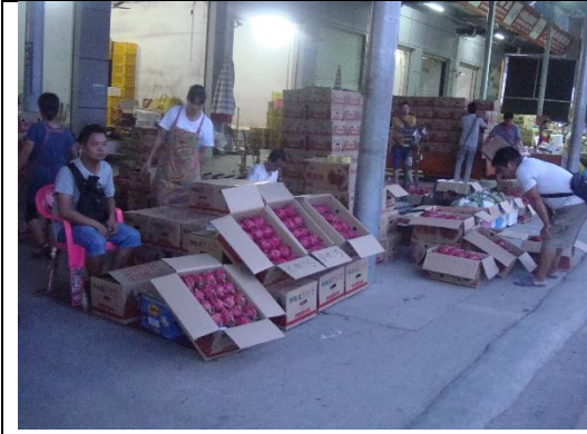
紅龍果包裝與批貨販售情形