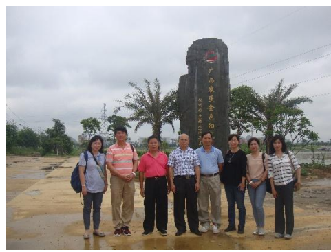
參訪人員與金光農場場主合影