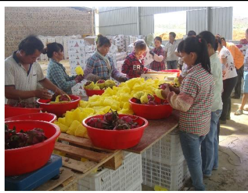
重量分級後逐果進行蔬果套包裝