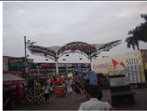
進口果品拍賣專區，進出口嚴格管制 並禁止攝影