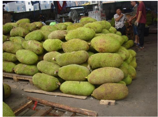
市場依果品種類分為不同的拍賣專 區，分類清楚便於採購