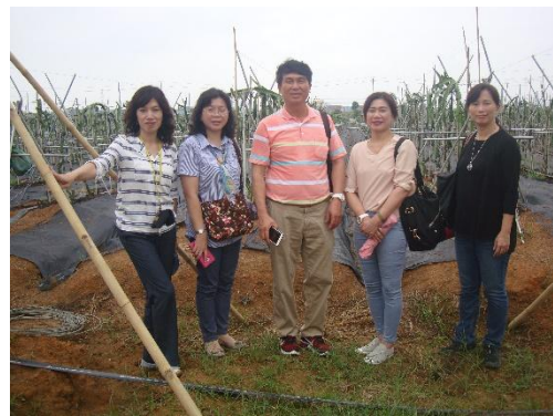
參訪人員於紅龍果基地前合影