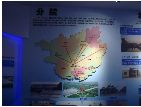
廣西農科院試驗基地與據點