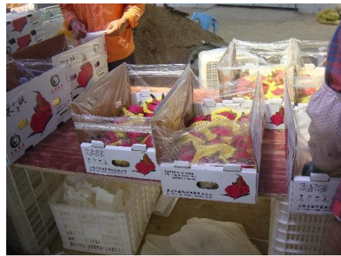
出貨至北京市場的高檔貨其包裝方式