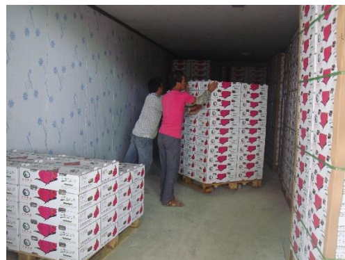
包裝完成後進行室內預冷等待出貨的情形