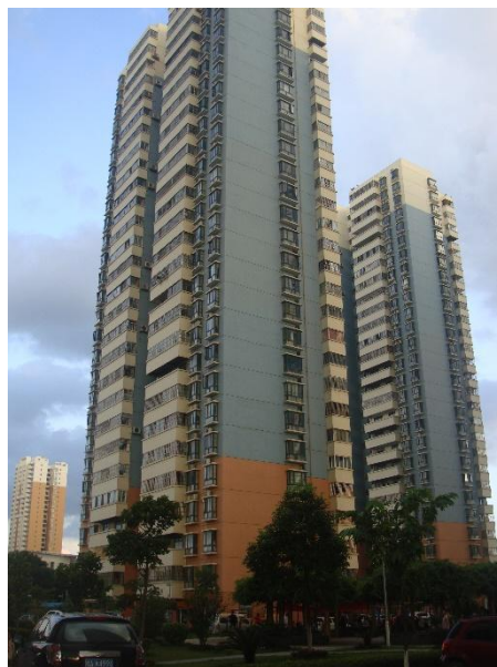
農院所配置之員工住宅