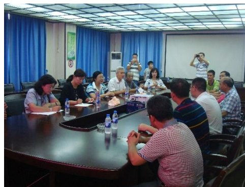
參訪人員與金光農場人員進行會談