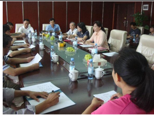
與園藝研究所果樹研究人員進行產業交流