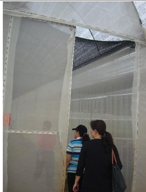
百香果苗病毒檢疫網室