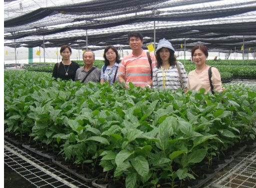
參訪人員於百香果苗生產基地前合影