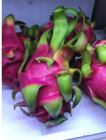
冷藏櫃的越南進口紅肉種紅龍果外觀似白肉種(廣州)