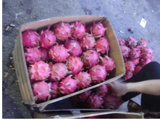
市場上仍可見到潰瘍病斑嚴重的果品