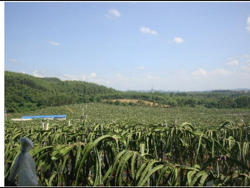
綿延不絕的種植基地，本區廣達 60 公頃