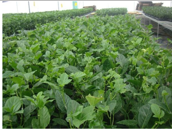
嫁後成活後等待出貨之百香果苗