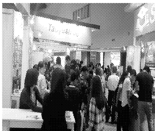
展覽期間人潮眾多