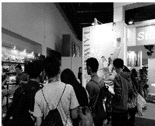
觀展學生將本會攤位包圍