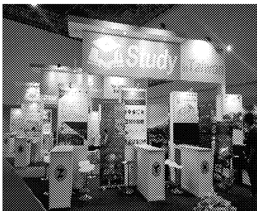
人才教育區攤位實況