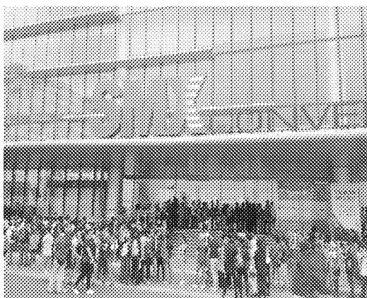
展覽會場外觀展民眾大排長龍