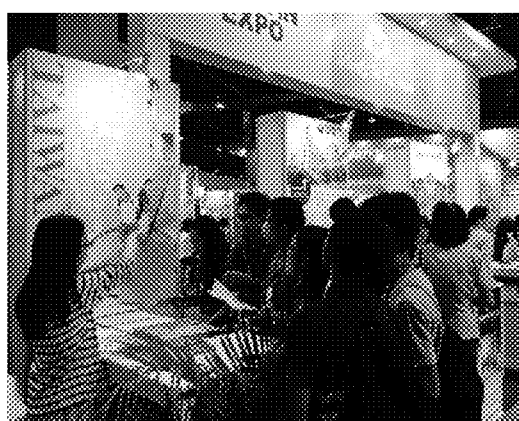
本會人員向觀展學生說明申請相關手續