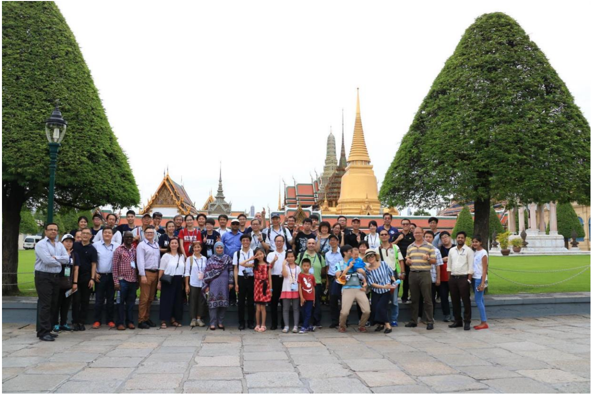
圖 5：與各國學者參觀泰國皇宮