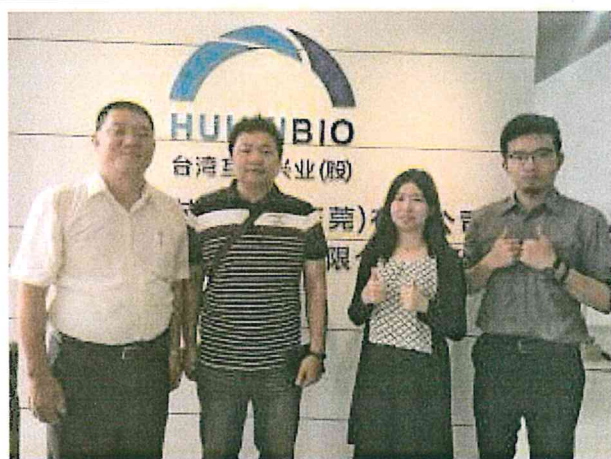
與東莞映○貿易有限公司人員合影