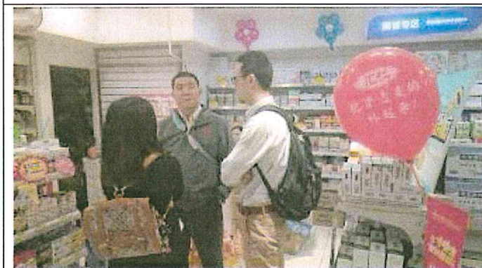
重慶市渝中區和平藥房