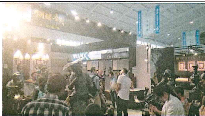
2017 南亞博覽會-台灣館展場