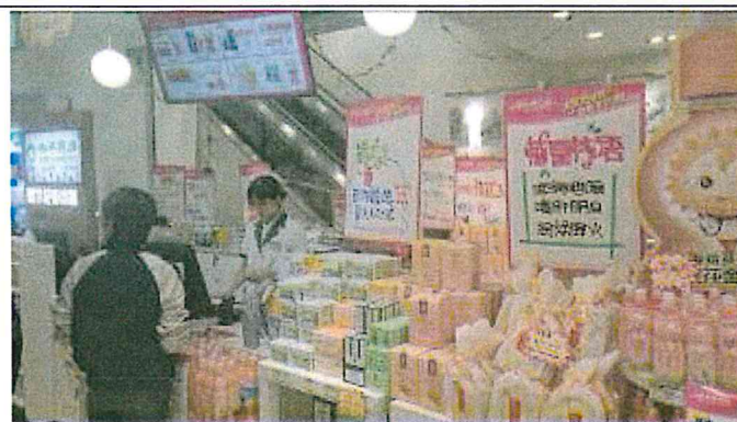
重慶市江北區和平藥房旗艦店 1樓收銀台