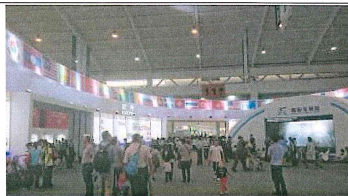
2017 南亞博覽會-國際友誼館