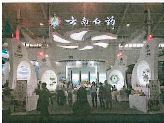
2017 南亞博覽會-雲南白藥展場