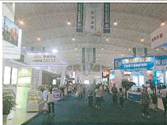
2017 南亞博覽會-製造業館