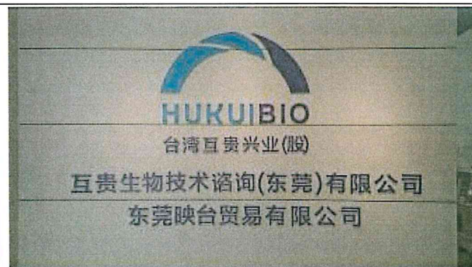
東莞映○貿易有限公司辦公室入口