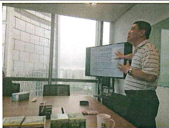
台糖生技實施產品教育訓練