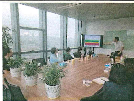
台糖生技實施產品教育訓練