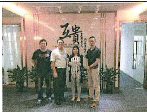
與重慶台信○公司幹部合影