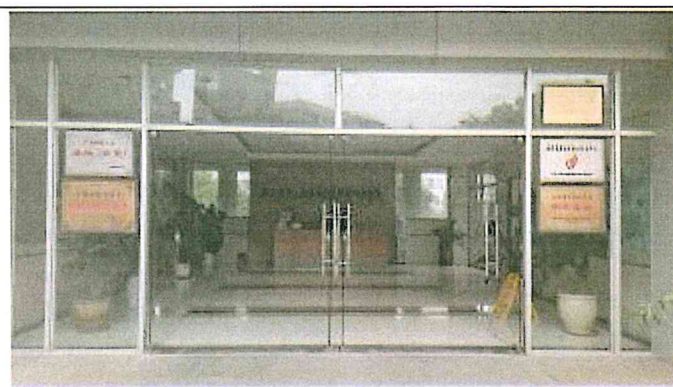
東莞映○貿易有限公司所在大樓大門