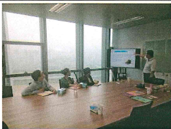
台糖生技實施產品教育訓練