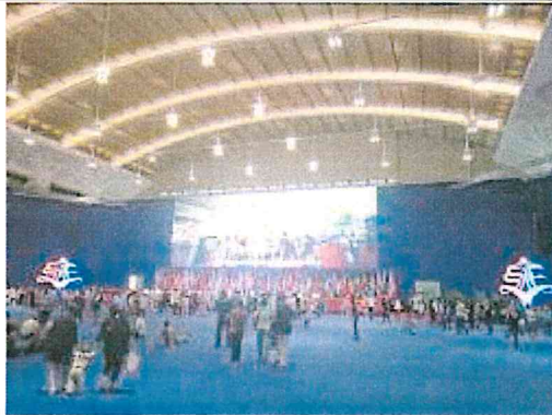
2017 南亞博覽會-開幕大廳