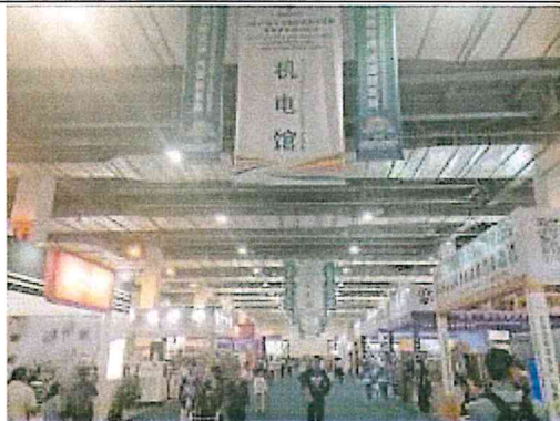
2017 南亞博覽會-機電館