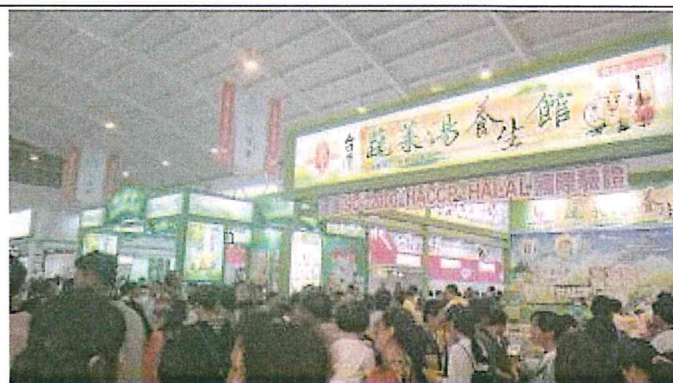
2017 南亞博覽會-台灣館展場