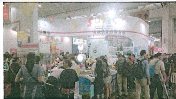
2017 南亞博覽會-台灣館展場