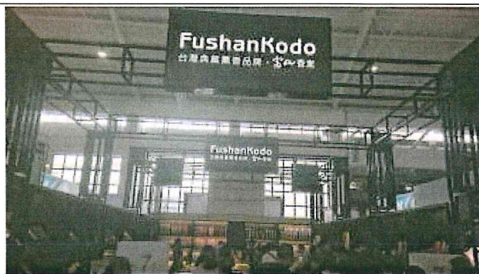
2017 南亞博覽會-台灣館展場