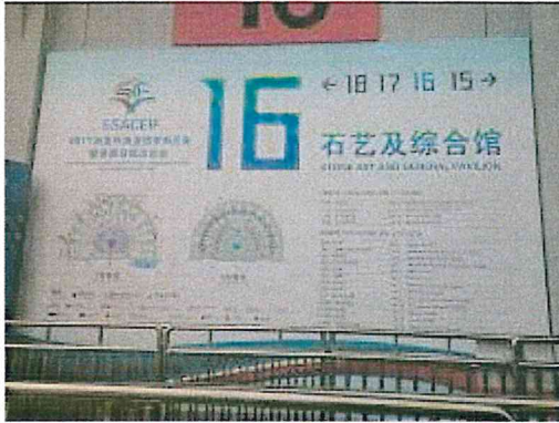
2017 南亞博覽會-入口處