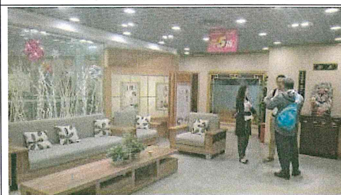
重慶市江北區和平藥房旗艦店 3樓理療部