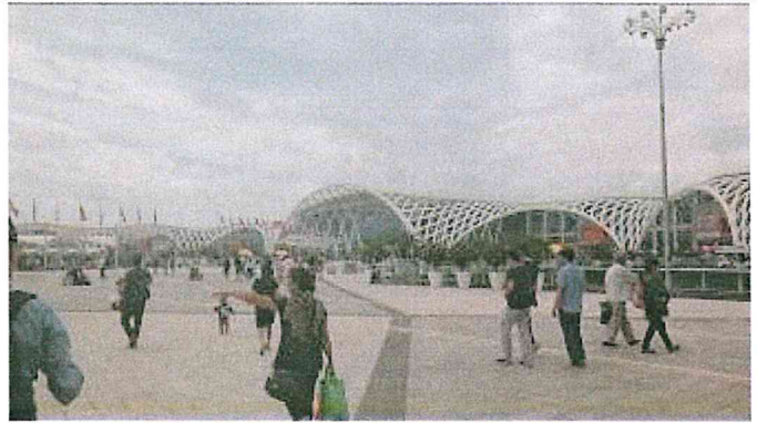
雲南昆明滇池國際會展中心