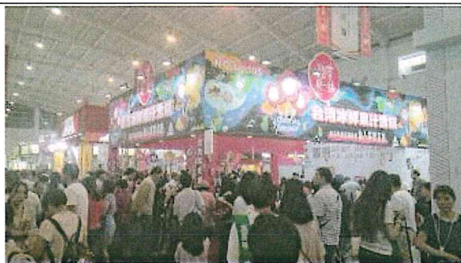
2017 南亞博覽會-台灣館展場