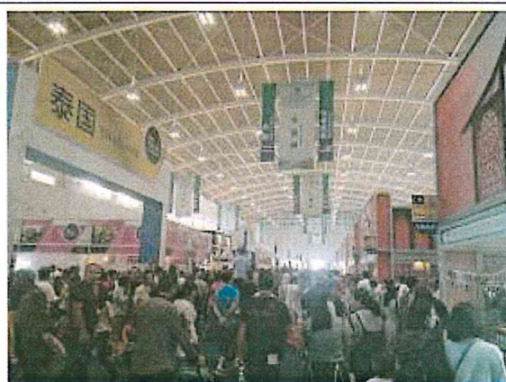
2017 南亞博覽會-東盟館