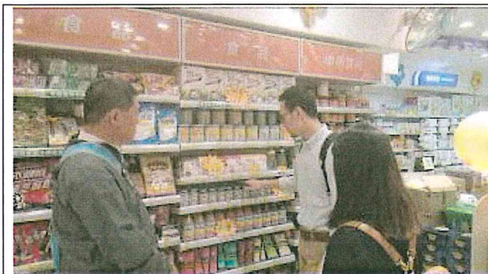
重慶市渝中區和平藥房