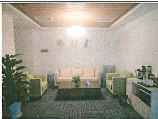
重慶台信○公司辦公室