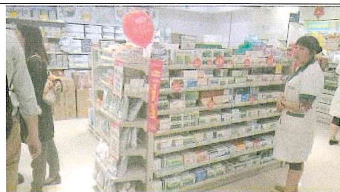
重慶市渝中區和平藥房