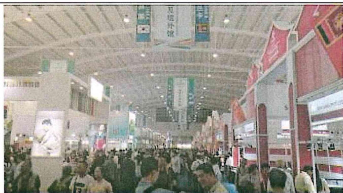
2017 南亞博覽會-南亞及境外館