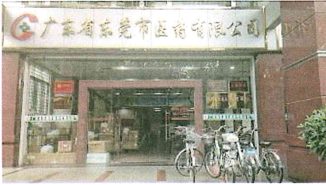
廣東省東莞市醫藥有限公司大門口