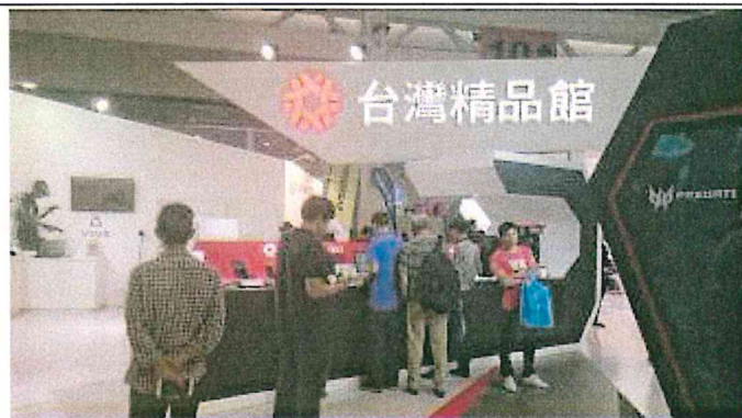
2017 南亞博覽會-台灣精品館