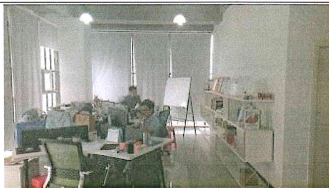
東莞映○貿易有限公司辦公室