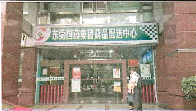
東莞國藥集團藥品配送中心大門口