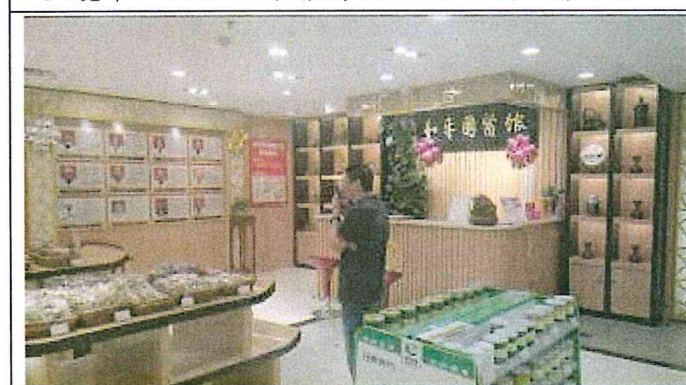
重慶市江北區和平藥房旗艦店 3樓中醫部