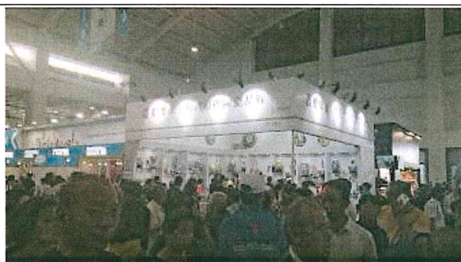
2017 南亞博覽會-台灣館展場