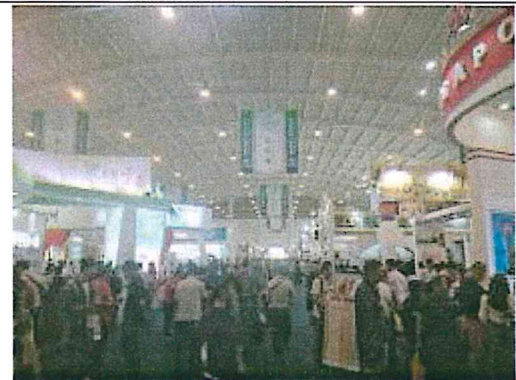
2017 南亞博覽會-旅遊館