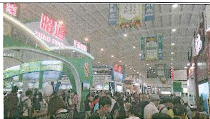
2017 南亞博覽會-中國國內館