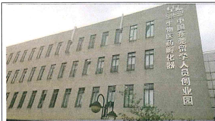
東莞映○貿易有限公司所在大樓