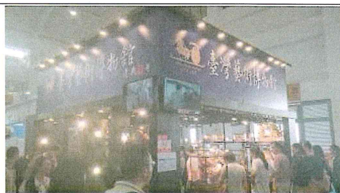
2017 南亞博覽會-台灣館展場