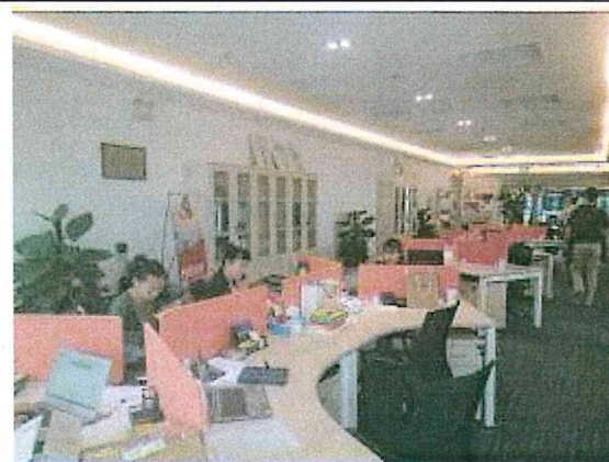
重慶台信○公司辦公室