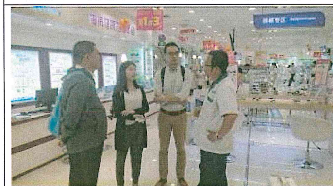
重慶市江北區和平藥房旗艦店 2樓醫療器材區