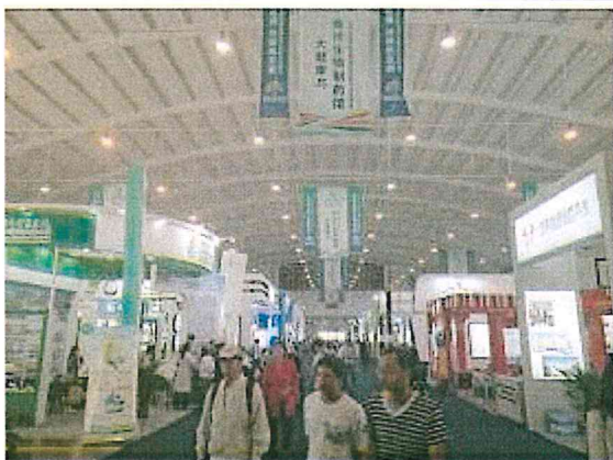
2017 南亞博覽會-大健康與海洋生物製藥館