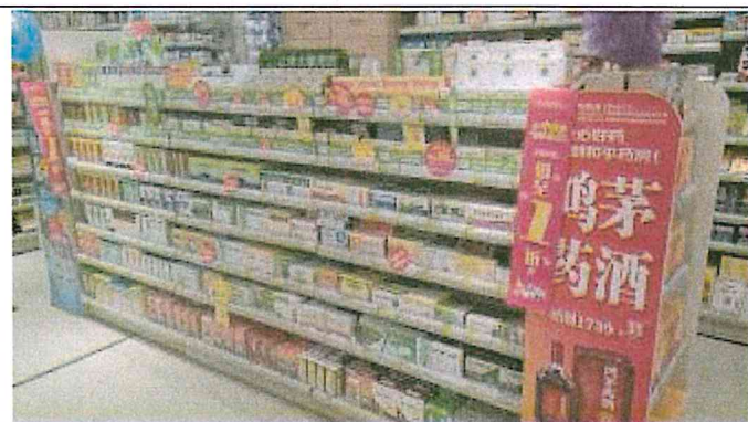
重慶市渝中區和平藥房