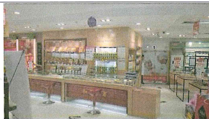
重慶市江北區和平藥房旗艦店 1樓中藥區