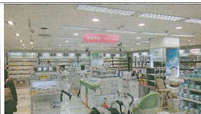
重慶市江北區和平藥房旗艦店 2樓