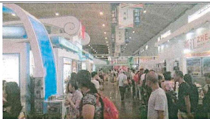
2017 南亞博覽會-中國國內館