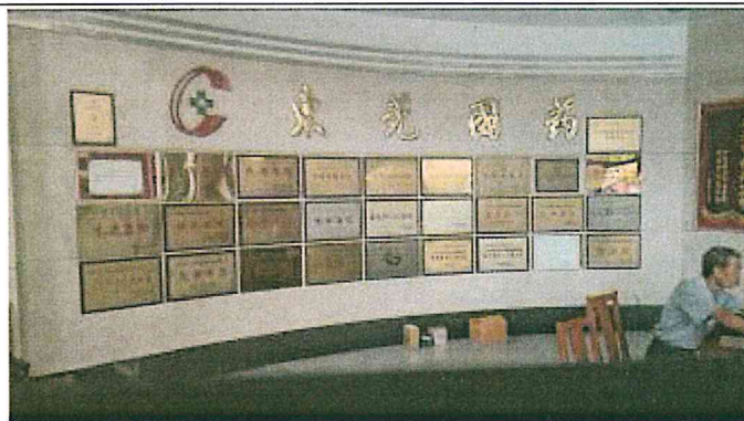
東莞國藥集團總部大廳