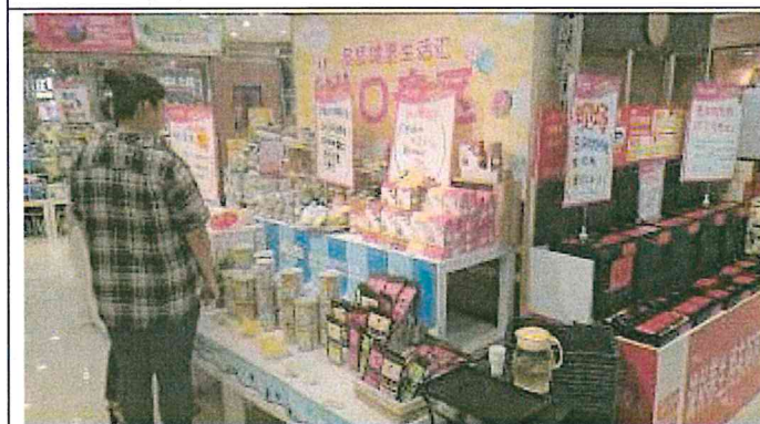
重慶市江北區和平藥房旗艦店 1樓促銷專區