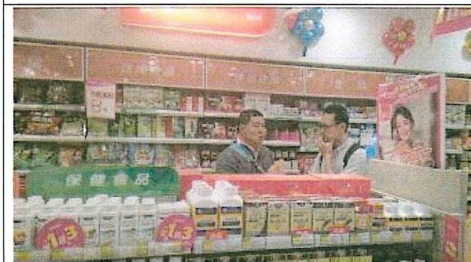
重慶市渝中區和平藥房