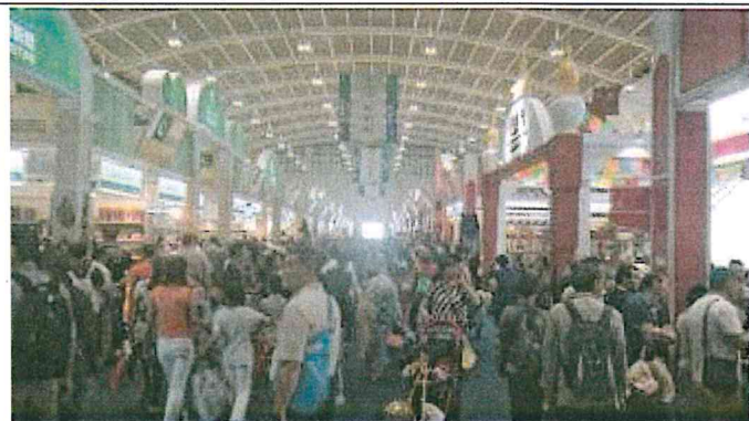
2017 南亞博覽會-南亞館