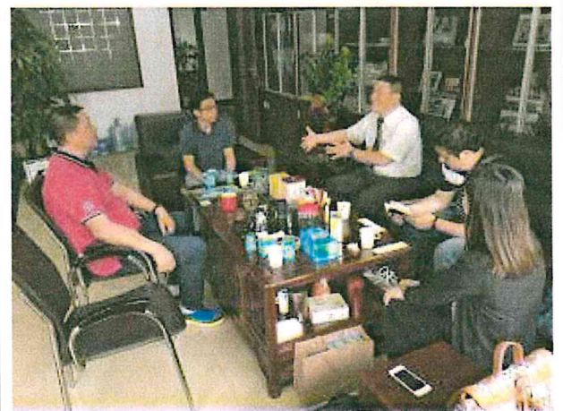
與東莞國藥集團人員會商