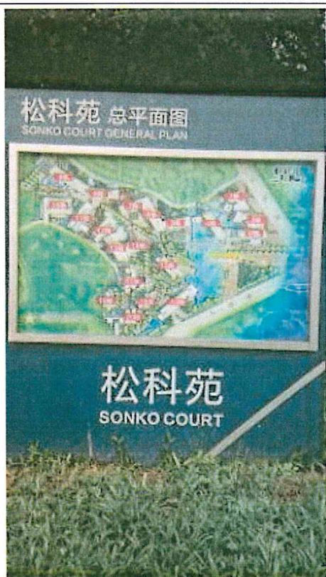
東莞映○貿易有限公司所在園區平面圖