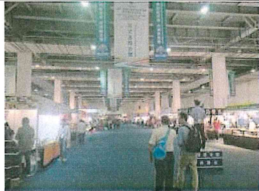
2017 南亞博覽會-石藝及綜合館