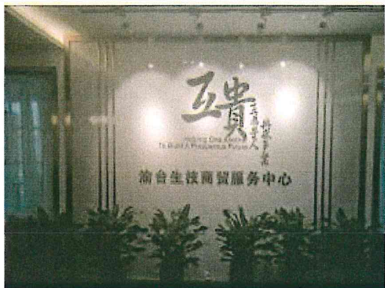
重慶台信○公司入口處