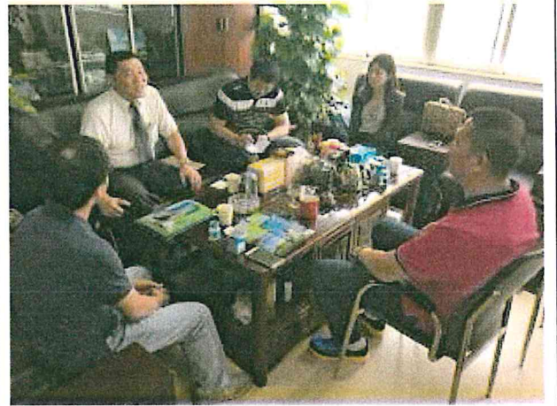
與東莞國藥集團人員會商