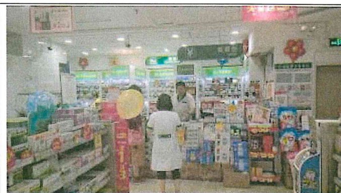
重慶市渝中區和平藥房