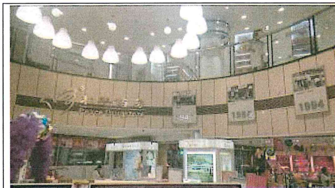
重慶市江北區和平藥房旗艦店 1樓大廳