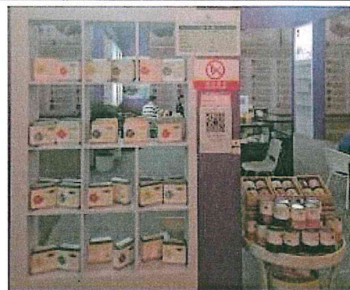
2017 南亞博覽會-展售黑糖產品