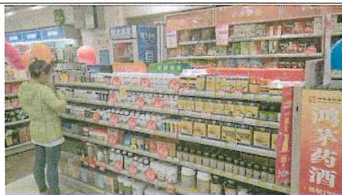
重慶市渝中區和平藥房