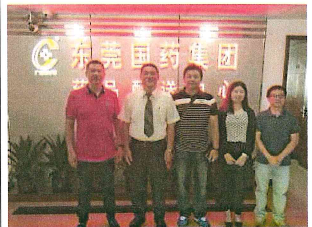
與東莞國藥集團人員合影