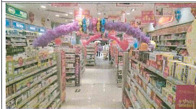
重慶市渝中區和平藥房