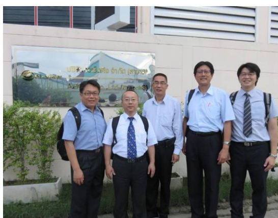
AzkinG Company 參訪合影