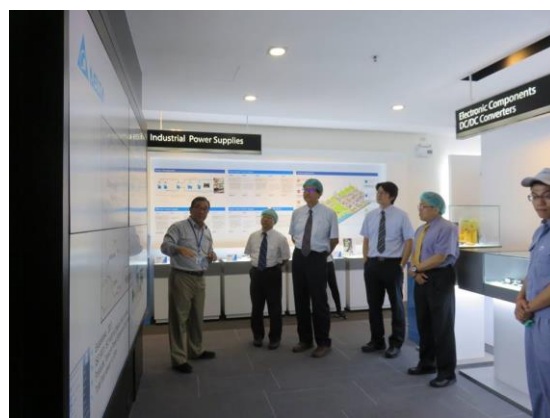
Delta Electronics (Thailand) Public Company 企業交流剪影