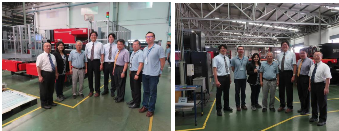
Jinpao Precision Industry Company 企業交流剪影