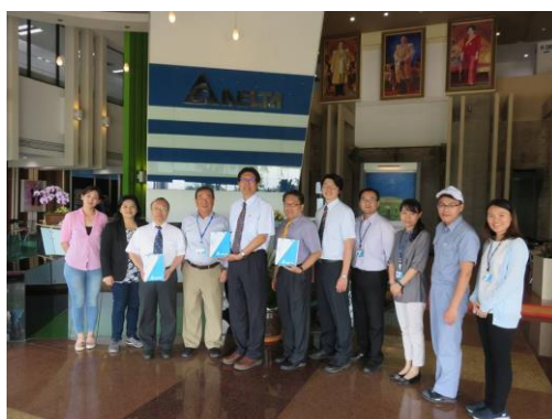
Delta Electronics (Thailand) Public Company 參訪合影