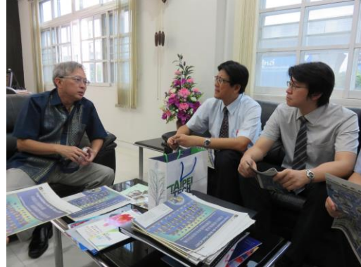
Wells International School 學校交流剪影