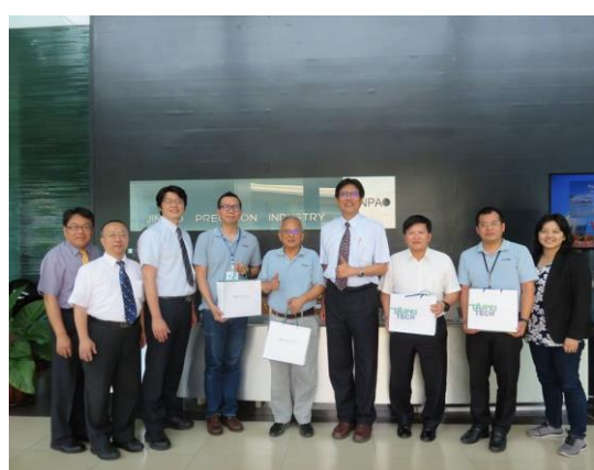
Jinpao Precision Industry Company 參訪合影