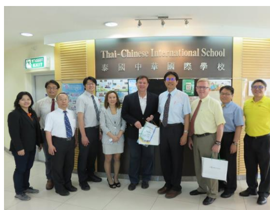
Thai Chinese International School 參訪合影