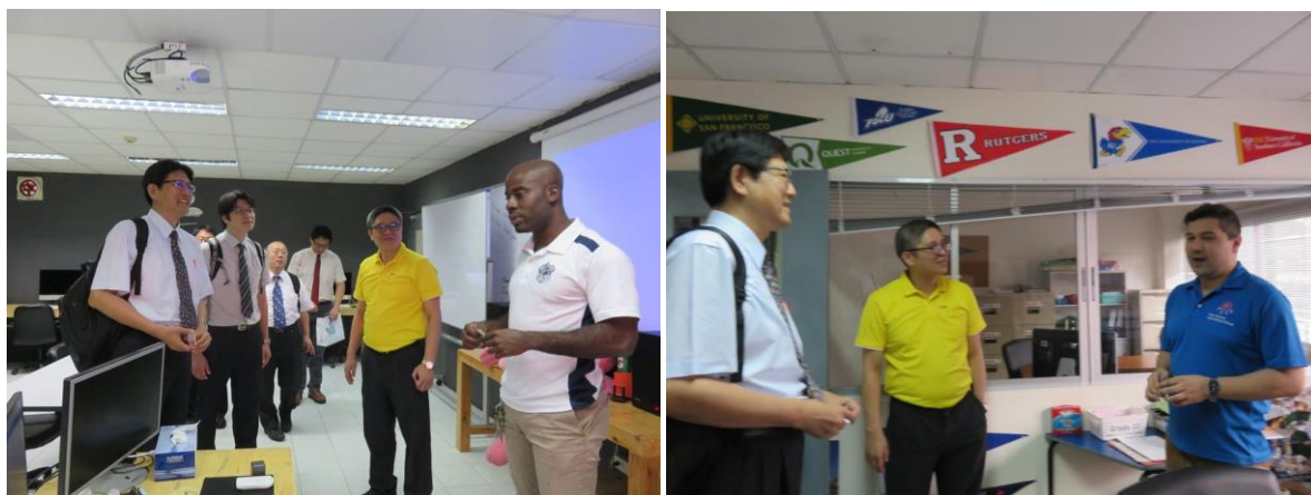
Thai Chinese International School 交流剪影