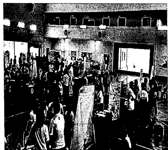
於利豐港辦理招生宣導說明會實況