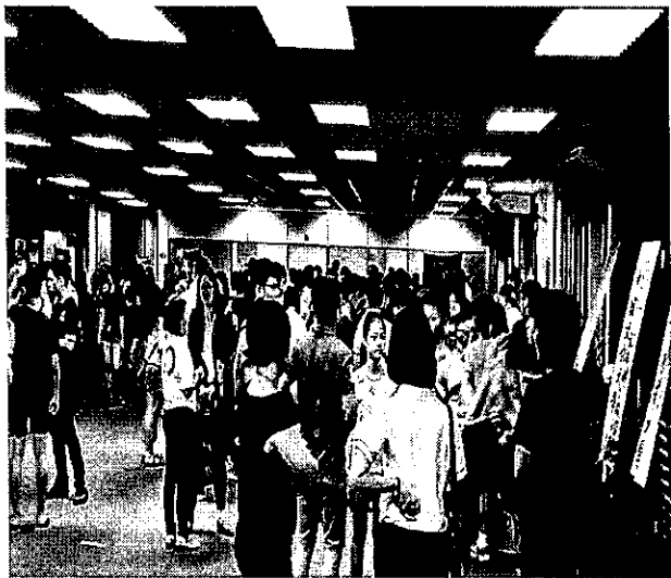
於峇株辦理招生宣導說明會實況