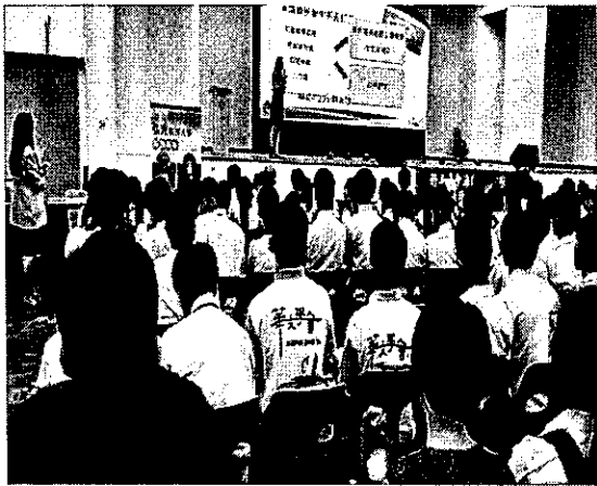
於巴生辦理招生宣導說明會實況