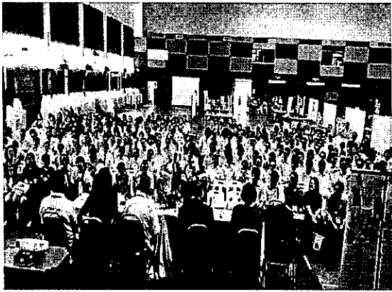
於亞羅士辦理招生宣導說明會實況