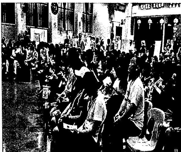
於馬六甲辦理招生宣導說明會實況