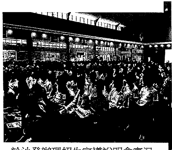
於沙登辦理招生宣導說明會實況