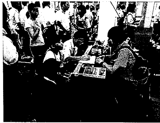
於檳城辦理招生宣導說明會實況