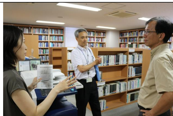
參觀智慧財產權研究所的圖書館