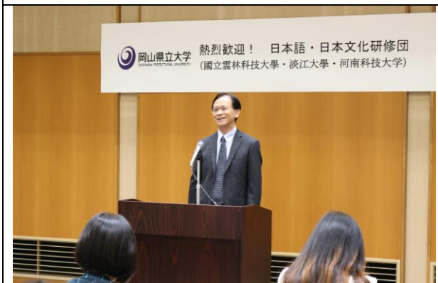
蘇副校長於研習營開幕式中致詞