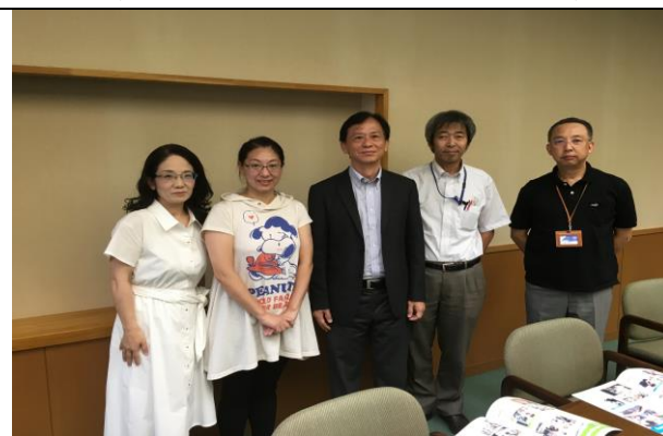
與三個學院院長會談後合影