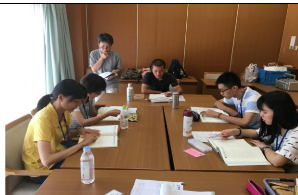
本校學生於研習營中上課情形