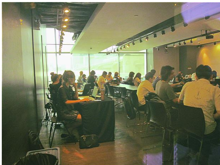
圖 15 泰國新創環境相對成熟，但現階段較適合以消費性市場為目標的實務型創業

創新為導向之高端科技型創業並不相同。此外，鑒於東協市場在地化的重要性，台灣新創團隊赴泰國或東南亞發展，應可借重當地台商組織，或結合當地夠份量且各方關係良好之台商，共同發展。