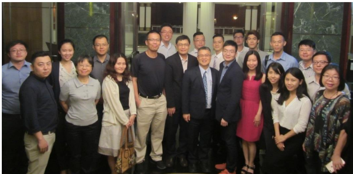
圖 2 越南台灣商會聯合總會為越南最大的外國商會組織，深為越南及台灣兩國政府所器重

在越台商產品遇有技術問題，無法突破，希望能與台灣研究機構合作研究。如目前冷凍機與冷鏈發展上，部分關鍵技術問題無法解決，亟需國內專業單位協助。