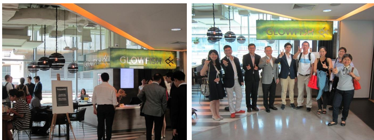
圖 5 & 6 曼谷 Glowfish 新創中心設計新潮明亮，吸引新創團隊使用其共同工作空間

Glowfish 為一民間經營的新創共同工作空間 (co-working space)，在曼谷鬧區有兩處據點，提供工作及會議空間，位於 Asoke Tower 的據點佔地兩層，大小辦公室將近 40 間，位於 Siam Square 的據點，規模較小，佔地約 900 平方公尺，4 樓為咖啡廳與餐廳，5 樓全部為共同工作空間，共有 26 間辦公室。標榜「工作、嬉戲、成長」(WORK. PLAY. GROW.) 的 Glowfish，設計明亮新潮，工作空間中設有咖啡廳、健身房等休憩設施，供進駐團隊使用，此外也舉辦新創活動及 workshop，但沒有育成計畫。擁有華裔血統的經營者 Gavin Vongkusolkit 本業為地產生意，其家族經營糖業、生質能源等大宗物資買賣，在泰國商界頗具實力。Gavin 歡迎台