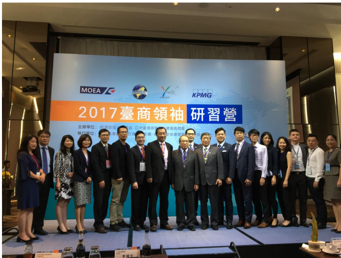
圖 13 籌辦「2017 臺商領袖研習營」，亞青成員展現十足向心力與組織動員能力