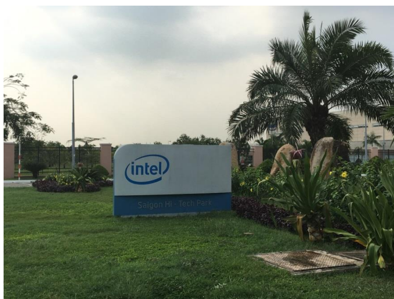
圖 4 西貢矽谷城區內規劃類似我國科學園區

2016 年 5 月啟動,位於胡志明市市郊,行程中特地安排驅車繞行矽谷城。區內規劃類似我國科學園區,有英特爾、三星等國際大廠進駐,但據亞青成員告知,區內工廠仍是以硬體代工為主,且無科技新創公司進駐。