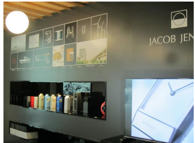
圖 9&10 曼谷 KX 新創聚落，進駐團隊多元，丹麥設計公司也在此設點