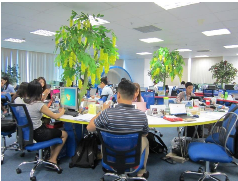
圖 3 效法 Google,進行辦公室綠化的 CMC SISG，為越南排名第二的雲端伺服器整體解決方案公司

擁有 20 年歷史，主要提供雲端伺服器的整體解決方案的 CMC SISG 公司，年營業額 6500 萬美元，員工 250 人，在越南同類型公司中排名第二。該公司以內銷為主，胡志明市金融業的資訊系統為其主要標的。員工多為軟體工程師，除越南本土工程師（薪資約