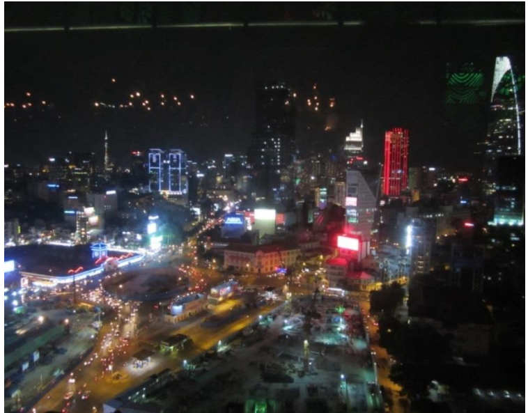
圖 14 越南內需市場蓬勃，百姓所得不高，但消費力強，且崇尚名牌高檔商品

提供 500 億元信用保證額度，全力協助我國企業前進新南向市場。此外，經濟部針對海外台商所提供之企業諮詢診斷服務，應可協調國內研發機構，提供研發協助。