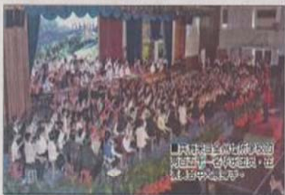
「百人華樂匯流演奏會」由育源中學主辦。

（本報山打根四日訊）山打根育源中學配合第十一屆沙巴華樂節，於今日下午二時成功舉辦「百人華樂匯流演奏會」，獲眾多市民踴躍參與，場面殊盛。