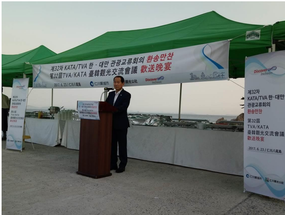
於仁川八尾島辦理歡送晚宴