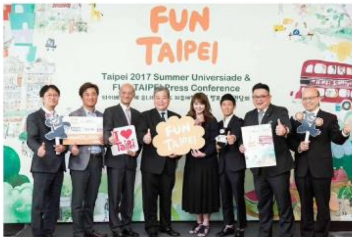
이데일리 광경록 기자] "올 한해 200만명이 넘는 관광객이 한국과 대만을 서로 오갈 것이다"

간여한 대만 타이베이시 관광홍보국 국장은 지난 22일 서울 중구 더 플라자호텔에서 열린 '2017 편 타이베이' 자유여행 상품 설명회에서 이같이 예상했다. 이날 간담회는 오는 8월 개최 예정인 '2017 타이베이 하계유니버시아드 대회'를 기념해 한국인 관광객의 타이베이 자유여행을 독려하기 위해 마련했다. 이날 행사에는 간여한 국장을 비롯해 유희림 대만관광국 부국장, 석정 주한 타이베이 대표부, 오호수 중화항공 한국지사 차사장 등이 참석했다.