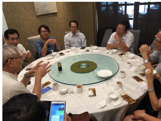
▼6月13日(二) 吉隆坡-下午，拜訪巴生-雪蘭莪金門會館