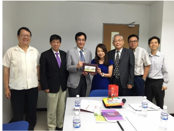
▼6月12日(一) 檳城-中午，與拉曼大學學院、中學校長進行交流