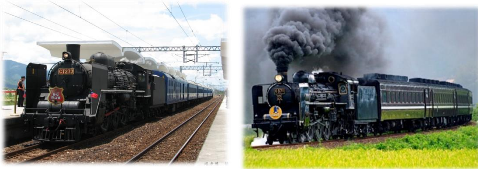
圖 25 臺鐵 CT273 蒸汽機車與 JR 西日本旅客鐵道山口號蒸汽機車

2014 年起每年 6~8 月臺鐵在臺灣東部的玉里、台東間開行 CT273 仲夏寶島號。今(2017)年 6 月 24 日姊妹車第二彈，由臺鐵 CT273 蒸汽機車與 JR 西日本旅客鐵道山口號蒸汽機車進行締結。