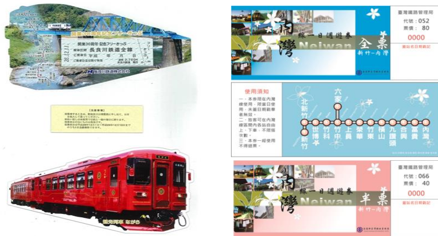
圖 20 內灣線及越美南線一日券

內灣線與長良川鐵道在 2015 年 9 月 4 日簽署合作備忘錄及締結為姊妹鐵道。2015 年 9 月 4 日起至 2018 年 12 月 31 日止無償兌換雙方一日週遊券。旅客持臺鐵局發行之「內灣線一日週遊券」得至日本長良川越美南線無償兌換當日使用之「越美南線一日乘車券」。外國旅客持有長良川鐵道越美南線一日乘車券至臺鐵台北、新竹等站亦可無償兌換「內灣線一日週遊券」。