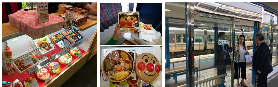
圖 8 麵包超人便當及車站候車室

配合麵包超人列車推出一系列的麵包超人便當、周邊商品，吸引大小朋友的目光。另在開放式的月台上貼心設計玻璃帷幕的候車空間，讓旅客在等車時冬暖夏涼，用心款待每一位乘車者。