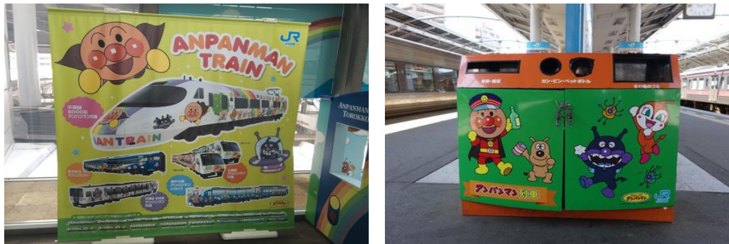
圖 4 車站內麵包超人列車的文宣及廣告

車站內到處充滿麵包超人設計元素，包含垃圾桶、牆面海報文宣等，甚至發行麵包超人列車護照，裡面除路線解說、開行班次表外，還設計一系列各車站集章的蓋章處。