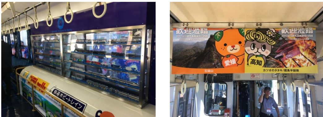
圖 31 善用車廂內空間進行行銷

行銷概念建立在雙方交易活動產生的目的，企業主如何提供滿足消費者需求的產品，並讓該產品在消費者心留下印象，均須透過整合性的系列行銷策略。