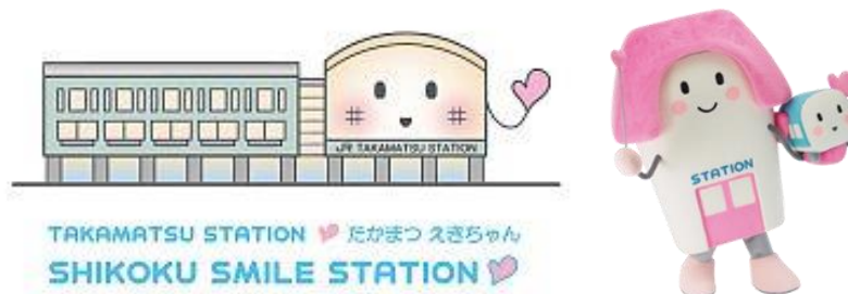
圖 2 微笑車站吉祥物「SHIKOKU SMILE STATION」