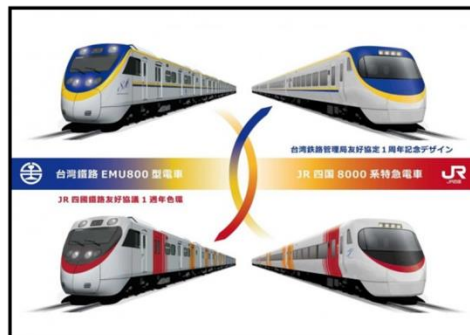
圖 15 臺鐵 800 型區間車與 JR 四國 8000 系特急電車互換塗裝

JR 四國與臺鐵局今(2017)年簽訂友好鐵路協定，交流內容包含雙方列車交換塗裝運行的活動。