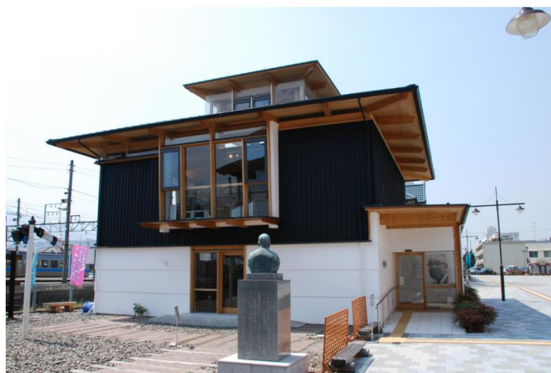
圖 14 十河信二紀念館

為進一步增強運輸能力，國營鐵道內部共識需增設線路、完成廣義的雙複線化的方法。對於增設線路，採取「窄軌複付方式」、「窄軌別線方式」及「標準軌新線方式」。十河從一開始即確信標準軌新線之必要，在了解國營鐵道內部無法做出選擇窄軌或標準軌的結論時，便安排將決定權託給政府，由 1957 年設於運輸省下的國有鐵道幹線調查會解決。這個調查會得出的結論是「以標準軌新線(新幹線)為妥當」，因此開始致力興建新幹線，這是十河在政治上運籌帷幄帶來的成果，在其辭職隔年的 1964 年 10 月 1 日東海道新幹線通車。目前臺灣高鐵也是採用日本新幹線系統。