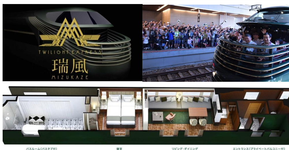
バスルーム(バスタブ付)