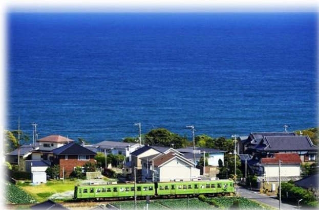
圖 24 銚子電鐵