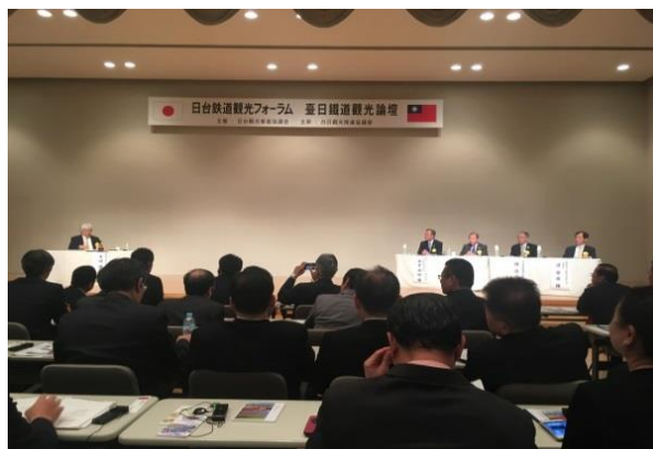
圖 28 臺日鐵道觀光論壇座談情形

臺鐵積極投入國際鐵道交流活動，藉由臺灣與日本在鐵道、人文、風景、交流互動、觀光宣傳等各方面努力，不僅共同增進臺、日間人民的友好關係，同時亦促進雙方鐵道事業永續發展。