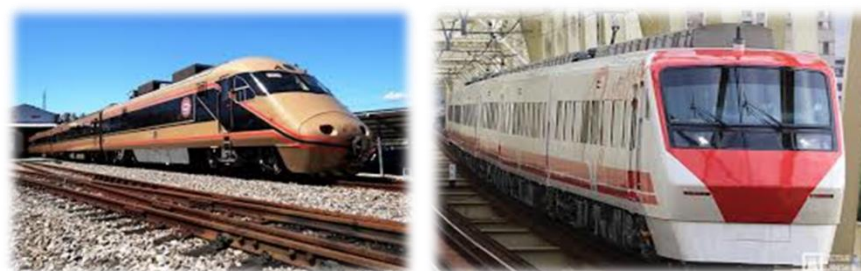
圖 27 臺鐵與東武互換塗裝

最新登場的是今年 6 月 2 日臺鐵局 800 型區間車與 JR 四國 8000 系特急列車互換彩繪塗裝。