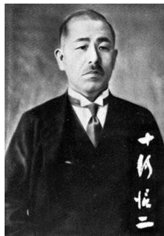
圖 13 十河信二

十河信二(1884年4月14日－1981年10月3日)，日本政治家和鐵路官員、西條市榮譽市民。曾任愛媛縣西條市第二任市長（任期1945年－1946年）、日本國有鐵道第四任總裁（任期1955年－1963年），被譽為「新幹線之父」。