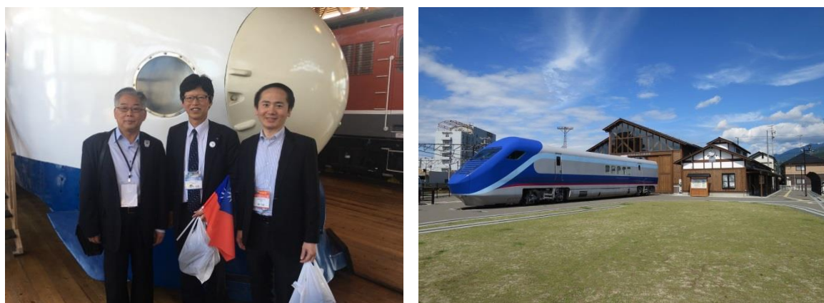
圖 11 西條鐵道歷史園區內展示之車輛

館內展示多台具代表性列車，包含被指定為「準鐵道紀念物」的 DF50 型柴油機車「1 號機」，是日本國內唯一一台可以行駛的展示列車；另有世界各國高速鐵道車輛典範之「0 系新幹線」原型車，可讓訪客坐上駕駛座，操作拉桿、按鈕，親身體驗“駕駛的感覺”。另有為減少新幹線及在來線的轉乘次數，提升便利性而研發的 Free Gauge Train 軌距可變電車之測試列車，該車可配合軌距自動變換車輪間距，目前雖尚在測試階段，但堪稱為軌道運具一重大革命。