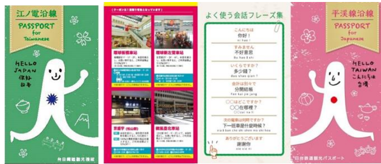
圖 18 臺日鐵道觀光護照