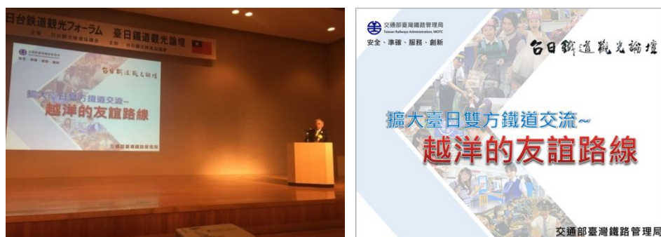
圖 17 本局鐘副局長簡報情形

近年來日本計有 16 家鐵道公司分別與臺鐵局締結友好合作關係，共同推展鐵道觀光旅遊。本次針對擴大臺日雙方鐵道交流、邁向更深遠的臺日鐵道觀光提出專題報告，內容包含近年來臺日間鐵道交流互動情形及對未來的展望。