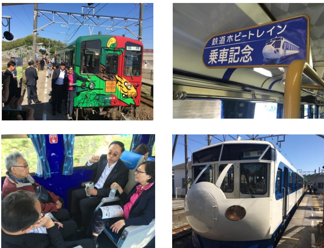
圖 30 JR 四國觀光列車

其中最值得一提的「鐵道 Hobby 列車」，該列車係為慶祝予土線全線開通 40 周年以及宇和島駅～近永駅間開通 100 周年而推出的列車，列車外觀以日本最早的新幹線 0 系為設計造型，號稱是全日本最「慢」的新幹線，鐵道迷也戲稱他為四國的新幹線列車。