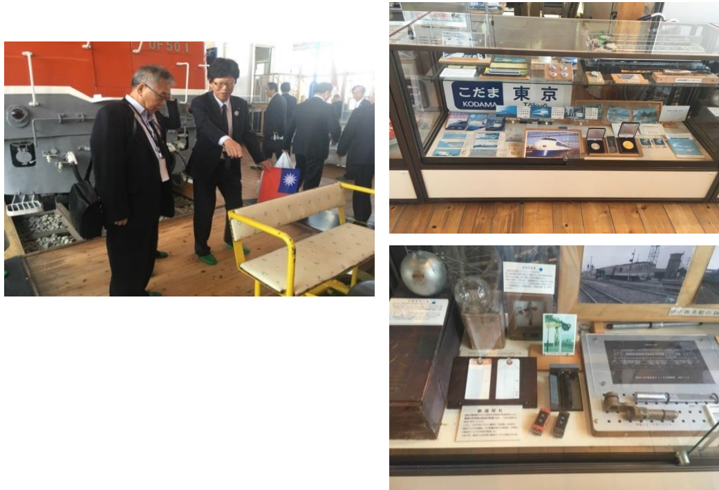
圖 12 西條鐵道歷史園區內展示之鐵道文物

除了車輛外，還包含大型鐵道立體透視模型、集電裝置、懷舊鐵道周邊商品及戶外「迷你 SL」軌道可供訪客乘坐體驗，是座可開心了解四國鐵道的博物館。