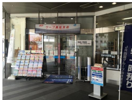
圖 6 旅行業務服務室外觀

因應車站轉運站之角色，車站內旅行業務服務室營業項目相當多元，含括國內外旅行之 JR 票券、觀光巴士、旅館飯店住宿券、飛機票、港口渡輪票、遊樂園門票之販售；汽車、觀光計程車租賃、遊覽車包租及宅配相關寄、取貨服務等 10 大項業務。