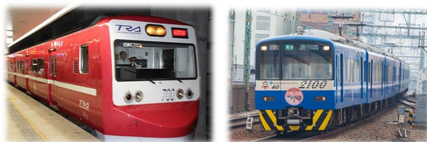
圖 26 臺鐵與京急互換塗裝

另外，臺鐵與日本多家鐵道公司如京急及東武進行互換彩繪塗裝，在臺日兩地都引起廣大的迴響。2016 年 2 月 26 日京急電鐵為了紀念與臺鐵局締結友好協定滿 1 周年，將電車車身塗裝成臺鐵普快車，表達對臺鐵之友好；翌年 5 月 1 日臺鐵將 EMU700 型電聯車塗成京急電鐵經典紅白塗裝列車，此為友好彩繪列車的首發。同年 10 月，東武與臺鐵也互換塗裝。