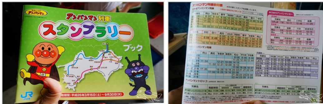
圖 5 麵包超人列車的護照