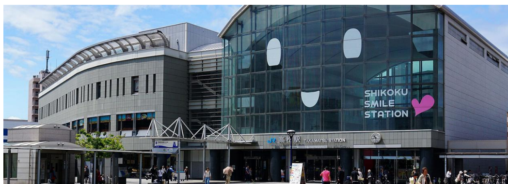
圖 1 高松車站外觀

該站為東至德島、西至松山之中點車站，軌道佈設係以端點站之型態設置，共有 11 條端線分別做為前往德島、松山、岡山等站之列車到開。該站 2001 年建造完成啟用迄今 16 年，2013 年開始以微笑車站吉祥物「SHIKOKU SMILE STATION」作為服務象徵，以「笑容」及「熱誠好客的心」迎接每一位旅客。車站外觀簡潔富現代感，搭配站前周邊其他運輸工具，包括市內公車，長途巴士、港口渡輪、計程車等形成為重要之轉運站，提供各式方便之轉乘服務。