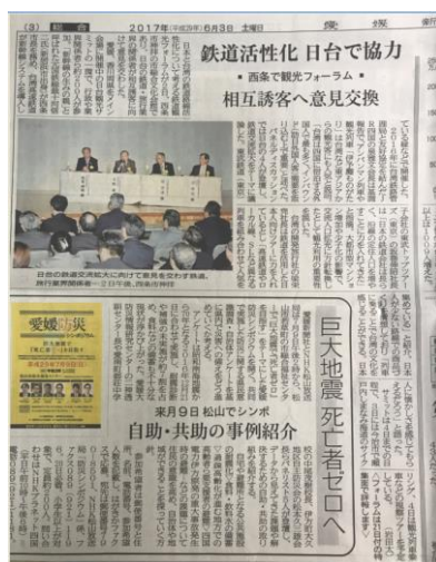
圖 29 愛媛新聞

(六)本次鐵道觀光論壇深受地方媒體注意，日本愛媛新聞在論壇舉辦的翌日(6月3日)隨即將本次論壇內情形以斗大標題「鐵道活性化 日臺協力 相互誘客 意見交換」刊登在報上，由此可見日本對鐵道交流議題十分重視。