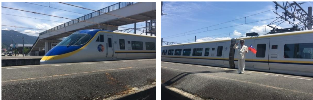
圖 16 JR 四國的臺鐵塗裝列車

JR 四國的臺鐵塗裝列車率先於 3 月 30 日上路；在 6 月 2 日觀光論壇的這天，特別調度該列車行駛通過伊予西条站和與會人員打招呼。