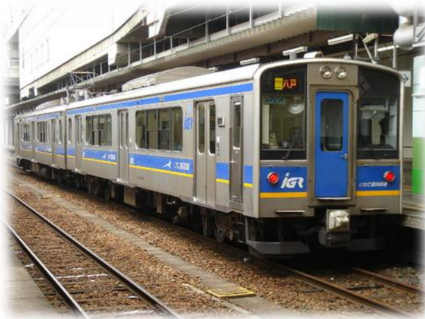
圖 22 岩手縣 IGR 銀河鐵道