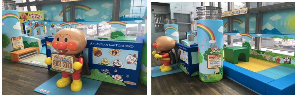
圖 3 車站 2 樓麵包超人遊戲區

車站內到處充滿麵包超人設計元素，包含垃圾桶、牆面海報文宣等，甚至發行麵包超人列車護照，裡面除路線解說、開行班次表外，還設計一系列各車站集章的蓋章處。