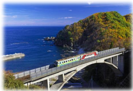
圖 21 三陸鐵道

2016 年 6 月 1 日臺鐵局山海線分別與日本岩手縣的 IGR 岩手銀河鐵道、三陸鐵道共同簽署姊妹鐵道締結書。此為臺鐵局與日本地方政府合作之首例，藉由這次締結的契機，推動 IGR、三陸鐵道兩公司與臺鐵間營業與技術交流等，也希望能帶動臺日旅客互訪以促進地方發展。