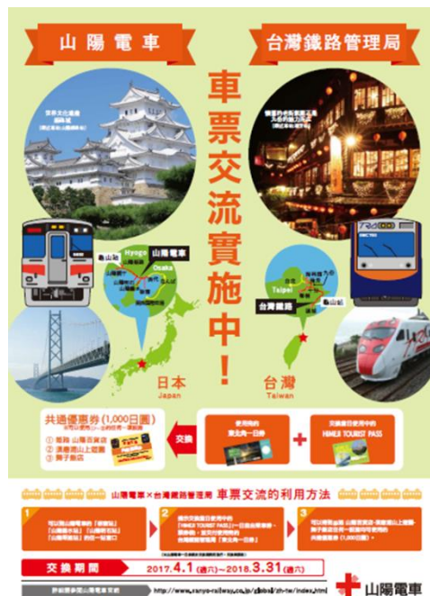
圖 19 宜蘭線與山陽電車全線締結宣傳海報

2014 年 12 月 22 日臺鐵宜蘭線與山陽電氣全線締結鐵妹鐵道，同時雙方同名車站「龜山站」締結姊妹車站。雙方並有互換票券的合作，2015 年 2 月 14 日至 2018 年 3 月 31 日期間，臺灣旅客持中華民國護照正本購買 HIMERJI I TOURIST PASS (姬路周遊券)，可免費換取相當日幣 1000 円適用於山陽百貨、須磨浦山上遊樂園、舞子飯店的優待兌換券；日本旅客持山陽電車發行之票券（三宮・姬路一日券、阪神・山陽一日券、三宮・明石市內一日券、阪神・明石市內一日券、垂水・舞子一日券(阪神版、三宮版)，即可兌換臺鐵東北角一日券。