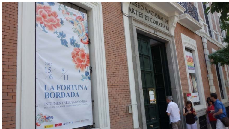
圖 3. 國立裝飾藝術博物館入口，一側掛有本展的大型告示。