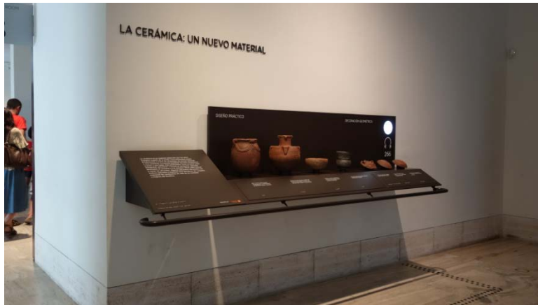
圖 10. 國立考古學博物館常設展中的複製品觸摸區。