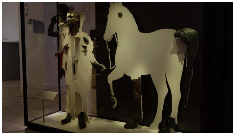
圖 12. 局部殘件的展示方式。