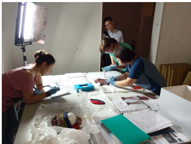
圖 1. 與西班牙館方進行展品的點交作業。