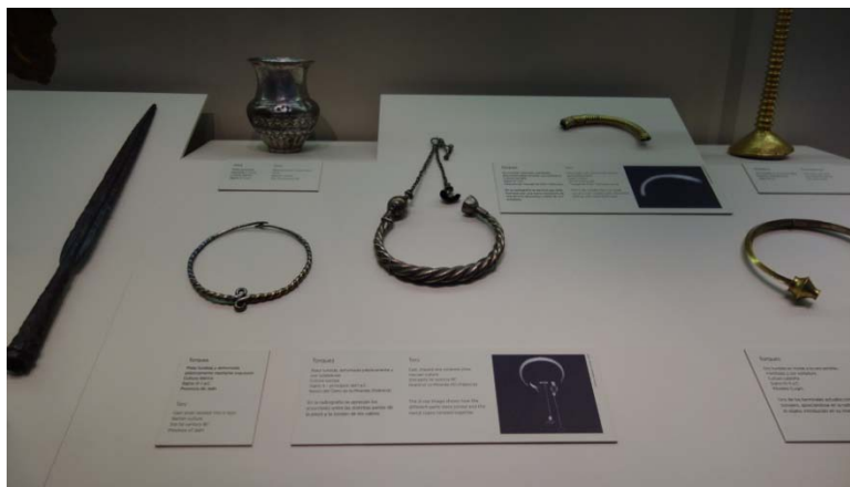
圖 11. 附有 X-ray 影像的金屬器說明展示。