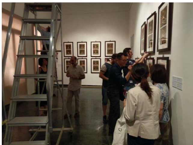
圖 2. 三方工作人員進行展場的最後調整。