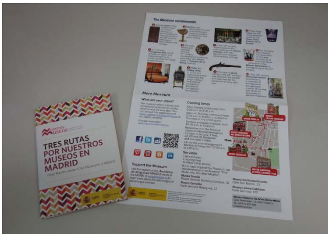
圖 9. 博物館具有聯合行銷意識的參觀文宣。