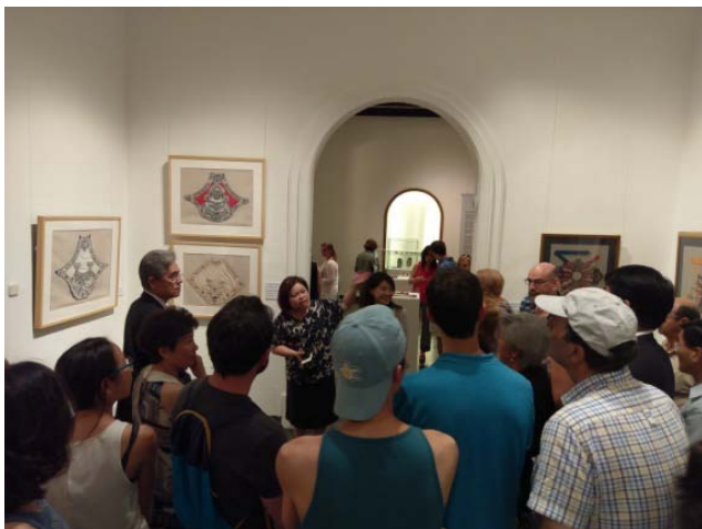
圖 6. 開幕典禮結束後的現場導覽活動。