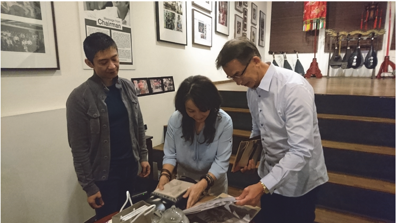
拜會訪問湘靈音樂社