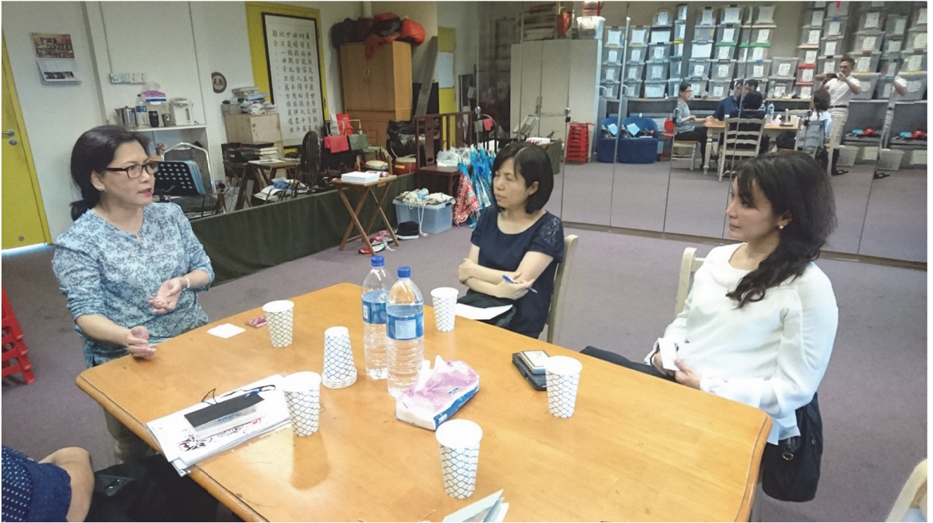
拜會訪問天韻京劇社