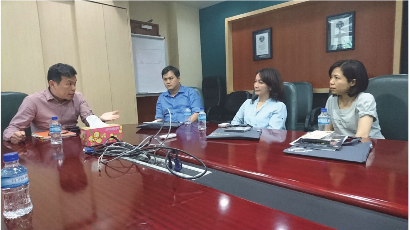
拜會訪問新加坡華樂團