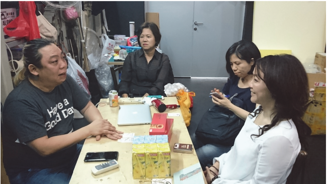
拜會訪問猴紙劇坊