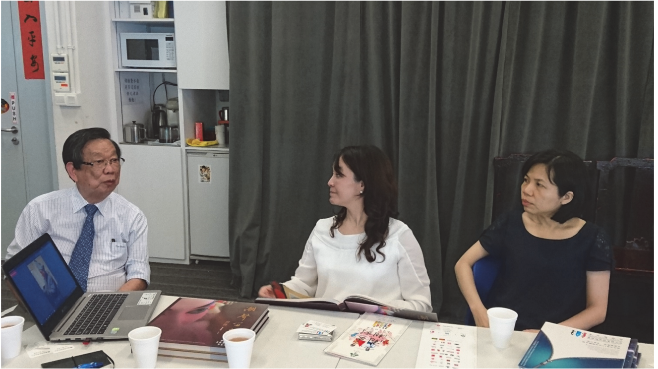
拜會訪問南華儒劇社