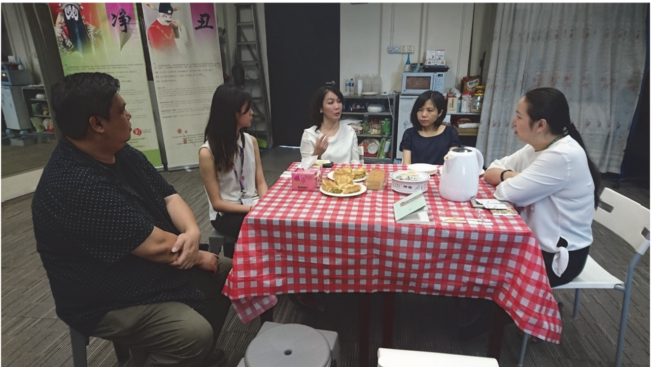
拜會訪問新加坡傳統藝術中心