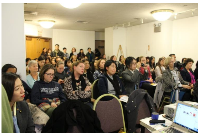
照片一 3月15日婦女權益促進發展基金會與青年代表團共同主辦「解決女性之不利處境及規範以促進婦女經濟賦權」平行會議