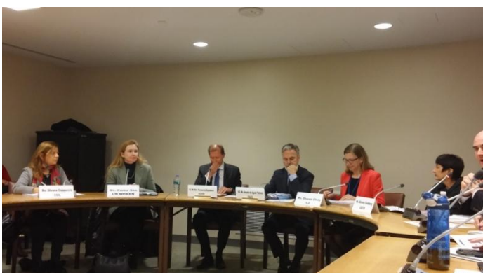
照片六 3月22日 3月22日比利時、巴西及 ILO 共同合辦「女性經濟賦權-談工作中的同質同酬」周邊會議