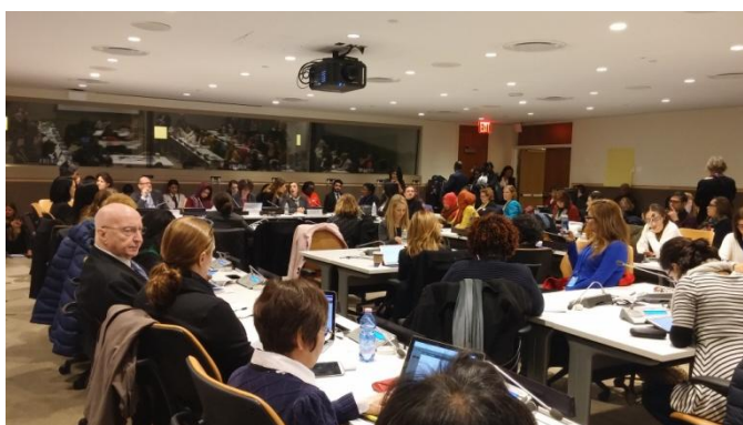
照片三 3月21日 UN Women 主辦「變動世界中的婦女議題—從國際倡議到具體行動」周邊會議