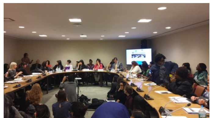
照片四 3月22日 芬蘭及 ESCR-NET 共同合辦「在工作領域實踐婦女經濟、社會及文化權利的障礙」周邊會議