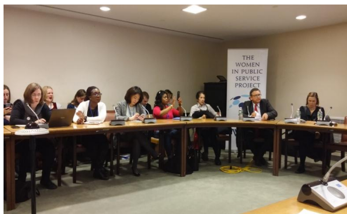
照片二 3月20日聯合國計畫發展署 (UNDP) 主辦「公共管理中的性別平等及婦女領導力—對SDGs及區域和平的影響」周邊會議