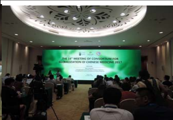
圖 4. 分組討論會場 2