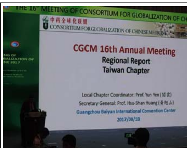
圖 2. 台灣分會黃旭山教授進行區域報告