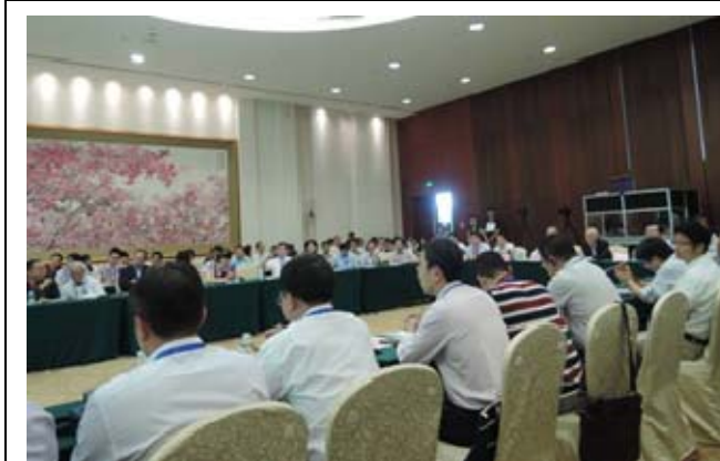
圖 3. 分組討論會場 1