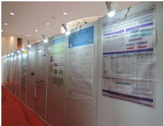
圖 7.大會壁報論文展示 2