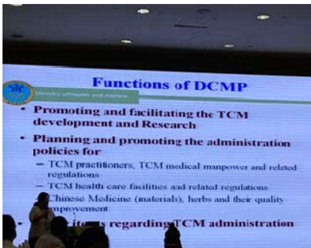
圖 9. 謝采蓓專員介紹臺灣中醫藥管理