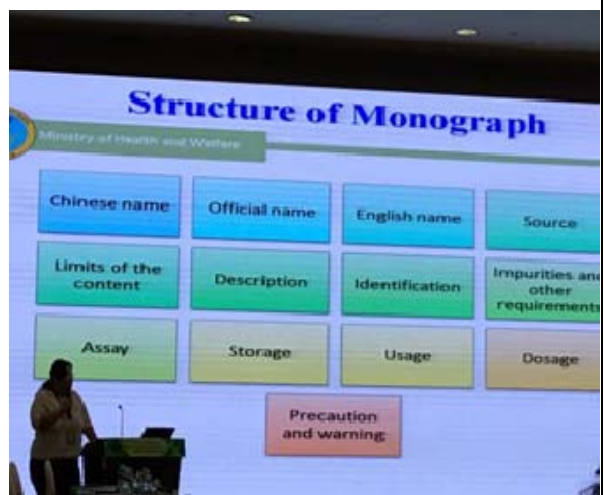
圖 10. 謝采蓓專員介紹臺灣中藥典格式