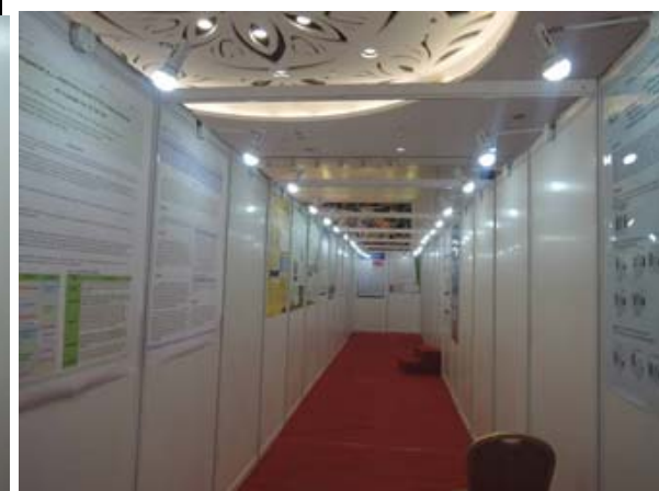
圖 6. 大會壁報論文展示 1