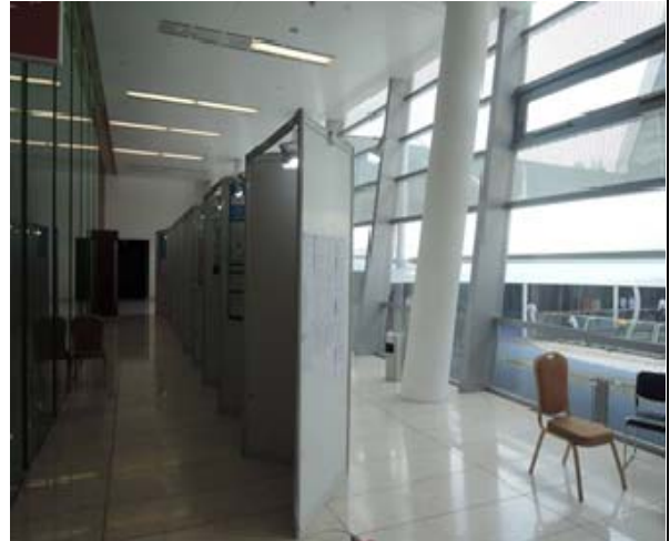
圖 8.大會壁報論文展示 3