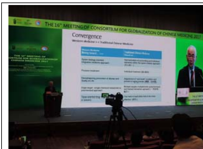
圖 1. 大會主席鄭永齊院士致詞